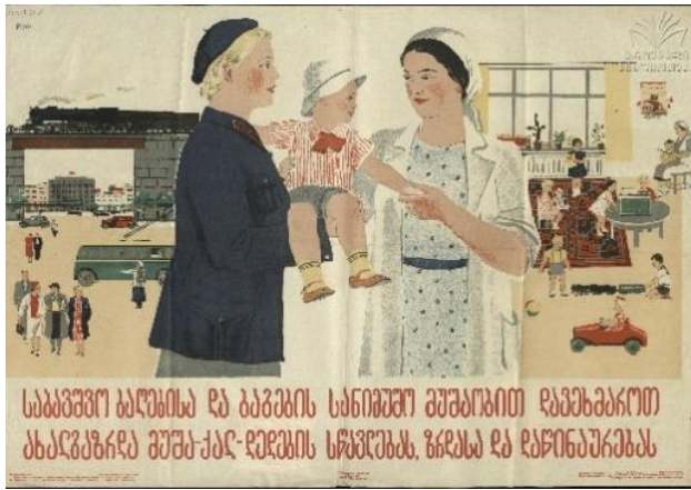
11. სურ. 11