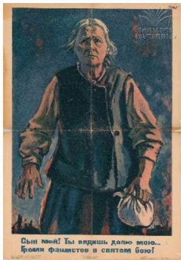
8. სურ. 8