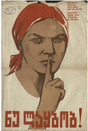
6. სურ. 6.