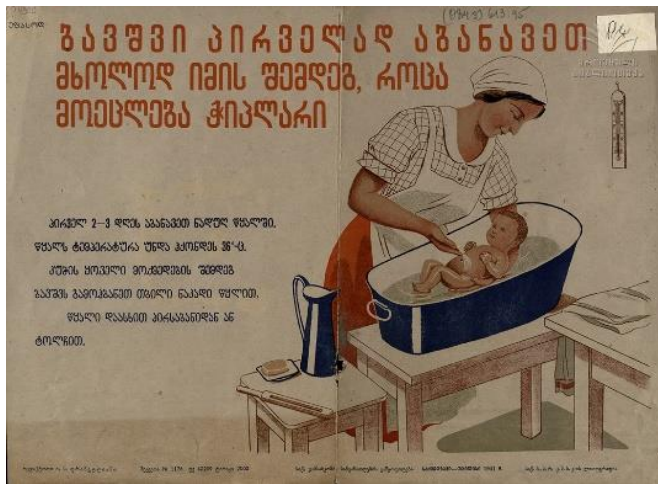
9. სურ. 9

ავტორი: საქართველოს ჯანსახკომის სანგანათლების განყოფილება. სახელწოდება: ბავშვი პირველად აბანავით მხოლოდ იმის შემდეგ, როცა მოეცლება ჭიპლარი. გამომცემლობა: თბილისი : საქმედგამი საქართველოს ს.ს.რ.კ.მ.ს. კ-ის ლითოგრაფია. წელი: 1941