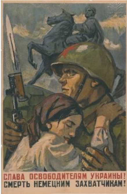
14. სურ. 14