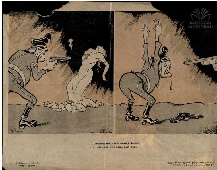
12. სურ. 12.

https://dspace.nplg.gov.ge/handle/1234/315495