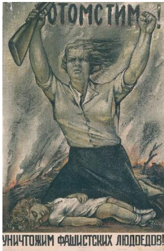
2. სურ. 2.

https://iverieli.nplg.gov.ge/handle/1234/359898?locale=ka