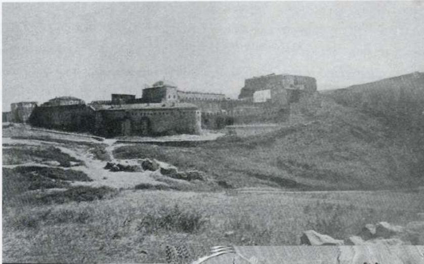
1. ვ. ვივანოვი რაბათის ციხე, გრაფიკა 1880 წ.