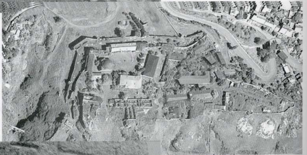
2. რაბათის ციხის ეროფოტო