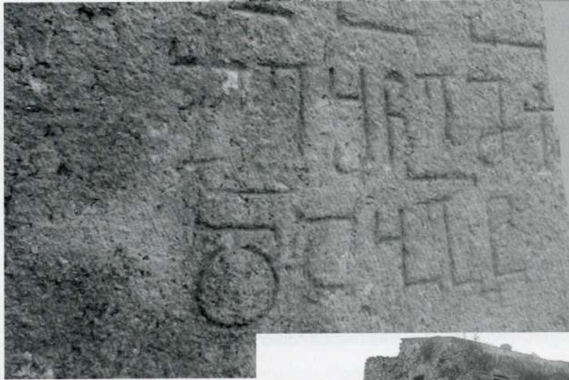
3. ასომთავრული წარწერა