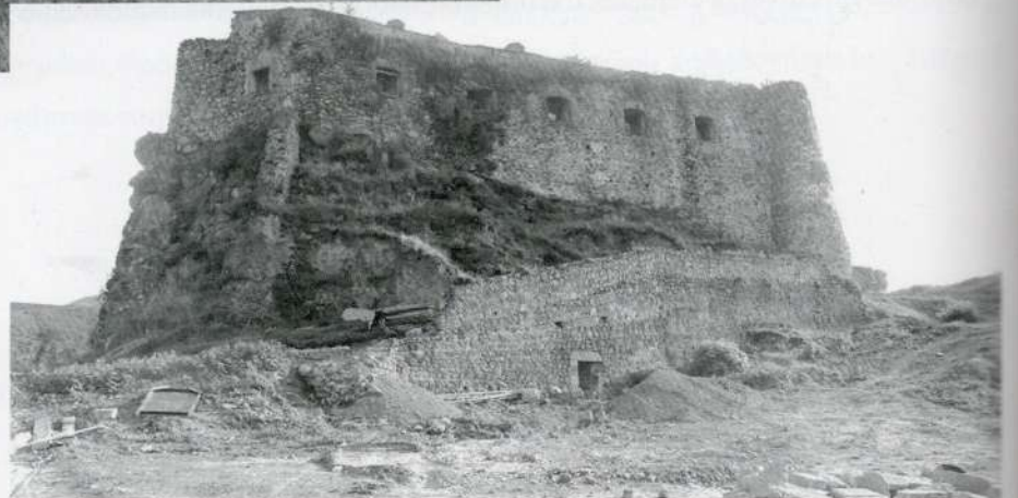
4. ციტადელი. ხედი დას-დან