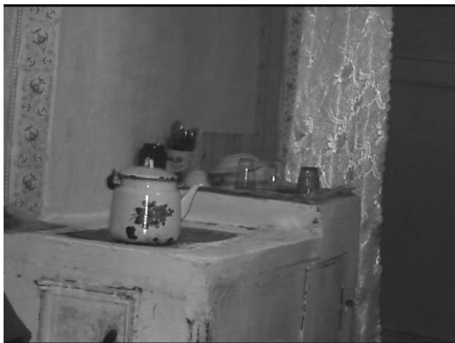
რუსული „პეჩკა“, მესხების საცხოვრებელში, კრასნოდარის ოლქი, ბელორეჩენსკი, სოფ. კომსომოლსკოე