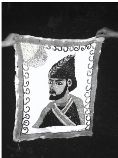
შოთა რუსთაველი (გობელენი)