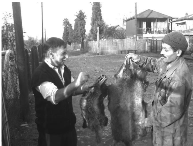
მესხი მონადირეები, სოფ. ნასაკირალი