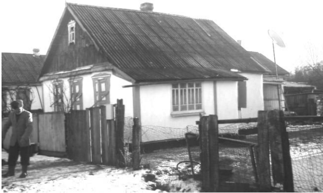
რუსული „იზბა“, მესხების საცხოვრებელი, კრასნოდარის ოლქი, ბელორეჩენსკი, სოფ. კომსომოლსკოე