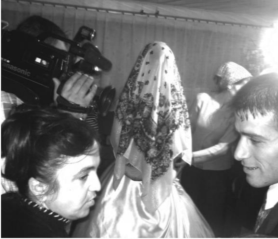
პატარძლის მიყვანა სიძის სახლში, სოფ. ნასაკირალი