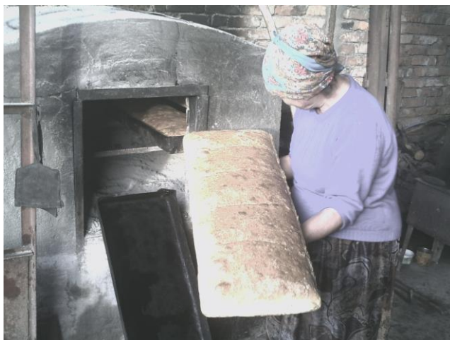
პურის ცხობა ფურნეში, სოფ. ნასაკირალი