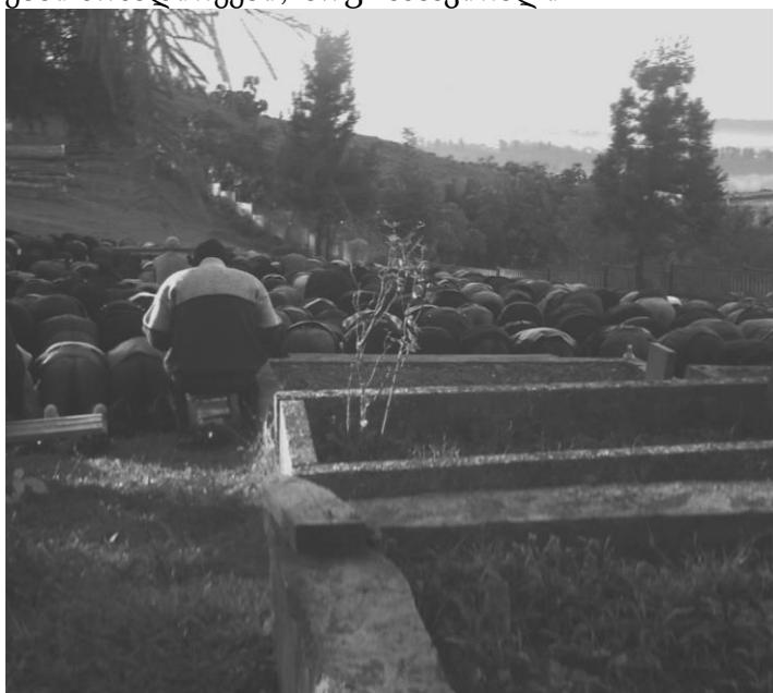
რამადან ზაირამის ნამაზი, სოფ. ნასაკირალი