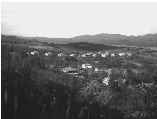
მესხური დასახლება "კუნძული", სოფ. ნასაკირალი