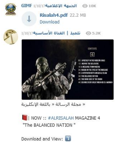
სურათი 2-ჟურნალ Alrisalah მე-4 ნომრის პოსტერი

უზიარებს ჯგუფის წევრებს. (ჯგუფში მოხვედრა შესაძლებელი გახდა ტერორიზმის კვლევისა და ანალიზის კონსორციუმის (TRAC) დახმარებით, სადაც ავტორი მუშაობს როგორც მკვლევარი.) საილუსტრაციოდ შეიძლება მოვიყვანოთ, ALRISALAH ჟურნალის მეოთხე ნომრის პოსტერი, სადაც აღწერილია თუ როგორ უნდა მივცეთ სულისკვეთება მორწმუნეებს, გზავნილი ნიგერიიდან, თანამედროვე ჯიჰადი და ა.შ. ინფორმაციას ასევე თან ერთვის ჟურნალის გადმოსაწერი ბმულიც. ტელეგრამის გარდა, კომუნიკაციის მიზნით იყენებენ (საქართველოში ყველა რესპონდენტმა დაადასტურა) whatsapp აპლიკაციას, ხოლო ევროპასა და სხვადასხვა რეგიონში ბევრისთვის უცნობ Pidgin პროგრამას, რომელიც მაღალი დაცულობისა და დაშიფრული ტექსტით მიმოწერის საშუალებას იძლევა.