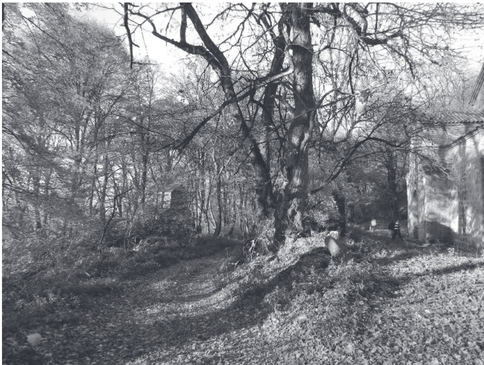
სურ. 2 ვაჩნაძიანის ძველი ეკლესია. ინტერიერი, ხედი აღმოსავლეთით