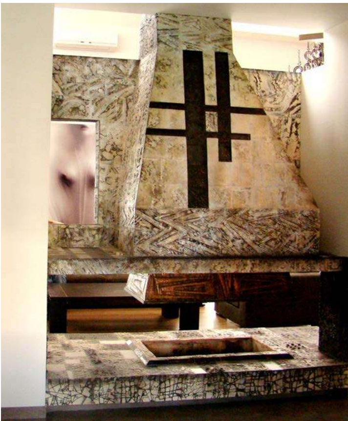
13. მარია იზორია, ბუხარი – ხევსურეთი , მამოტი, შერეული ტექნიკა, 2012 Marika Izoria, Fireplace - Khevsureti, chamotte, mixed technique, 2012