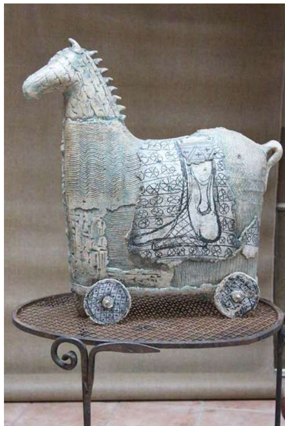
11. ოთარ ვეფხვაძე, ტროას ცხენი, შამოტი, შერეული ტექნიკა, 2012 Otar Vepkhvadze, The Trojan Horse, chamotte, mixed technique, 2012