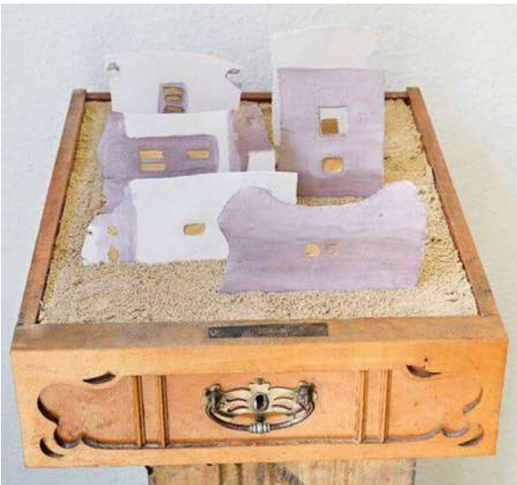
16. ლია ბაგრატიონი, ფულის ილუზია, ფაიფური, ოქრო, პლათინის ფირფიტა, ქვიშა, ავეჯი, 2003 Lia Bagrationi, Illusion of Money, porcelain, gold, platinum, sand, furniture, 2003