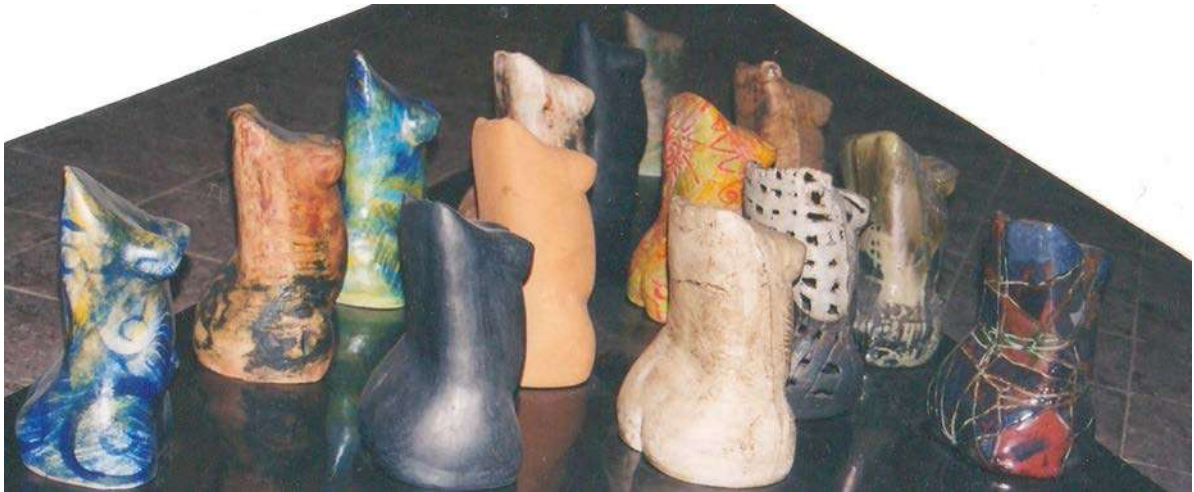
6. ნინო ციციშვილი, მატრიარქატი, კერამიკოსები, შამოტი, შერეული ტექნიკა, 1989 Nino Tsitsishvili, Matriarchy, The Ceramists, chamotte, mixed technique, 1989