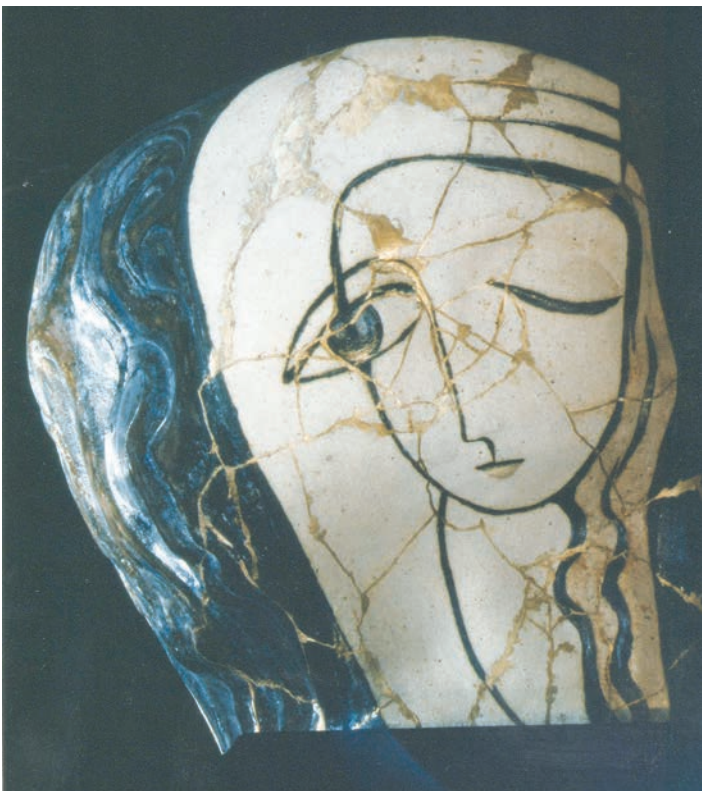
3. ქეთევან რუხაძე, მეტამორფოზა, შამოტი, შერეული ტექნიკა, 1989 Ketevan Rukhadze, Metamorphosis, chamotte, mixed technique, 1989