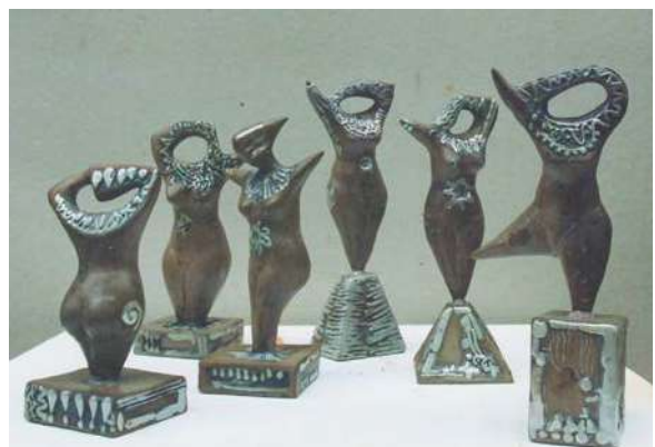
8. მარია იზორია, ცეკვა, თიხა, ნახევრადშებოლვა ვერცხლის ნიტრატი, 2001 Marika Izoria, Dance, clay, semismoking, silver nitrate, 2001