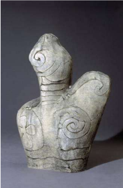
1. გიორგი იაშვილი, მხედარი, შამოტი, მარილები, 1991 George Iashvili, The Rider, chamotte, salts, 1991