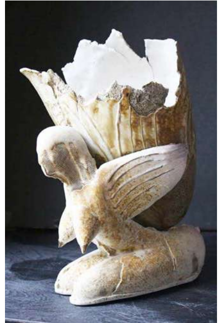
2. ოთარ ვეფხვაძე, ნაყოფიერება შამოტი, მარილები, 1990 Otar Vepkhvadze, Fertility, chamotte, salts, 1990