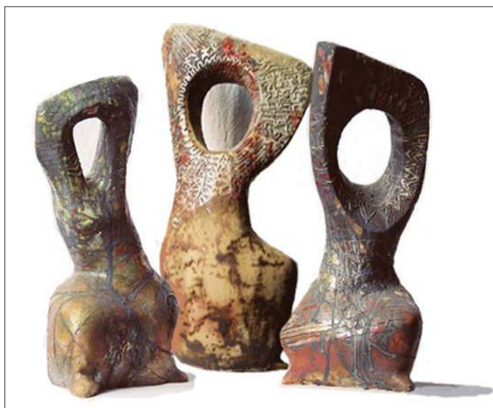
9. მარია იზორია, რიტუალი, შამოტი, შერეული ტექნიკა, 2007 Marika Izoria, Ritual, chamotte, mixed technique, 2007