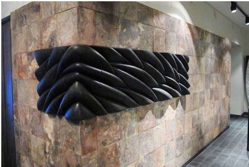
14 ა . გია (გიორგი) მიმინოშვილი, ინტერიერის კერამიკული პანო, შამოტი, შერეული ტექნიკა, კიევი, 2016 Gia (George) Miminoshvili, ceramic panel for the interior, chamotte, mixed technique, Kyiv, 2016