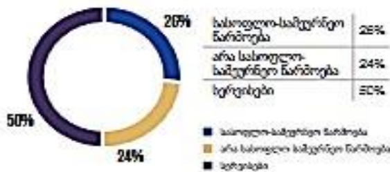
პროექტების ნილი საქმიანობის სფეროს მიხედვით