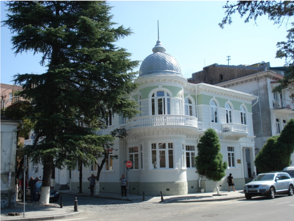
ილ. 1. აჭარის მწერალთა სახლი. XIX-XX საუკუნეების მიჯნა.