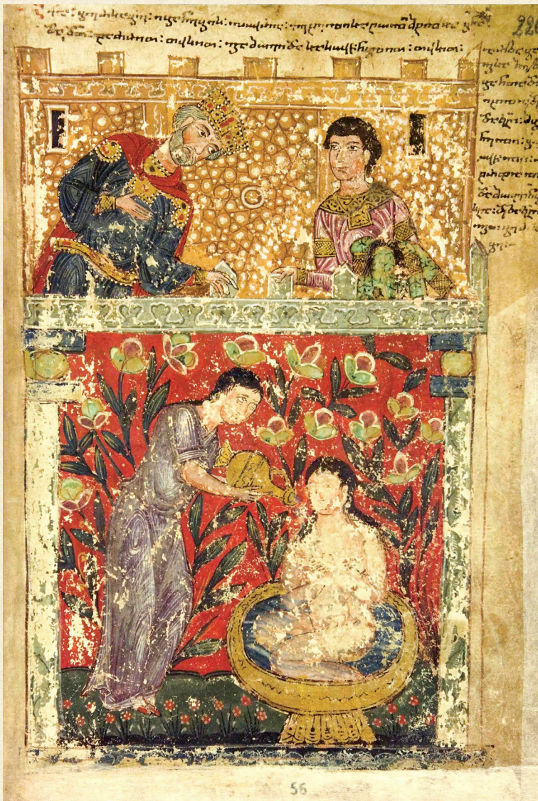
ფსალმუნნი. XV ს. | Psalter. 15 th c. მეფე დავითი და ბერსაბე | King David and Bathsheba H-1665, 226r