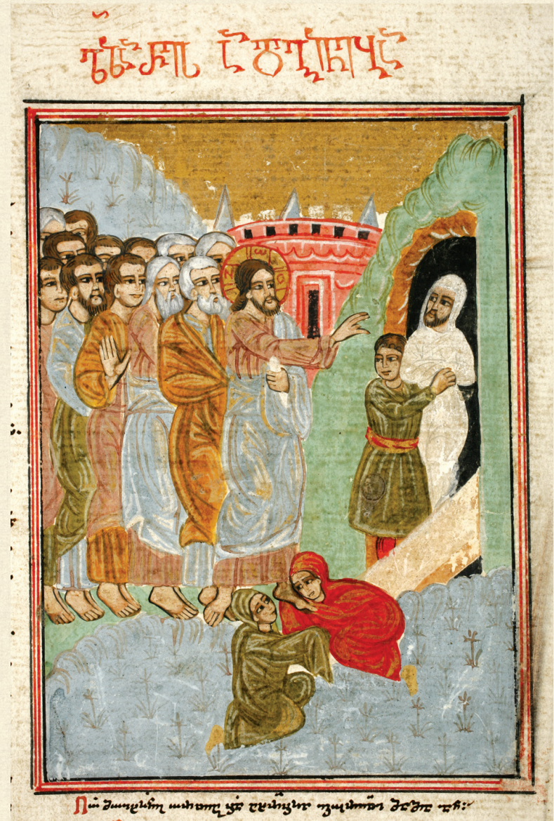
შემოქმედის გულანი. 1749 | Gulani of Shemokmedi. 1749 Q-103 b , 533r