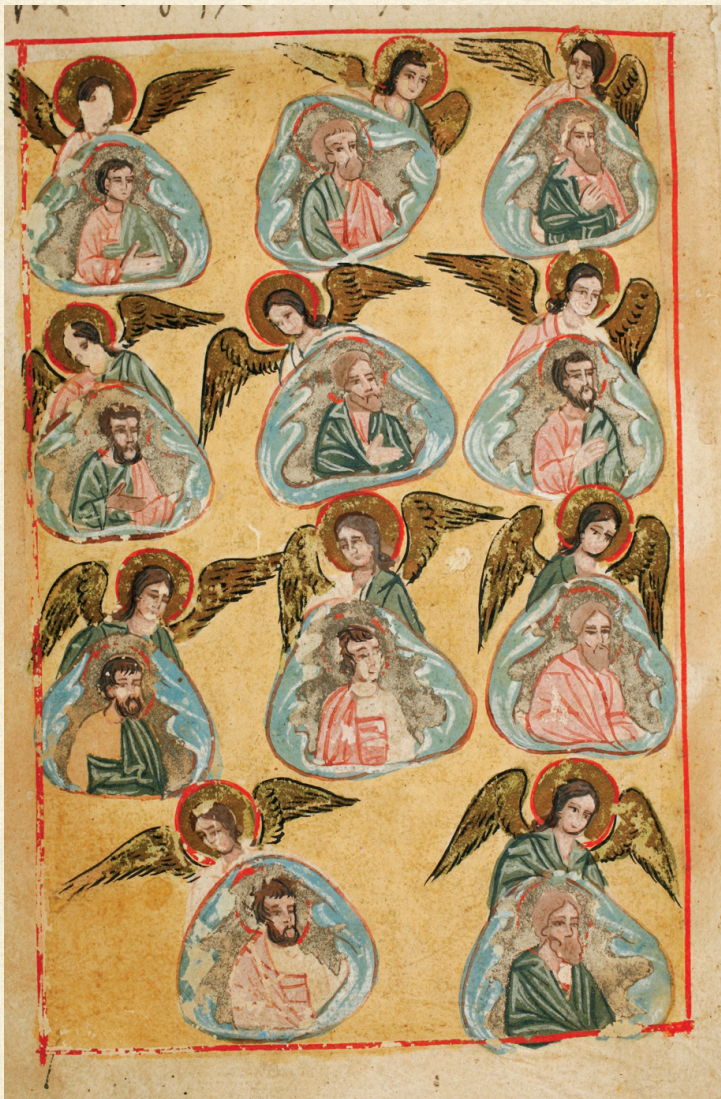
ღვთისმშობლის მიძინების სვინაქსარი. 1826 | Synaxarion of the Assumption of the Theotokos. 1826 მოციქულები | Apostles A-1556, 11v