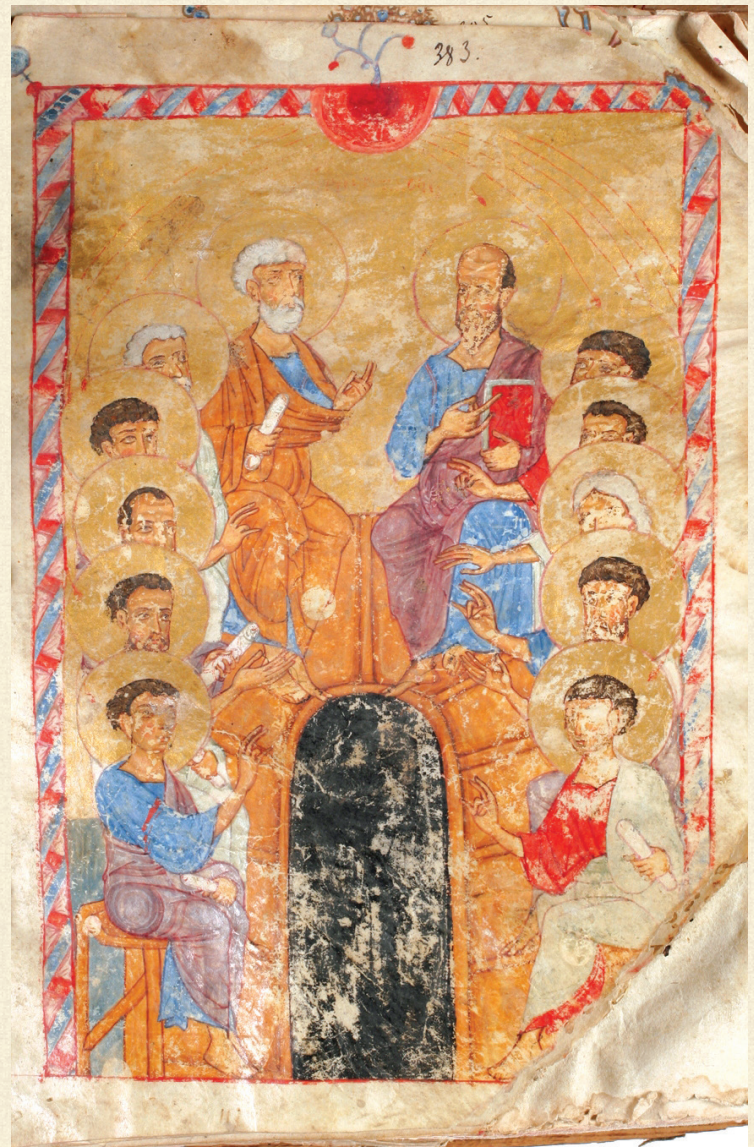
ლარგვისის ოთხთავი. XIII ს. | Largvisi Gospels. 13 th c. A-26, 383r