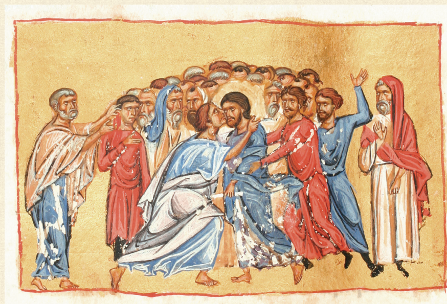
გელათის ოთხთავი. XII ს. | Gelati Gospels. 12 th c. იუდას ამბორი | Kiss of Judas A-648, 80r