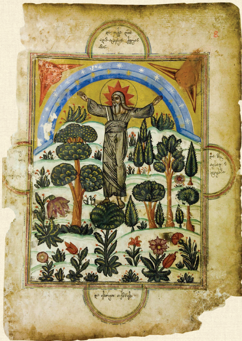
ყანაეთის ჟამნ-გულანი. 1674 | Zhamn-Gulani of Kanchaeti. 1674. სამყაროს შექმნა | Creation of the World H-1452, 8r