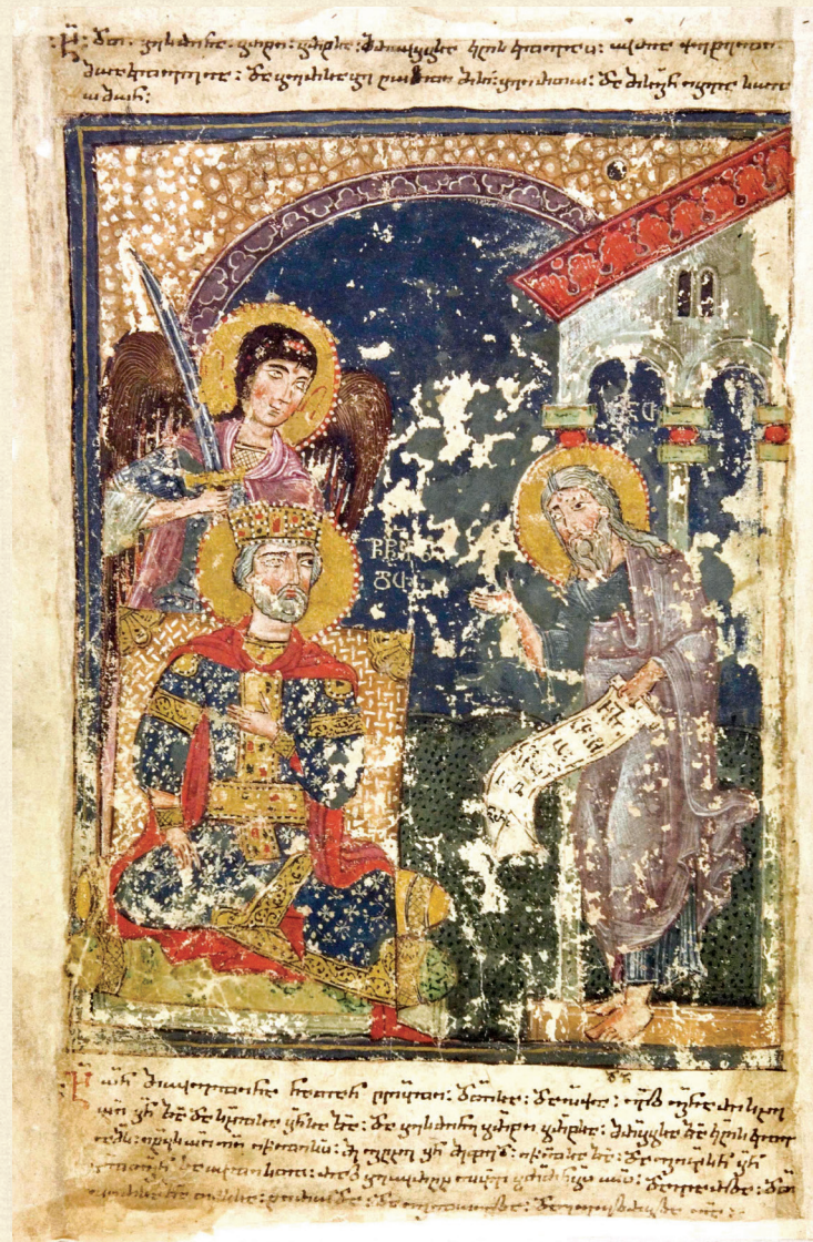
ფსალმუნნი. XV ს. | Psalter. 15 th c. მეფე დავითი და ნათან წინასწარმეტყველი | King David and the Prophet Nathan H-1665, 226v