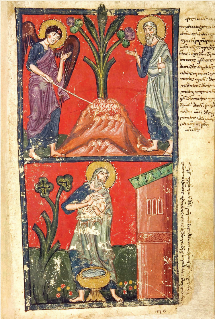
ფსალმუნნი. XV ს. | Psalter. 15 th c. გედეონი | Gedeon H-1665, 208r