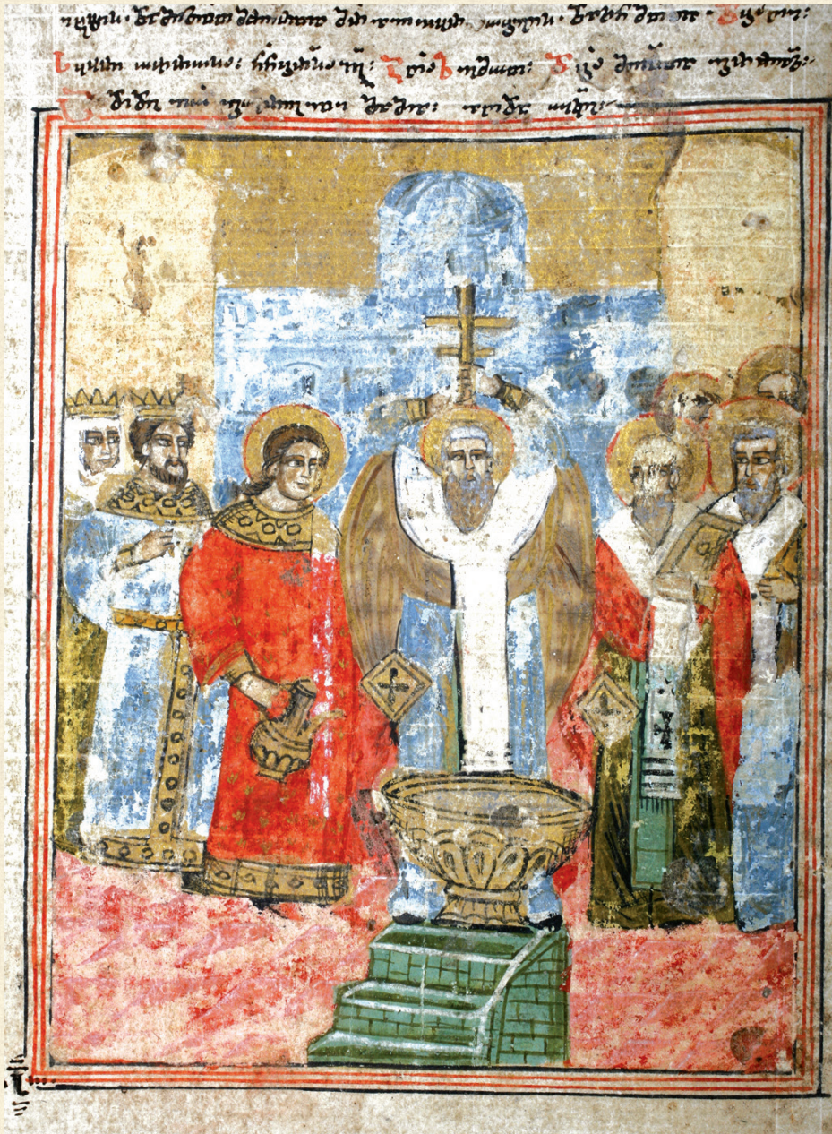
ანისხატის გულანი. 1681 | Gulani of Anchiskhati. 1681 A-32, 72r