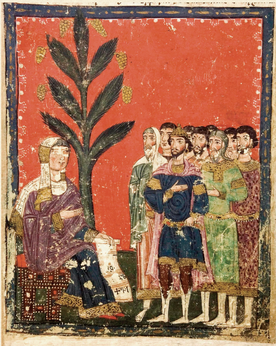
ფსალმუნი. XV ს. | Psalter. 15 th c. წინასწარმეტყველი დებორა | Prophet Deborah H-1665, 205r