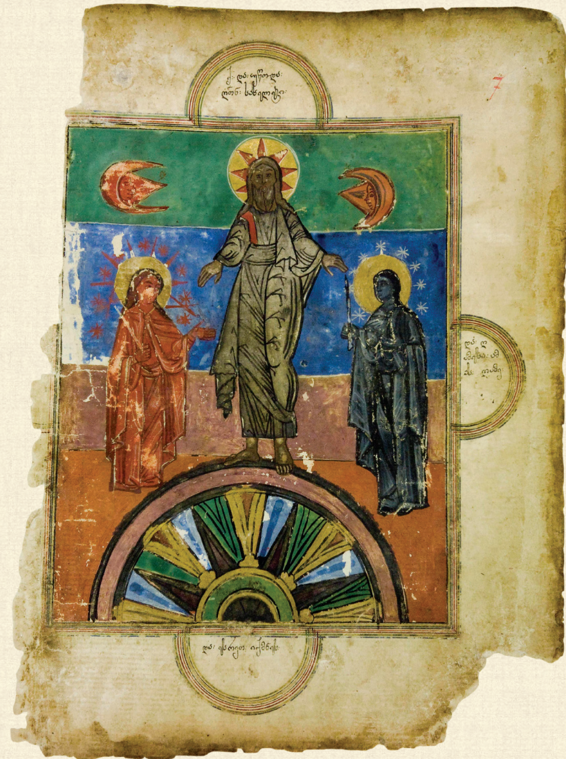
ყანზეთის ჟამნ-გულანი. 1674 | Zhamn-Gulani of Kanchaeti. 1674. დღისა და ღამის შექმნა | Creation of the Day and Night H-1452, 7r