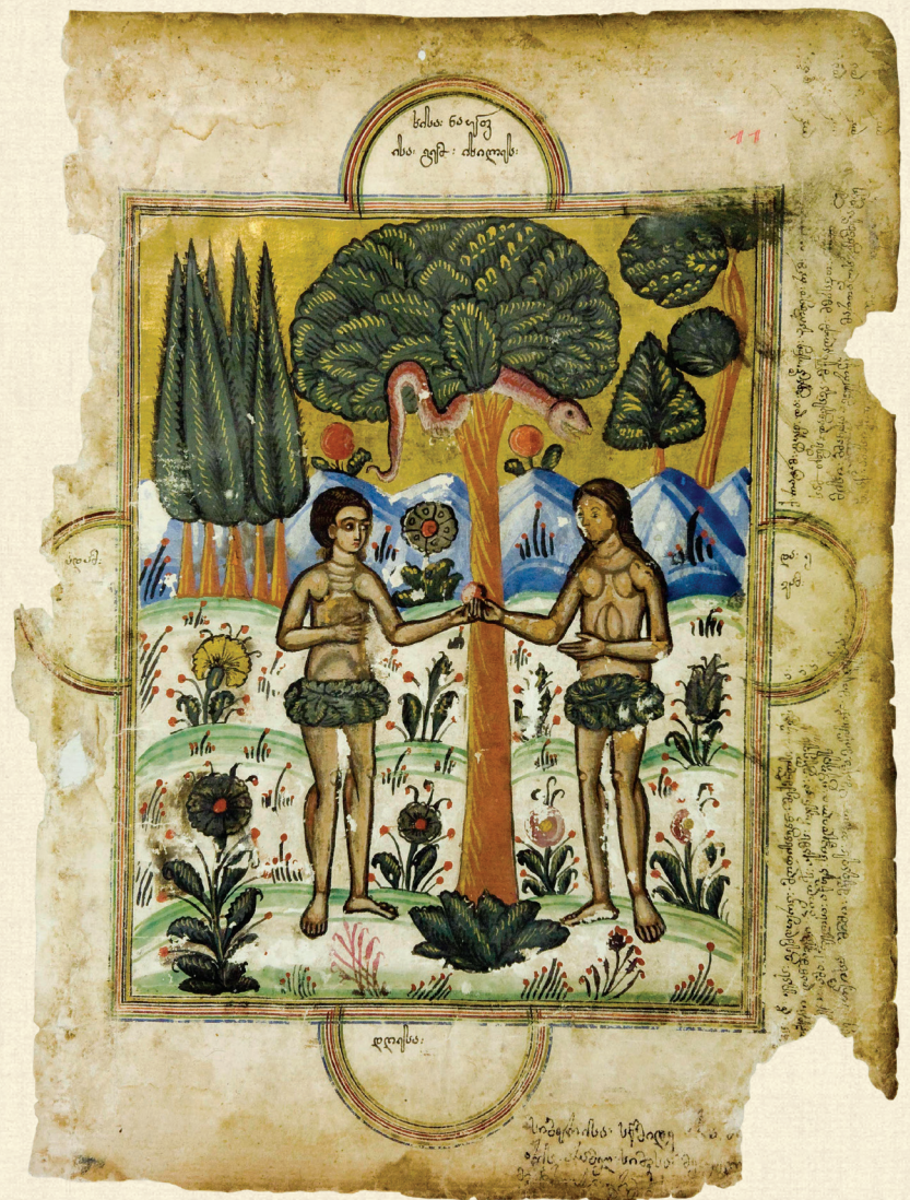
ყანაეთის ჟამნ-გულანი. 1674 | Zhamn-Gulani of Kanchaeti. 1674. ადამი და ევა სამოთხეში. ხის ნაყოფის შეცნობა | Adam and Eva in Paradise and Tree of Knowledge H-1452, 11r