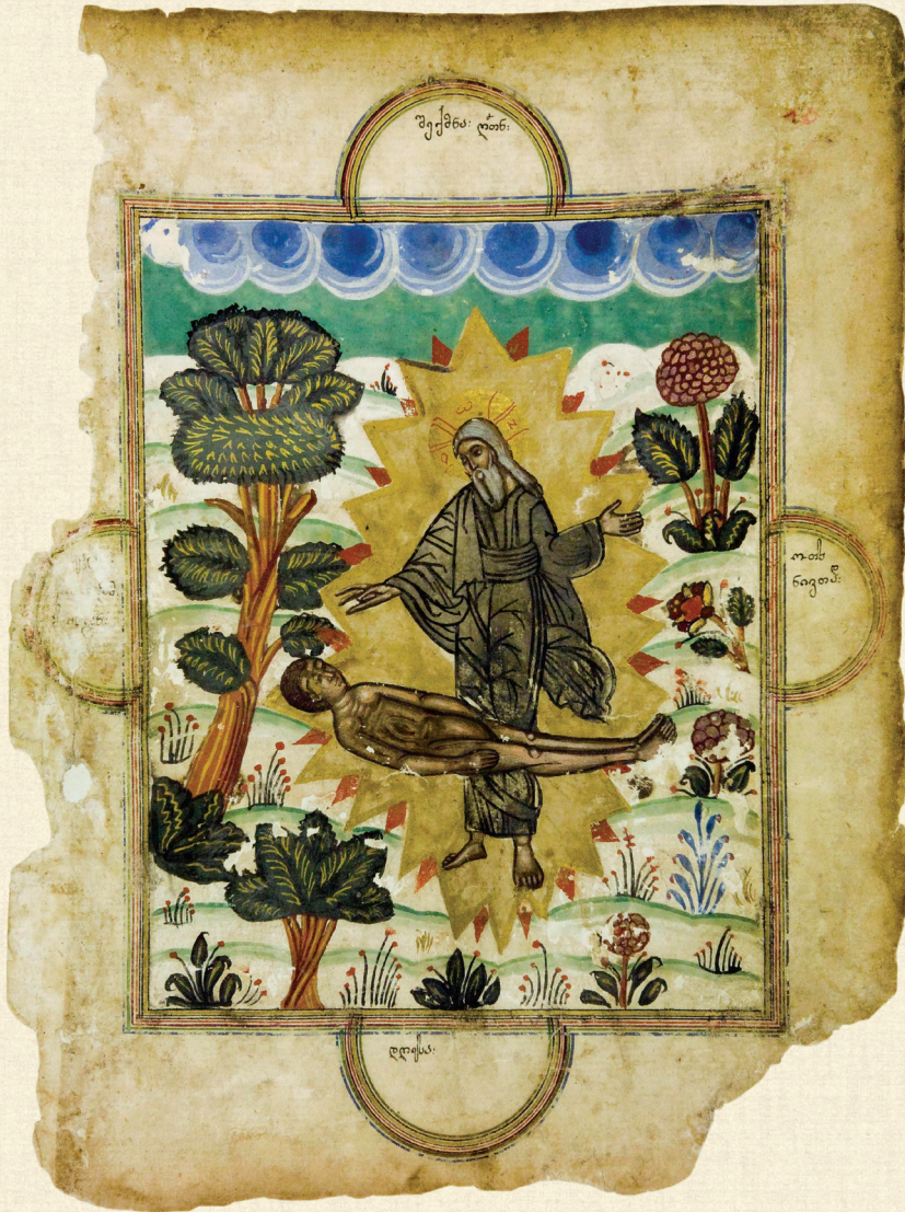
ყანაეთის ჟამნ-გულანი. 1674 | Zhamn-Gulani of Kanchaeti. 1674. ადამის შექმნა | Creation of Adam H-1452, 10r