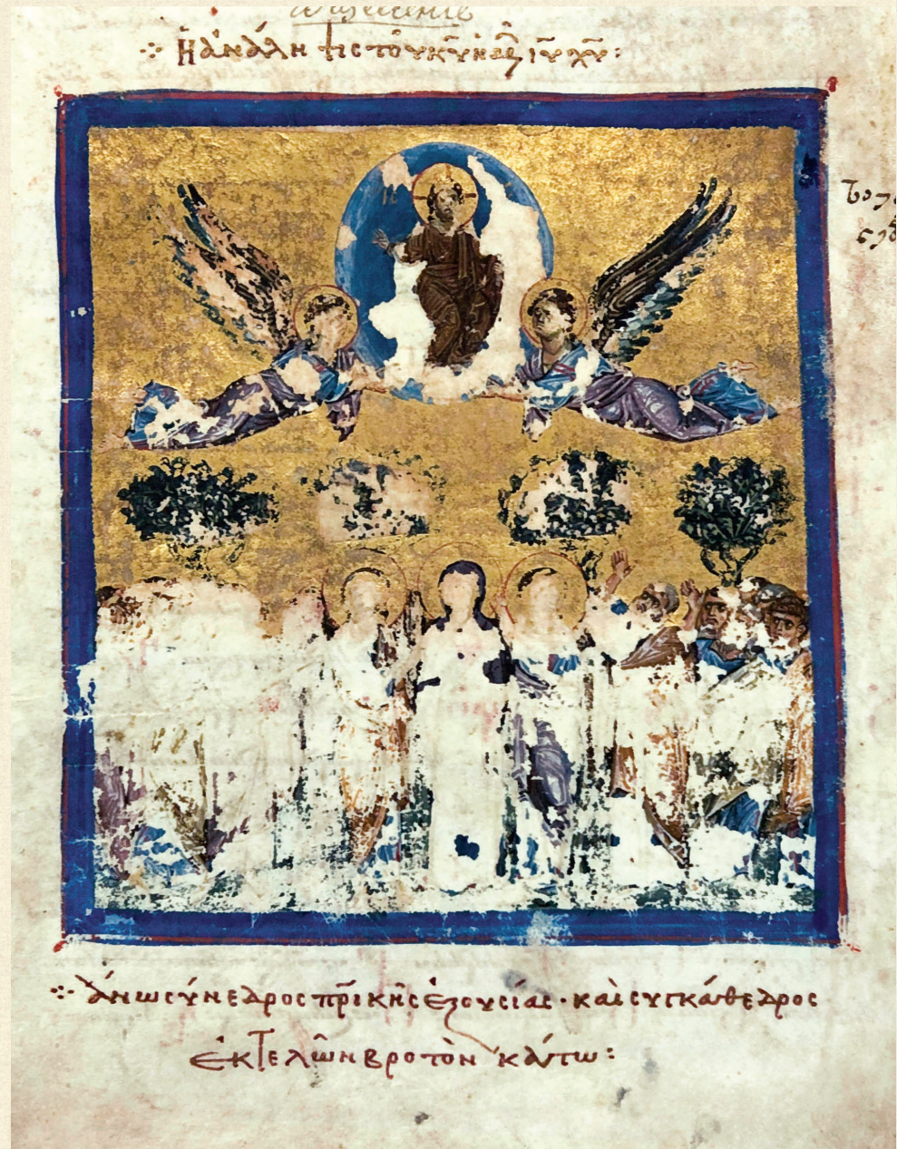
მცირე სვინაქსარი. 1030 | Minor Synaxarion. 1030 A-648, 48v

The literary sources of the Ascension are the Gospel (Mark 16: 19-20, Luke 24:50-53), Acts of the Apostles 1:9-11, homiletic and hymnography collections. The Minor Synaxarion (A-648) is the first Georgian illuminated manuscript where the theme of Ascension appears.