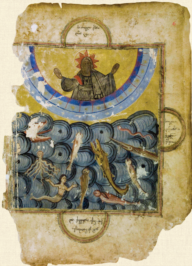
ყანზეთის ჟამნ-გულანი. 1674 | Zhamn-Gulani of Kanchaeti. 1674. ცისა და წყლის შექმნა | Creation of the Heavens and Oceans H-1452, 6r