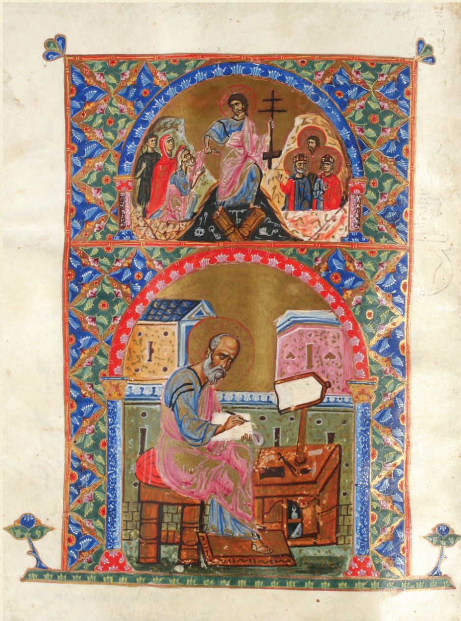
ვანის ოთხთავი. XII-XIII სს. | Vani Gospels. 12-13 th c. A-1335, 210v