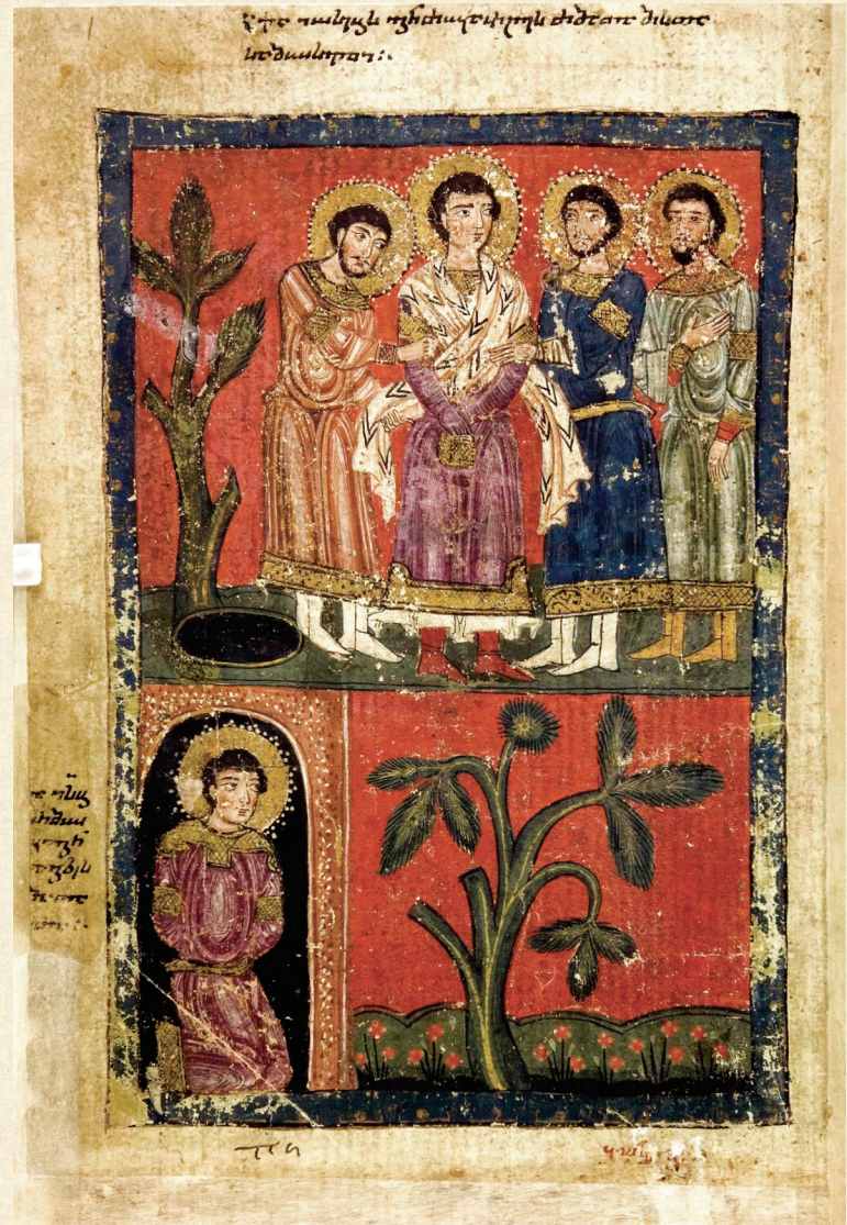
ფსალმუნნი. XV ს. | Psalter. 15 th c. იოსები და მისი ძმები | Joseph and His Brothers H-1665, 202v