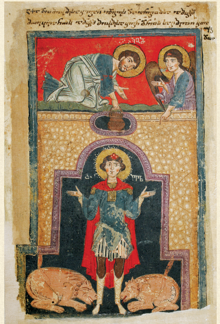
ფსალმუნნი. XV ს. | Psalter. 15 th c. დანიელი ლომთა ხაროში | Daniel in the Lion's Den H-1665, 232v