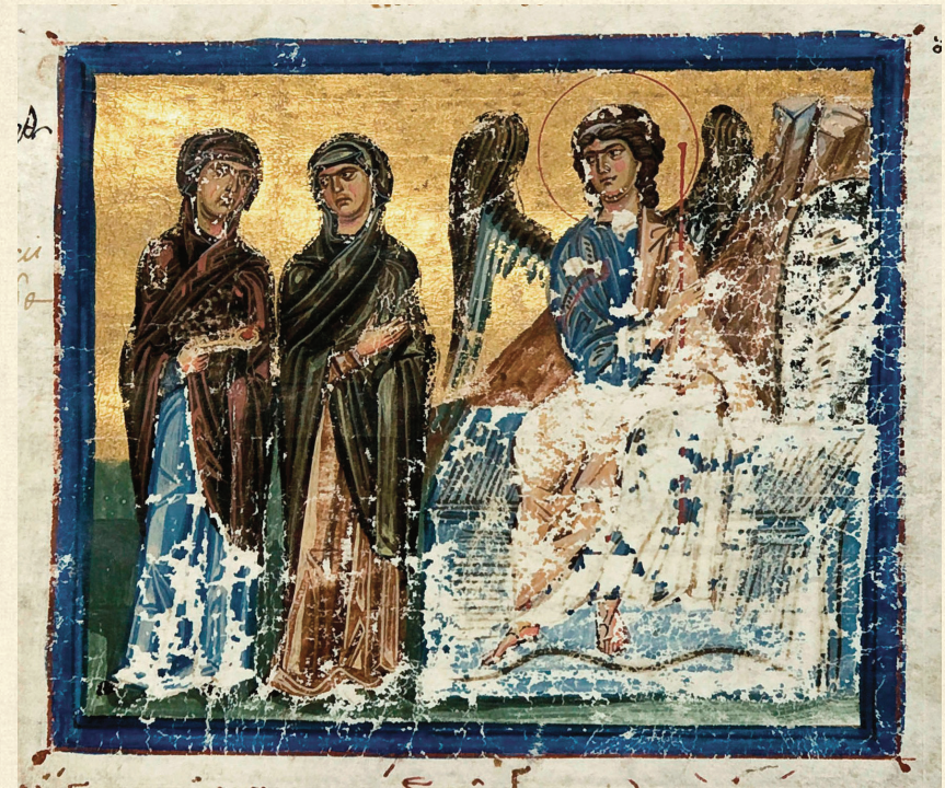
მცირე სვინაქსარი. 1030 | Minor Synaxarion. 1030 წმ. დედები მაცხოვრის საფლავთან | The Holy Women at the Tomb of Christ A-648, 42r