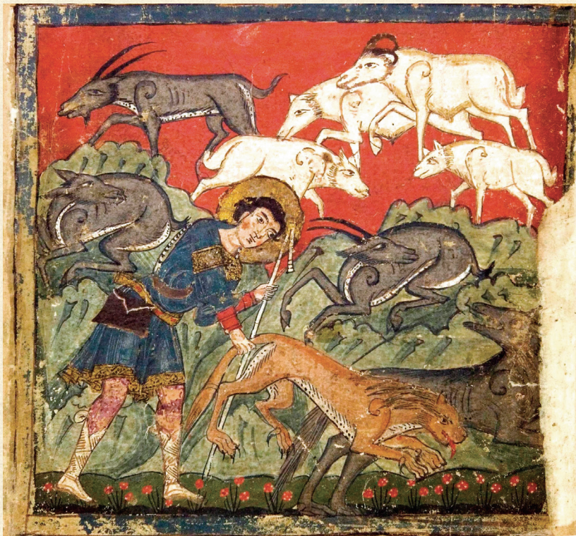
ფსალმუნი. XV ს. | Psalter. 15 th c. დავითი | David H-1665, 233v