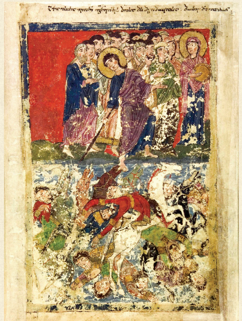
ფსალმუნი. XV ს. | Psalter. 15 th c. მეწამული ზღვის გადალახვა | The Crossing of the Red Sea H-1665, 201r