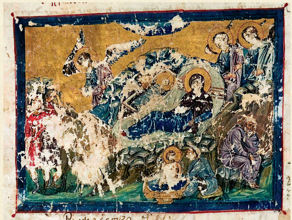
მცირე სვინაქსარი. 1030 | Minor Synaxarion. 1030 A-648, 22r

The theme of Jesus Christ's Nativity is leading in the medieval art. It was created on the basis of interpretation of the Biblical texts (Matthew 2:1-2; Luke 2:6-16) and apocryphal cycle (the Protoevangelion of Jacob, apocrypha reflecting the Saviour's childhood), as well as hymnography material represented in the liturgical collections. The themes of the Adoration of the Magi and the Annunciation to the Shepherds are also related to the theme of the Nativity of Jesus.