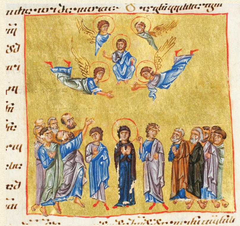
გელათის ოთხთავი. XII ს. | Gelati Gospels. 12 th c. Q-908, 220r