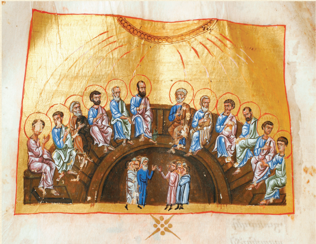
გელათის ოთხთავი. XII ს. | Gelati Gospels. 12 th c. Q-908, 220v

In old Georgian sources the Pentecost is called Mart'vilia. In the Georgian Iadgaris and late liturgical collections we can find the translations of the hymnography canons by Cosmas of Jerusalem and John of Damascus, as well as other hymnography and homiletic materials. Their original source is the Acts of Apostles 2:1-13. The miniature first appears in the Gelati Gospels (Q-908).