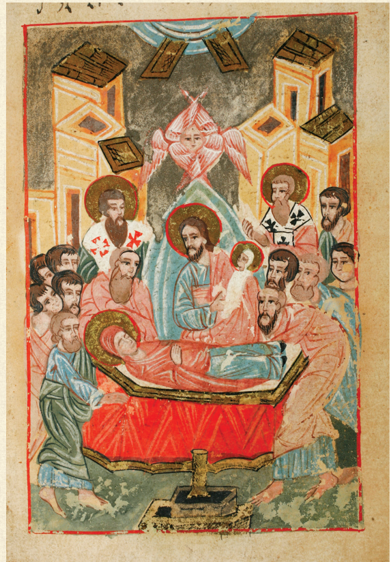
ღვთისმშობლის მიძინების სვინაქსარი. 1826 | Synaxarion of the Dormition of the Theotokos. 1826 ღვთისმშობლის მიძინება | Dormition of the Theotokos A-1556, 48r