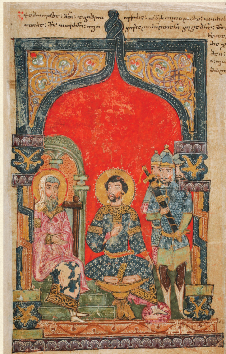
ფსალმუნი. XV ს. | Psalter. 15 th c. დავითი და აბუმელეჩი | David and Abimelech H-1665, 227r