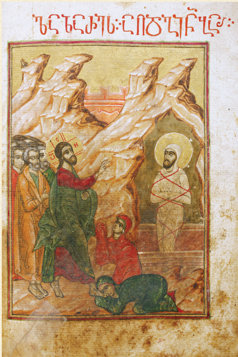
თხზავი. 1639 | Gospels. 1639 A-514, 113r