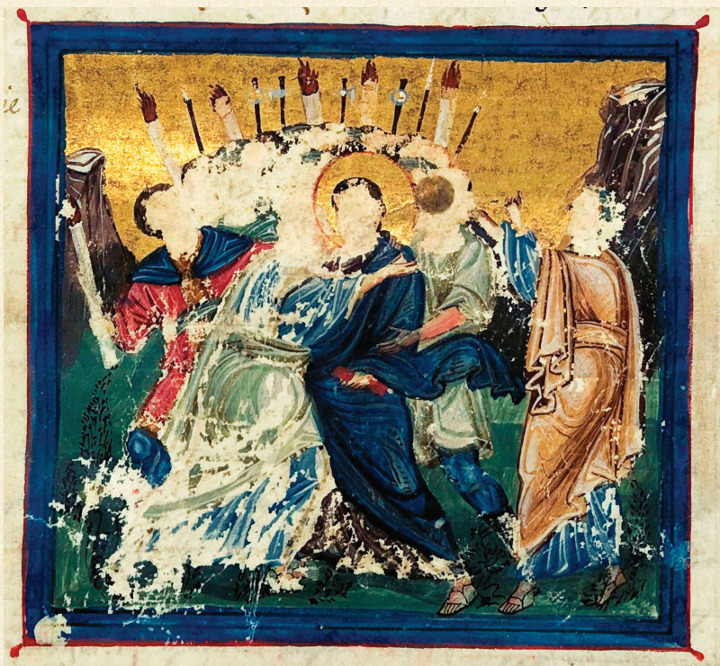
მცირე სვინაქსარი. 1030 | Minor Synaxarion. 1030 იუდას ამბორი | Kiss of Judas A-648, 36r