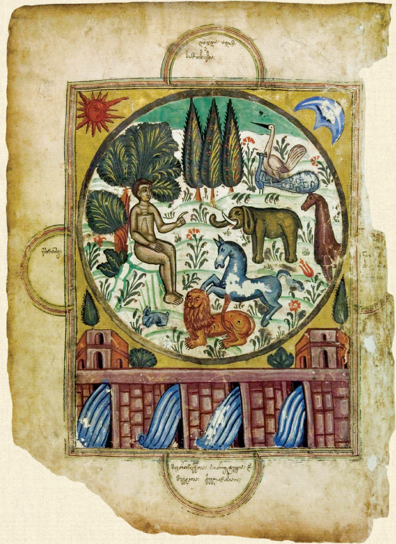
ყანაეთის ჟამნ-გულანი. 1674 | Zhamn-Gulani of Kanchaeti. 1674. ადამი სამოთხეში | Adam in Paradise H-1452, 9v