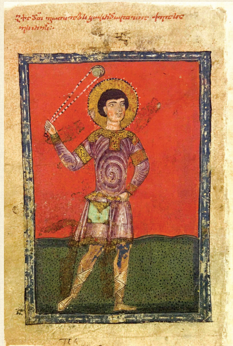
ფსალმუნი. XV ს. | Psalter. 15 th c. დავითი შურდულს სტყორცნის გოლიათს | David Shooting Goliath with a Sling H-1665, 229v