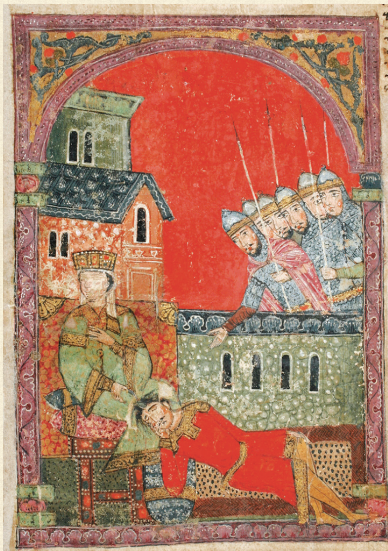
ფსალმუნი. XV ს. | Psalter. 15 th c. სამსონი და დალილა | Samson and Dalilah H-1665, 216r