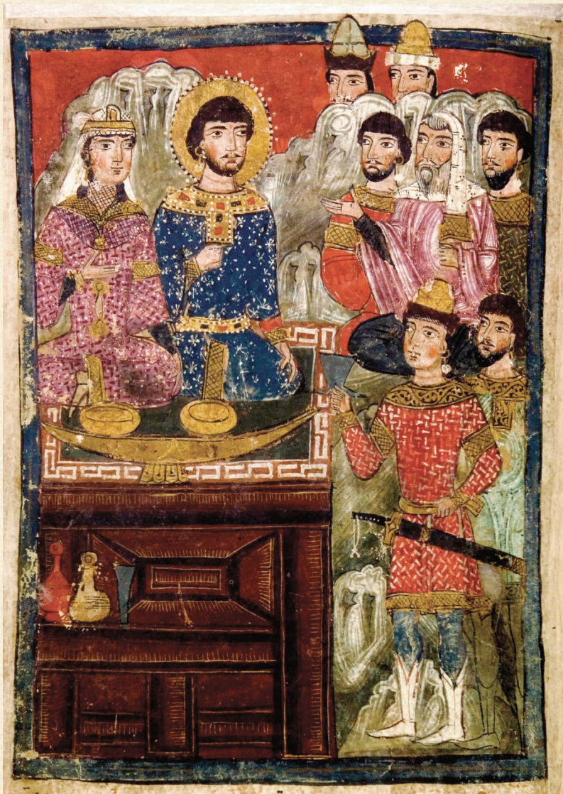
ფსალმუნი. XV ს. | Psalter. 15 th c. დავითი და აბგაი | David and Abigail H-1665, 218v