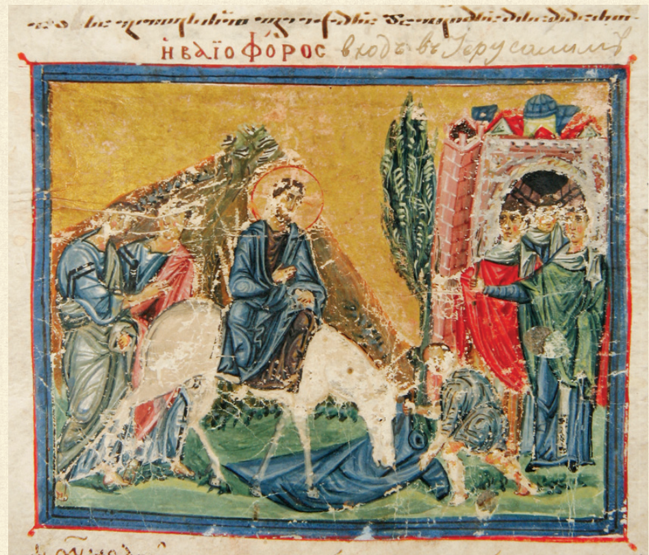
მცირე სვინაქსარი. 1030 | Minor Synaxarion. 1030 A-648, 33r

Entry into Jerusalem is described in three Gospels: Matthew (21:3-1, Mark (2:21-11 and John (12:13-14. The literary materials dedicated to this feast are relatively less in comparison with the readings and chants for other Great feasts. In the oldest Iadgari we find the chants dedicated to Jesus' entry into Jerusalem. John Chrysostom, Meletius of Antioch and other authors wrote the Palm Sunday homilies /Homilies for Palm Sunday/. The first time the miniature reflecting the Jesus' Entry into Jerusalem appears in the Minor Synaxarion (A-648 and it proves the maturity and full development of the iconographic schemes.