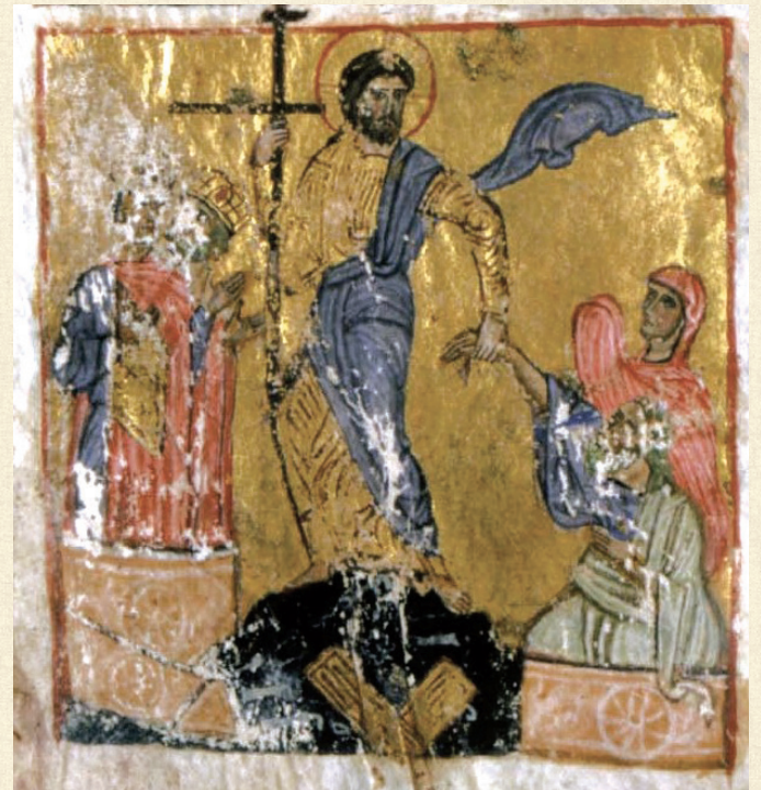
ჯრუჭის ოთხთავი. XII-XIII სს. | Jruchi Gospels. 12-13 th c. H-1667, 195r