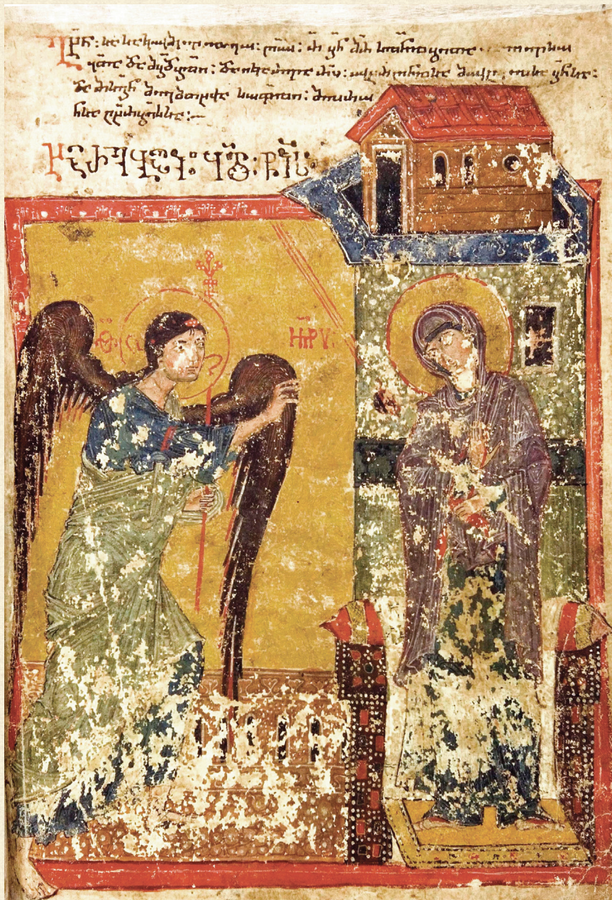
ფსალმუნნი. XV ს. | Psalter. 15 th c.