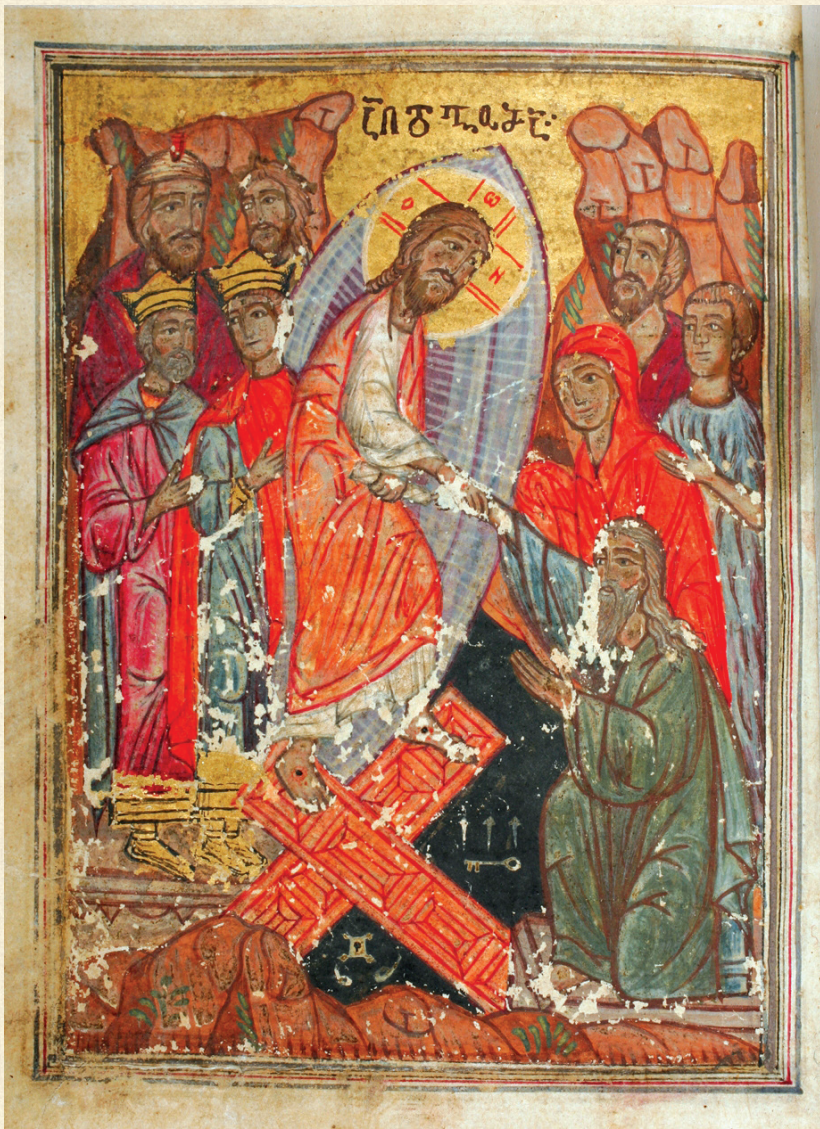
გურიანთული გულანი. XVIII ს. | Gulani of Gurianta. 18 th c. Q-104, 45v