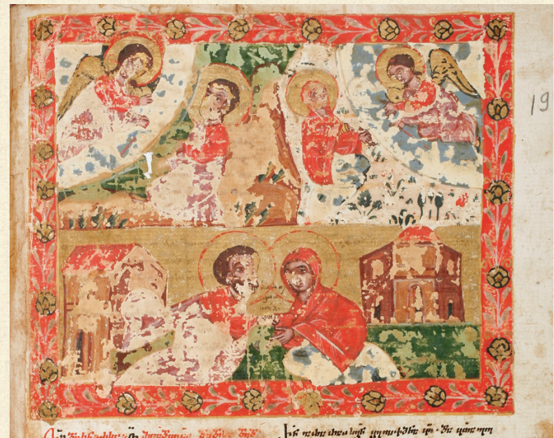
ანჩისხატის გულანი. 1681 | Gulani of Anchiskhati. 1681 ღვთისმშობლის ტაძრად მიყვანა | The Entrance of the Theotokos into the Temple A-30, 197r