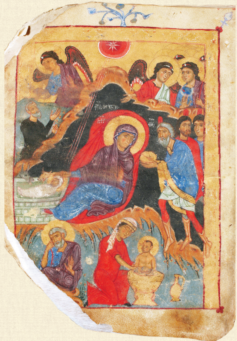
ღარგვისის ოთხთავი. XIII ს. | Largvisi Gospels. 13 th c. A-26, 24v