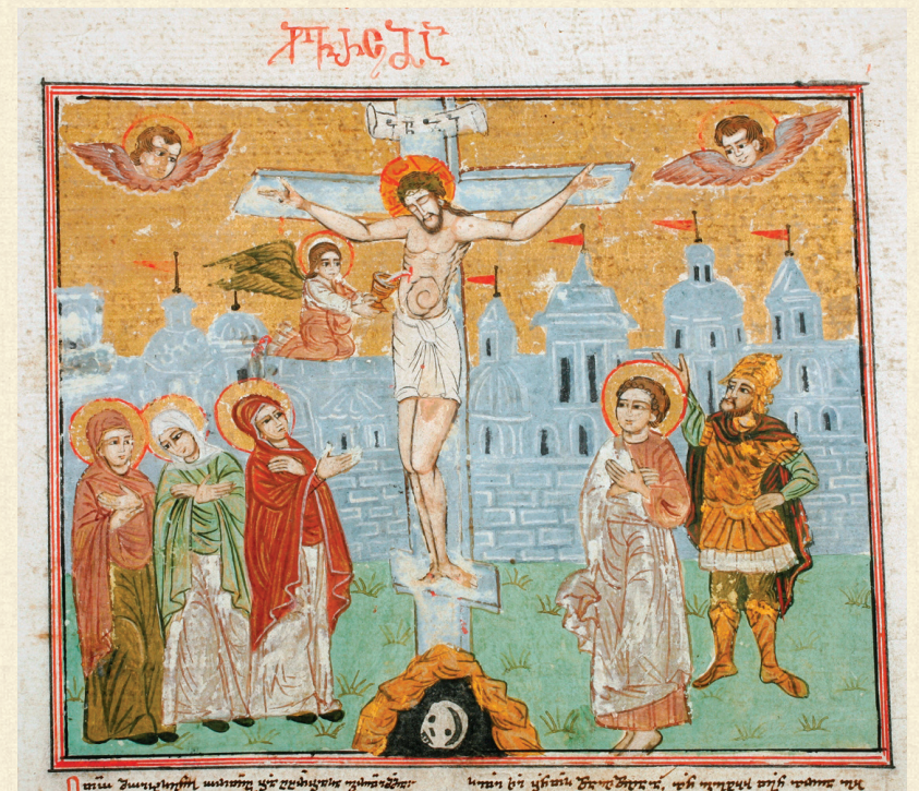
შემოქმედის გულანი. 1749 | Gulani of Shemokmedi. 1749 Q-103 o , 557r