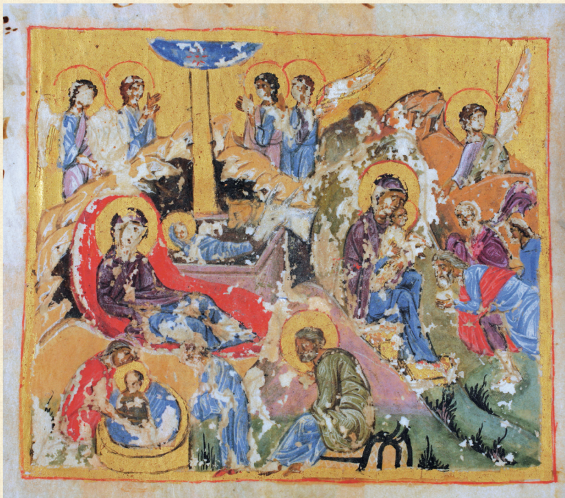
გელათის ოთხთავი. XII ს. | Gelati Gospels. 12 th c. Q-908, 18r