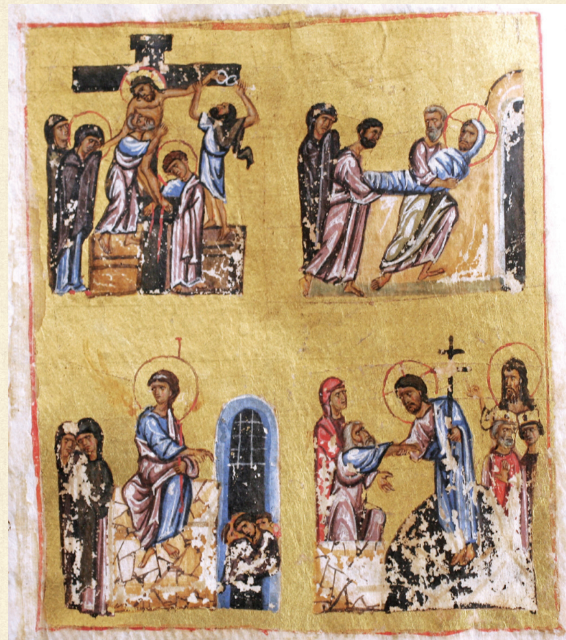
გელათის ოთხთავი. XII ს. | Gelati Gospels. 12 th c. Q-908, 273v