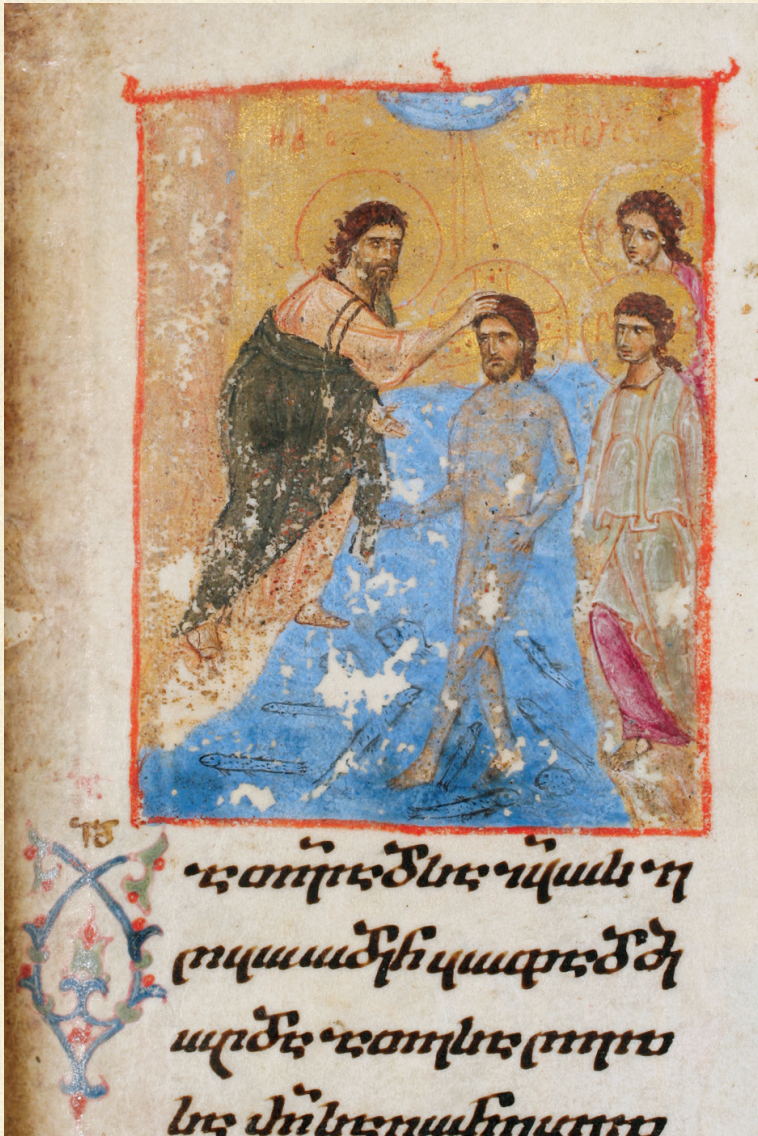
ჯრუჭის ოთხთავი. XII-XII სს. | Jruchi Gospels. 12-13 th c. H-1667, 135r