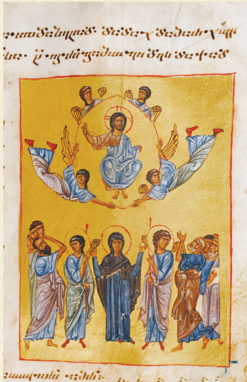
გელათის ოთხთავი. XII ს. | Gelati Gospels. 12 th c. Q-908, 140r