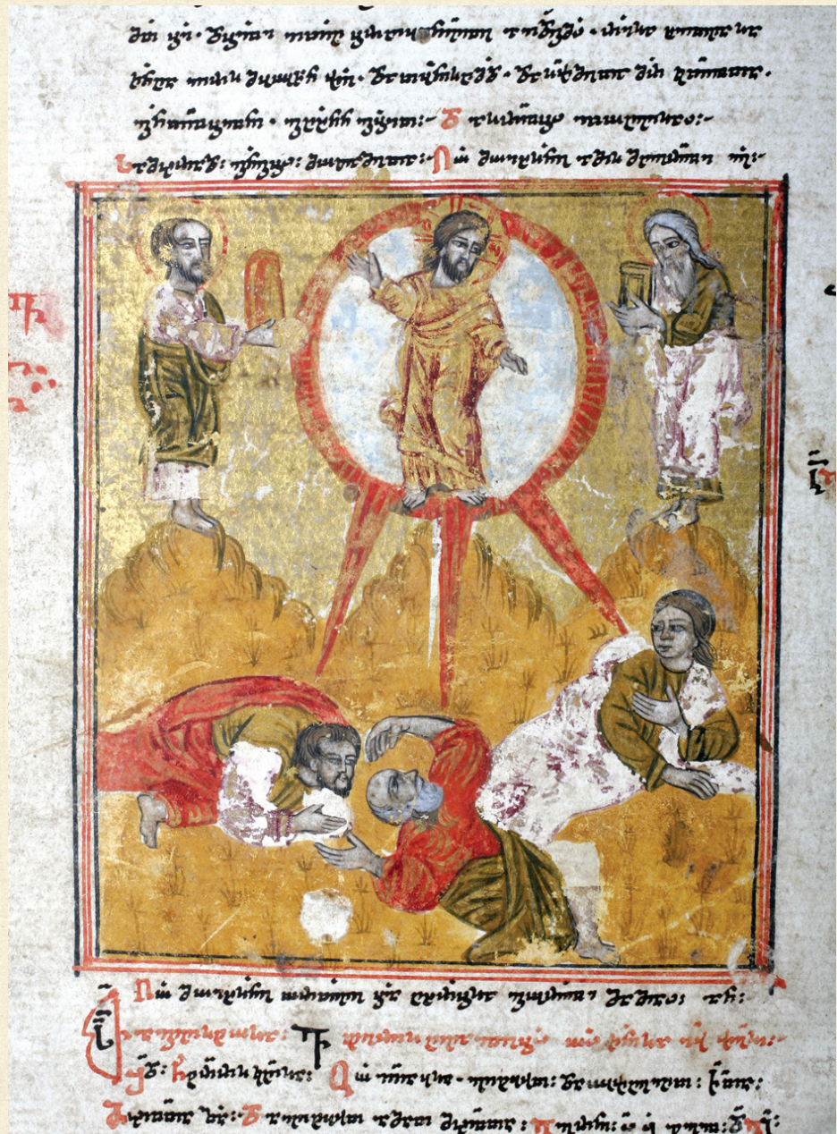
ლიტურგიკული კრებული. XV ს. | Liturgical Book. 15 th c. K-115, 156a