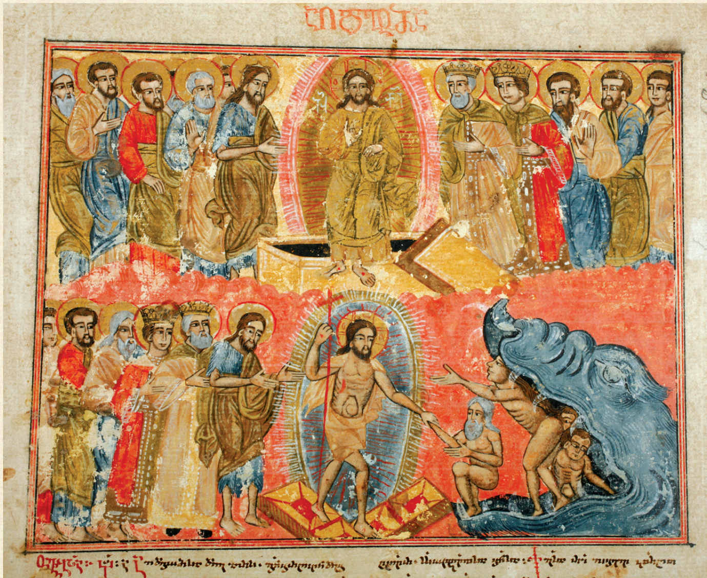
შემოქმედის გულანი. XVIII ს. | Gulani of Shemokmedi. 18 th c. Q-103 o , 577r