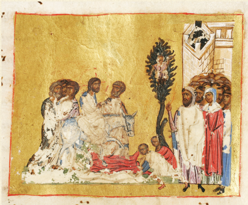
გელათის ოთხთავი. XII ს. | Gelati Gospels. 12 th c. Q-908, 64v