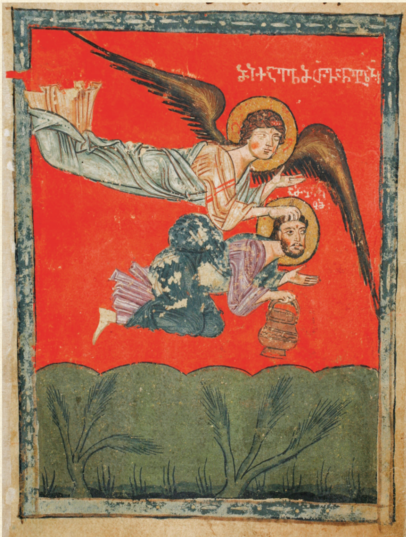
ფსალმუნნი. XV ს. | Psalter. 15 th c. მიქაელ მთავარანგელოზს მიჰყავს აბბაკუმ წინასწარმეტყველი დანიელთან ლომთა ხაროში | Archangel Michael takes Habakkuk to Daniel in Lion's Den H-1665, 232r