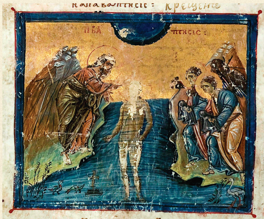
მცირე სვინაქსარი. 1030 | Minor Synaxarion. 1030 A-648, 26r

In the medieval art, it is seen as Jesus Christ's manifestation to the world as the Saviour – so called Epiphany. The first composition of the Epiphany is given in the Small Synaxarion (A-648). This is a first appearance of this theme in Georgian manuscripts. We can see the literary corroboration of the Epiphany in the texts of the Gospel (Matthew 3:1-17, Mark 1:4-10, Luke 3: 4-19, John 1:26-30), as well as in the hymnography (for instance, the translations of the Canon of the Epiphany by Cosmas of Jerusalem) and homiletic collections (for instance, the homilies by Gregory of Nyssa, Eusebius of Alexandria, John Chrysostom, Proclus of Constantinople, etc.).