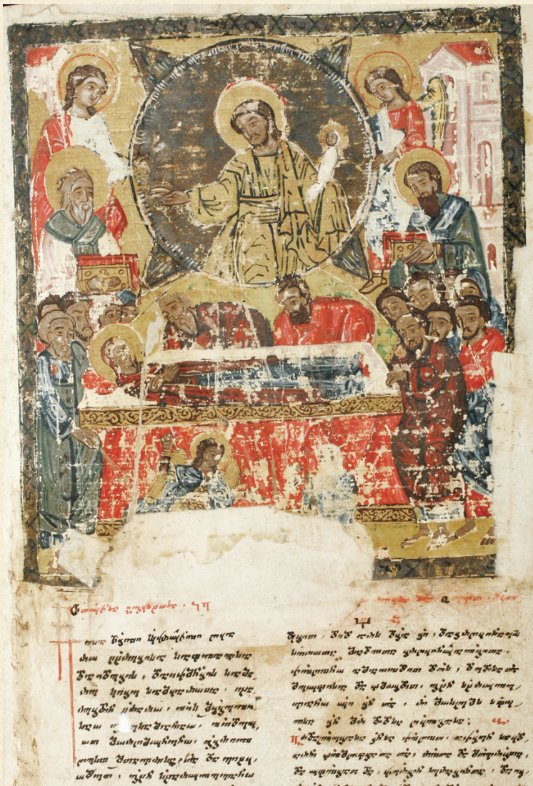
ანჩისხატის გულანი. 1681 | Gulani of Anchiskhati. 1681 ღვთისმშობლის მიძინება | Dormition of the Theotokos A-30, 295r