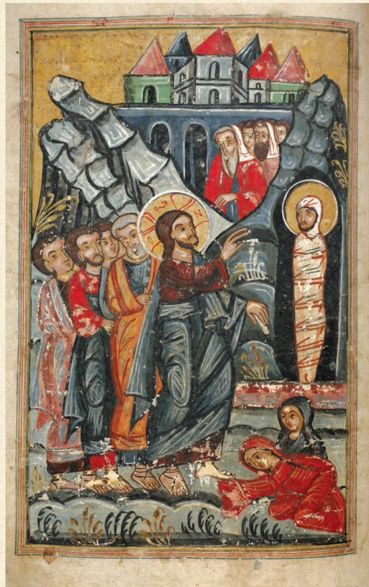
თხზავი. XVII ს. | Gospels. 17 th c. A-619, 210v