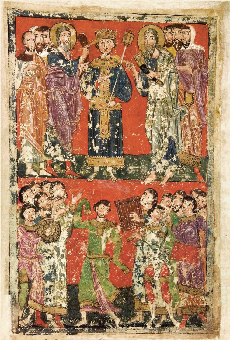
ფსალმუნი. XV ს. | Psalter. 15 th c. სოლომონის ზეთის ცხება. სოლომონის როკვა | Solomon was anointed as King. Dance of Solomon H-1665, 219r