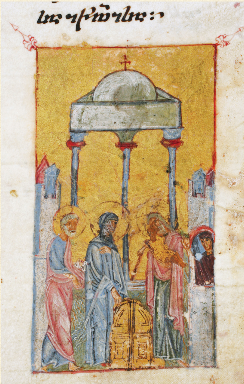
ჯრუჭის ოთხთავი. XII-XIII სს. | Jruchi Gospels. 12-13 th c.