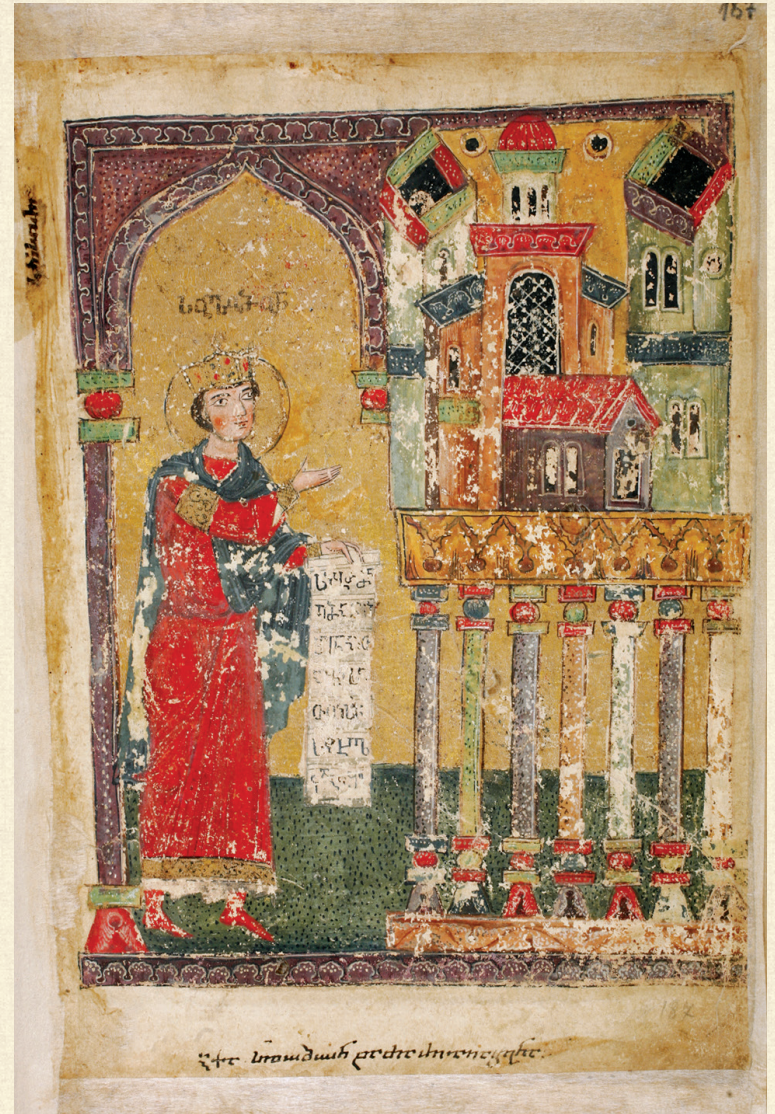
ფსალმუნი. XV ს. | Psalter. 15 th c. სოლომონის ტაძარი | Temple of Solomon H-1665, 187r