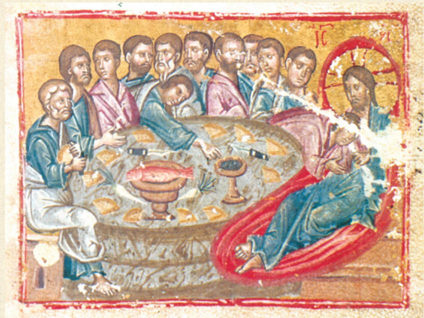
მოქვის ოთხთავი. 1300 | Mokvi Gospels. 1300 საიდუმლო სერობა | The Last Supper Q-902, 89v