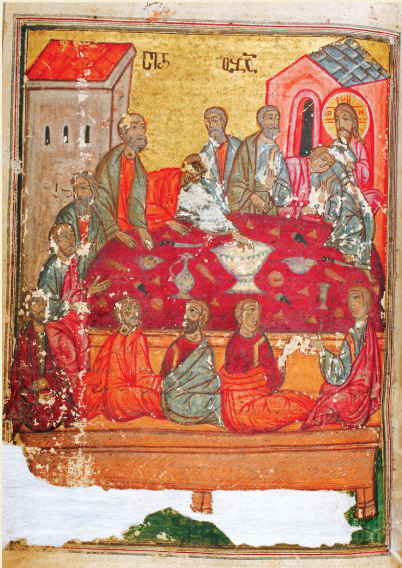
ლიტურგიკული კრებული. XVII ს. | Liturgical Book. 17 th c. A-125, 89v