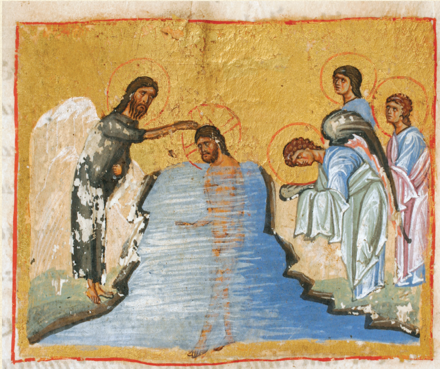
გელათის ოთხთავი. XII ს. | Gelati Gospels. 12 th c. Q-908, 25v