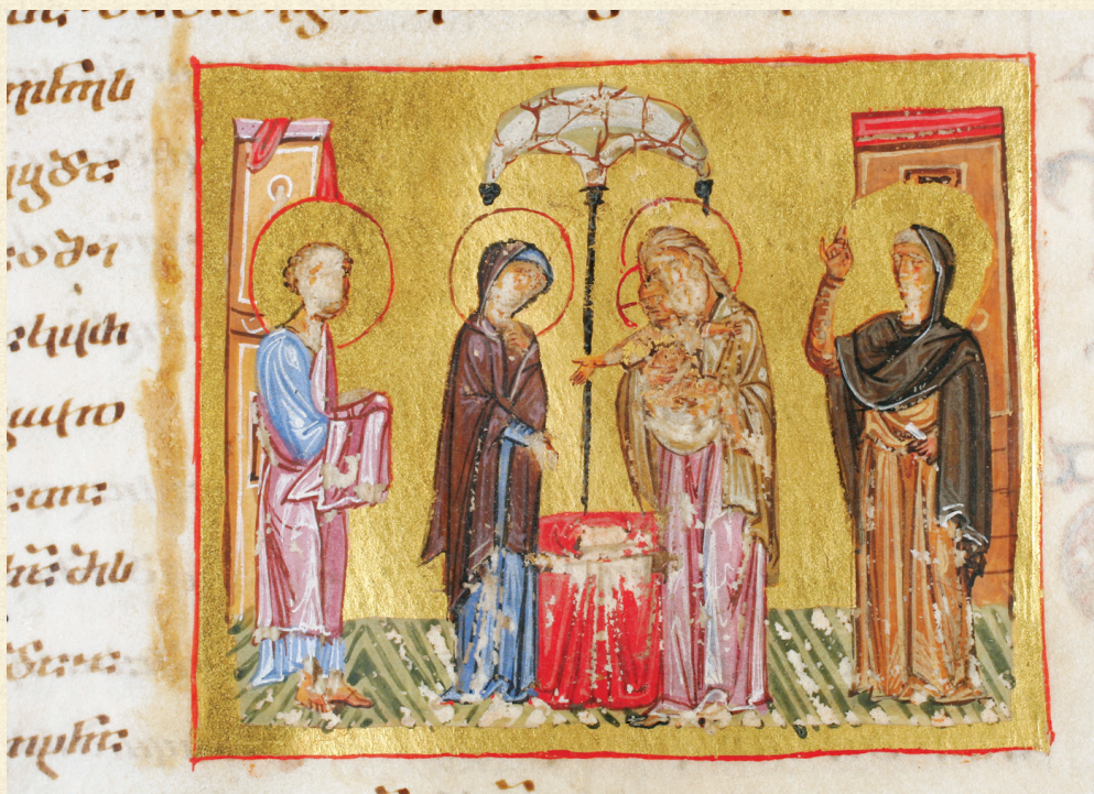
გელათის ოთხთავი. XII ს. | Gelati Gospels. 12 th c. Q-908, 151v

Presentation of Jesus at the Temple is one of the twelve Great Feasts. The essence of this scene, described in the Gospel of Luke (Luke 2: 21-39) is tied with the Judaism and Jewish traditions. One of the earliest images of the Presentation of Jesus at the Temple in Georgian miniature painting appears in the Gelati Gospels (Q-908). The literary parallels of this theme can be found in homiletic and hymnography collections.