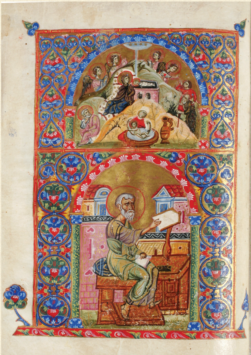
ვანის ოთხთავი. XII-XII სს. | Vani Gospels. 12-13 th c. A-1335, 9v