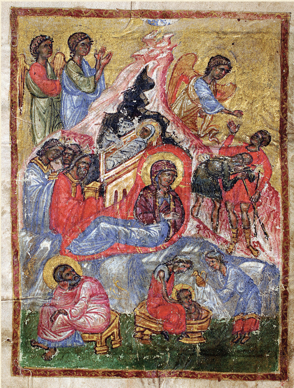
თბთავი. 1502 | Gospels. 1502 K-375, 11r