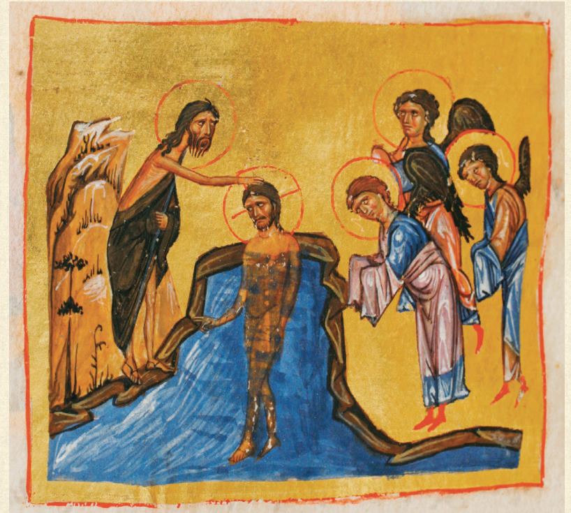
გელათის ოთხთავი. XII ს. | Gelati Gospels. 12 th c. Q-908, 93v