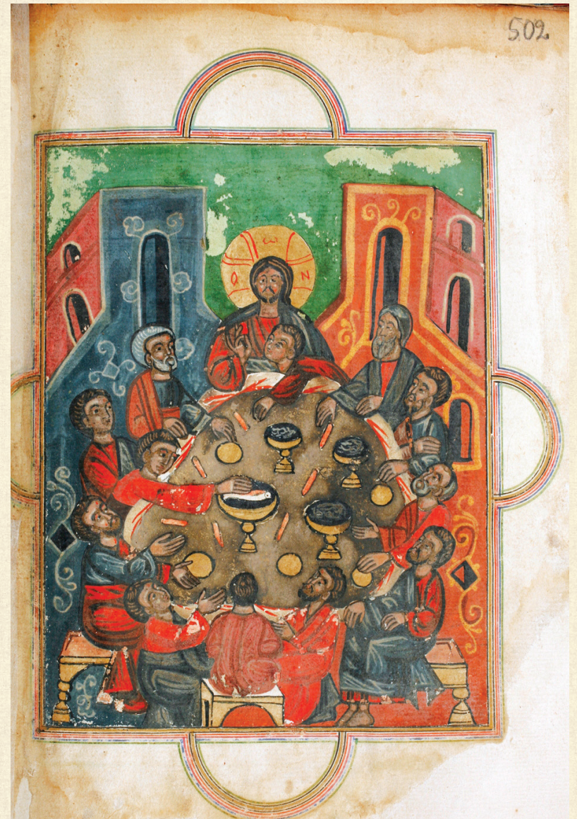
ყანაეთის ჯამნ-გულანი. 1674 | Zhamn-Gulani of Kanchaeti. 1674. H-1452, 502r