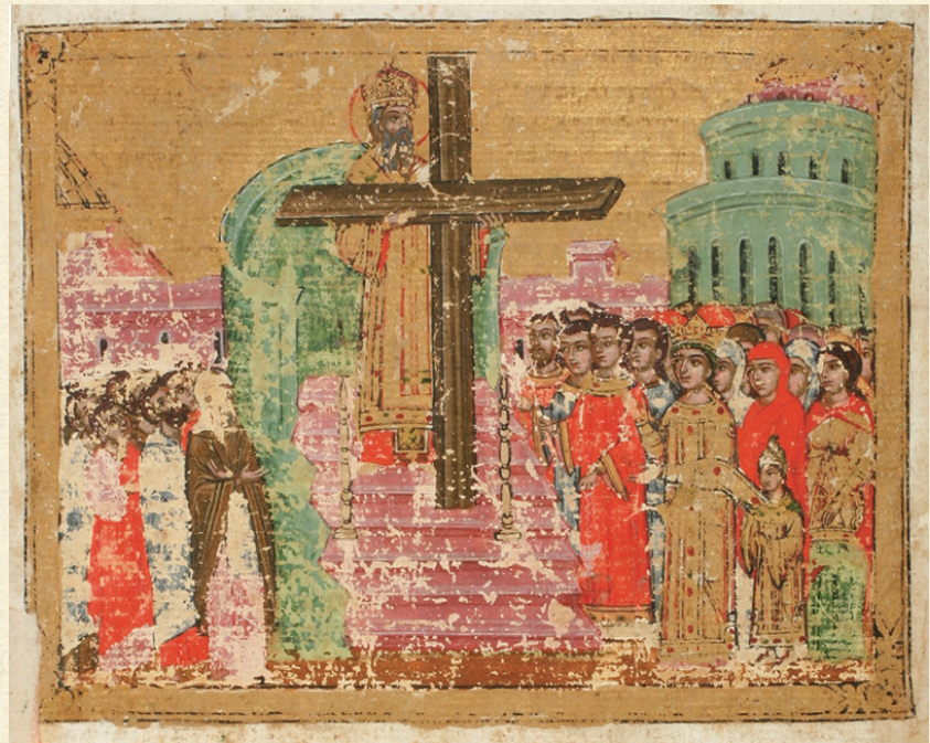
ანჩისხატის გულანი. 1681 | Gulani of Anchiskhati. 1681 A-30, 30r