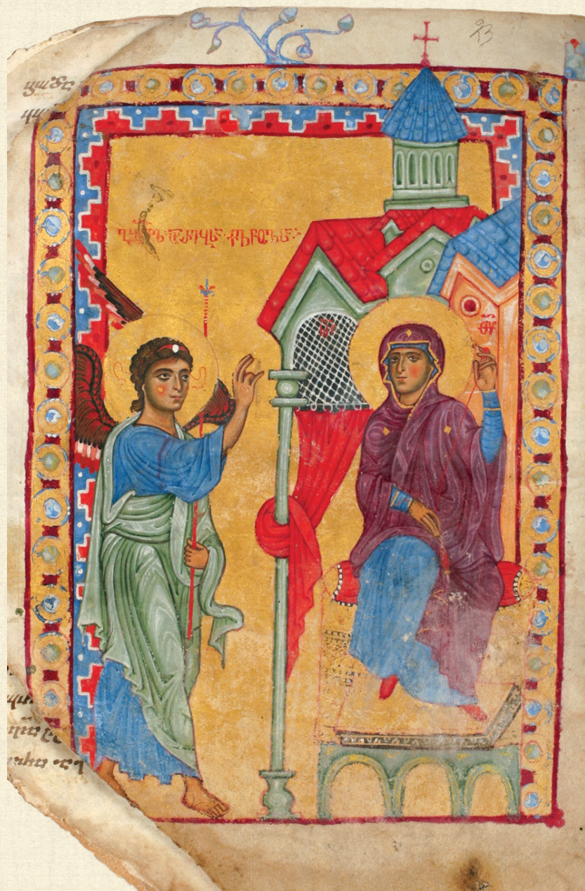
ლარგვისის ოთხთავი. XIII ს. | Largvisi Gospels. 13 th c.