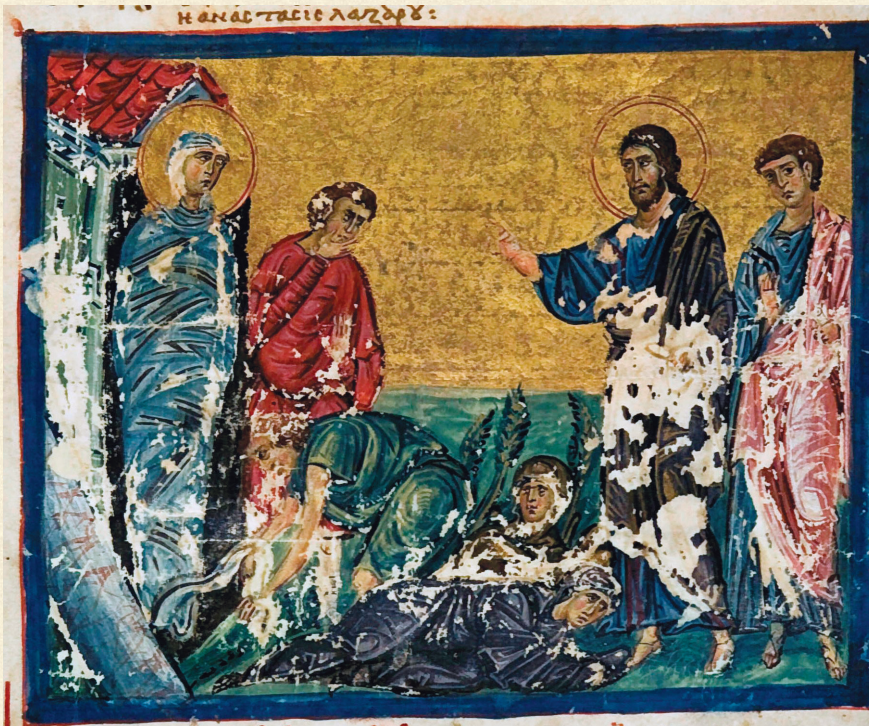
მცირე სვინაქსარი. 1030 | Small Synaxarion. 1030 A-648, 34r

The story of the Raising of Lazarus is narrated only in the Gospel of John (11:1-45). The literary development of the Gospel text belongs to Epiphanius of Cyprus. His work inspired medieval painters. We can also consider the homily by anonymous author, inserted in the Sinai Polikefalion as its literary source. For centuries, the iconographic scheme of this theme did not change. In Georgian manuscripts the Raising of Lazarus is given in laconic version; the first time it is inserted in the illustrations of the Small Synaxarion.