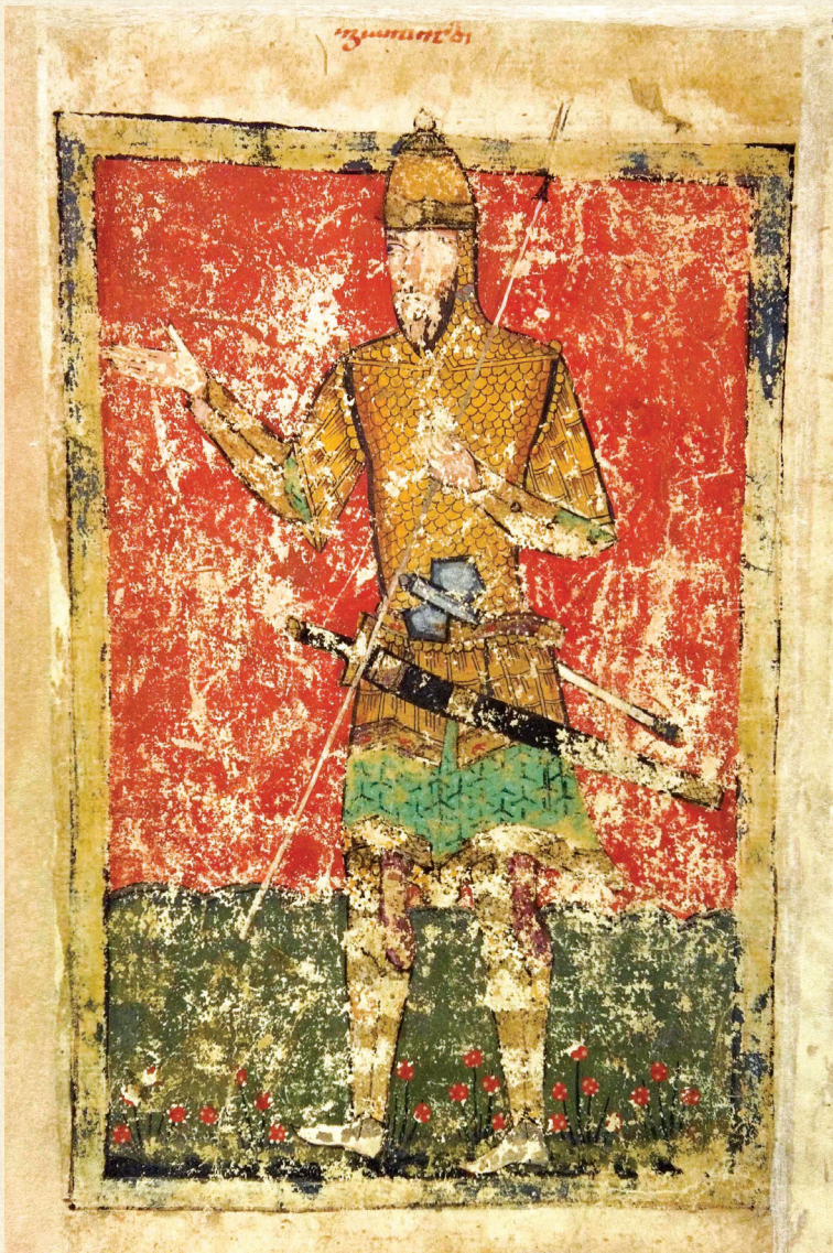
ფსალმუნი. XV ს. | Psalter. 15 th c. გოლიათი | Goliath H-1665, 230r