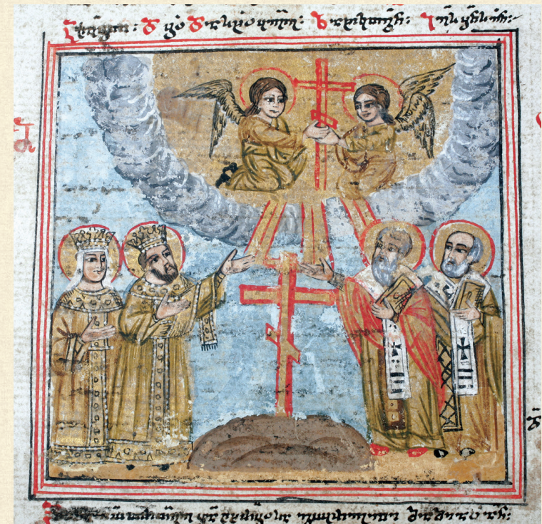
შემოქმედის გულანი. XVIII ს. | Gulani of Shemokmedi. 18 th c. Q-103 b , 327v