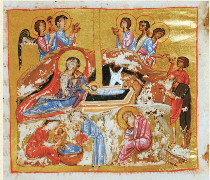
გელათის ოთხთავი. XII ს. | Gelati Gospels. 12 th c. Q-908, 150r