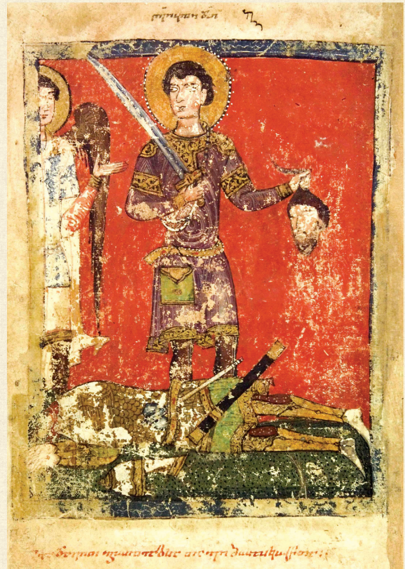
ფსალმუნი. XV ს. | Psalter. 15 th c. დავითი გოლიათის თავით | David with the Head of Goliath H-1665, 230v