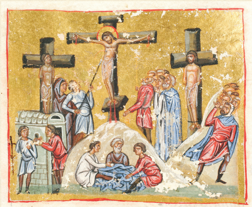
გელათის ოთხთავი. XII ს. | Gelati Gospels. 12 th c. Q-908, 215v