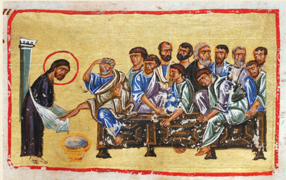
გელათის ოთხთავი. XII ს. | Gelati Gospels. 12 th c. ფერხთაბანა | Christ washing the Disciples Feet Q-908, 259v