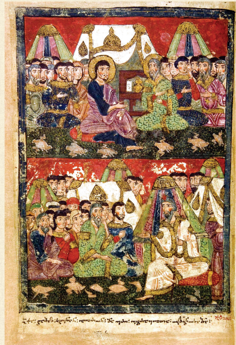
ფსალმუნი. XV ს. | Psalter. 15 th c. მოსე და აარონი. ებრაელთა დაპურება უდაბნოში | Moses and Aaron. Israelites in the Dessert H-1665, 210v