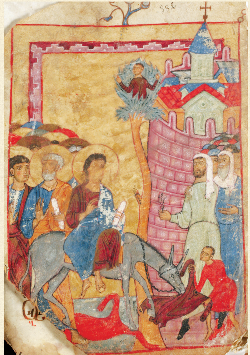
ღარგვისის ოთხთავი. XIII ს. | Largvisi Gospels. 13 th c. A-26, 382v