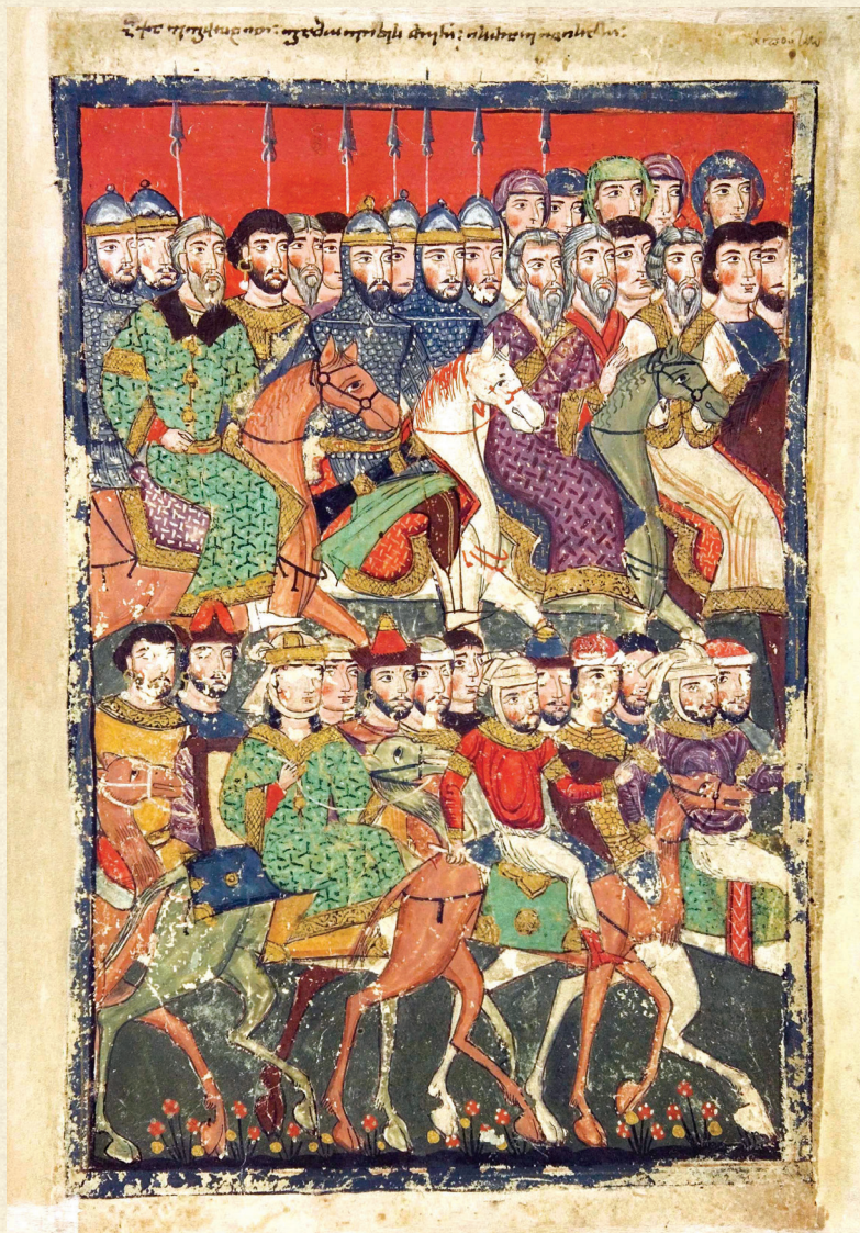
ფსალმუნი. XV ს. | Psalter. 15 th c. ებრაელთა გამოსვლა ეგვიპტიდან | Exodus of the Israelites out of Egypt H-1665, 209r