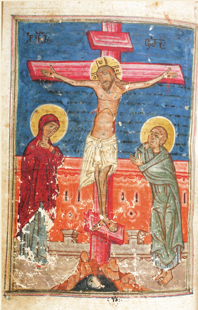
ლიტურგიკული კრებული. XVII ს. | Liturgical Book. 17 th c. A-125, 134v