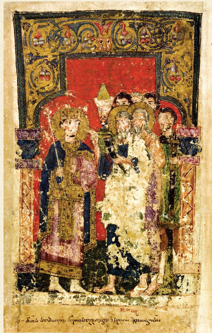
ფსალმუნი. XV ს. | Psalter. 15 th c. შინასწარმეტყველი სამოელი ზეთს სცხებს დავითს | Samuel anoints David H-1665, 179v