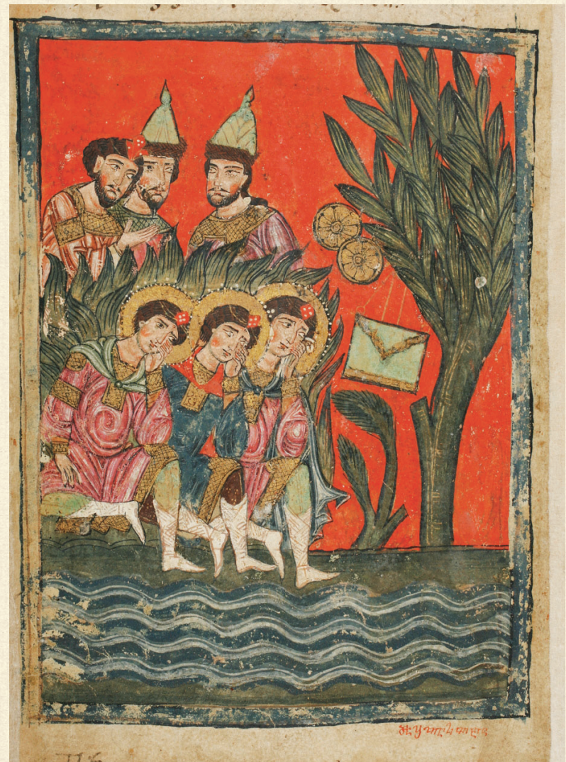
ფსალმუნნი. XV ს. | Psalter. 15 th c. ანანია, აზარია, მისაელი | Hananiah, Azariah, Mishael H-1665, 200v