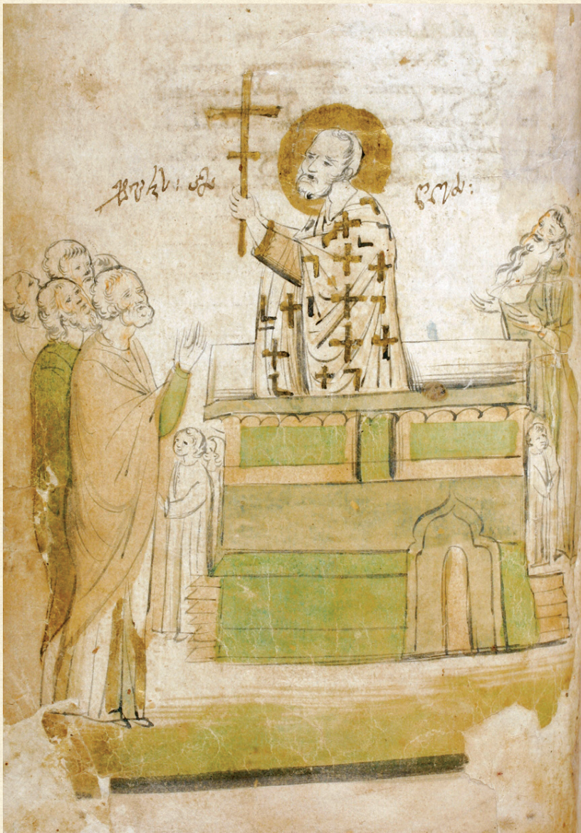
ლიტურგიკული კრებული. XVI ს. | Liturgical Book. 16 th c. A-733, 143v