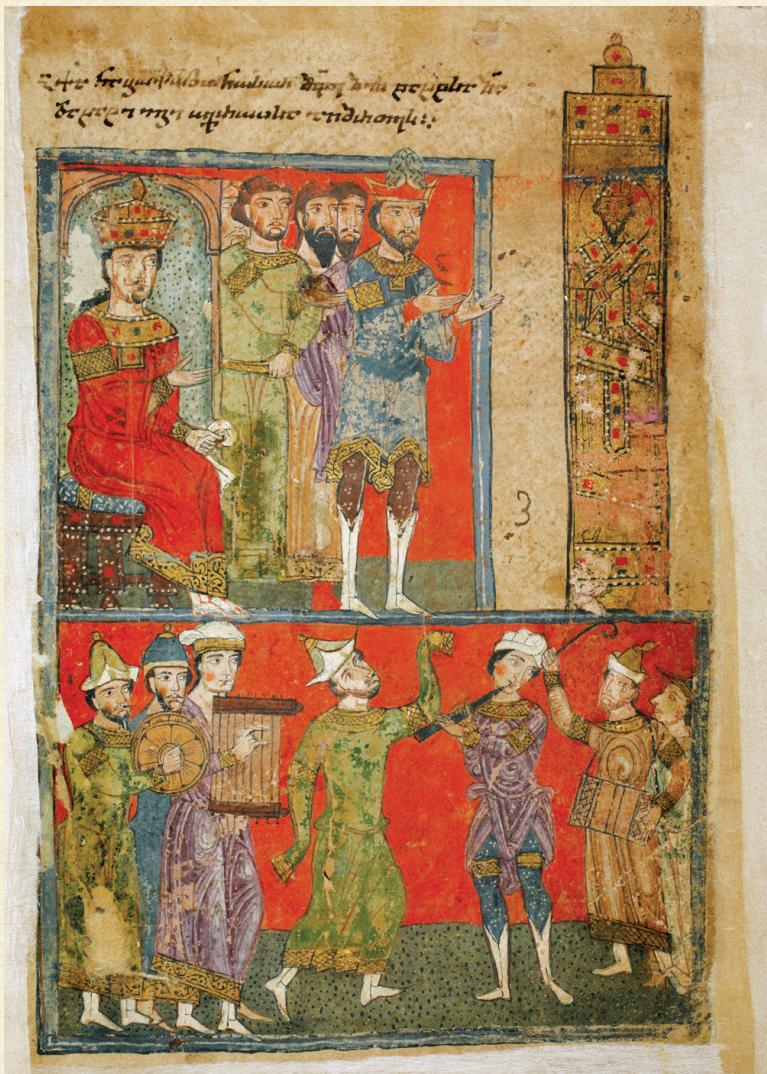
ფსალმუნნი. XV ს. | Psalter. 15 th c. ნაბუქოდონოსორ მეფე | King Nabuchadnezzar H-1665, 235r