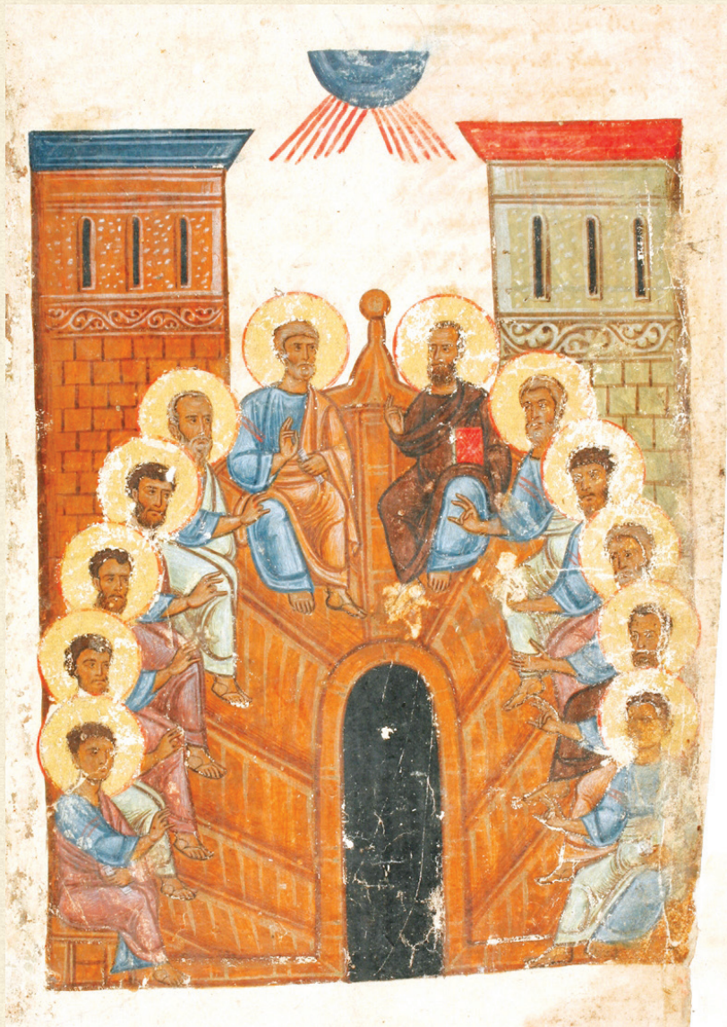
გრიგოლ ღვთისმეტყველის თხზულებათა კრებული. XIII ს. | Homilies of Gregory of Nazianzus. 13 th c. A-109, 210r