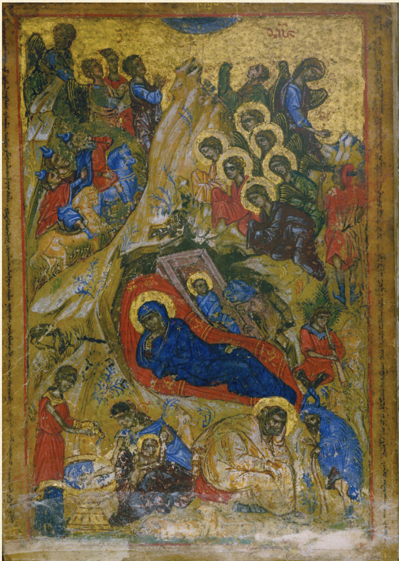
ბერძნულ-ქართული ლიტურგიკული კრებული. XV ს. | Greek-Georgian Liturgical Book. 15 th c.