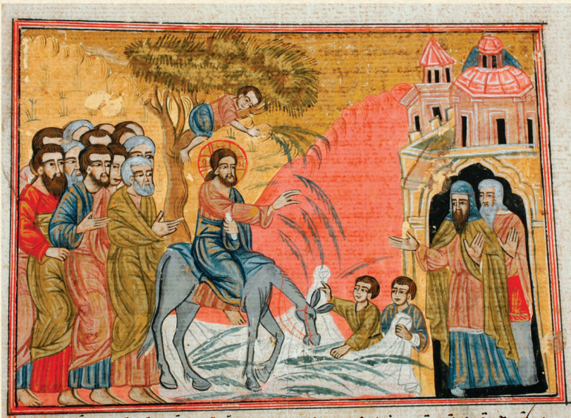
შემოქმედის გულანი. 1749 | Gulani of Shemokmedi. 1749 Q-103 o , 538r