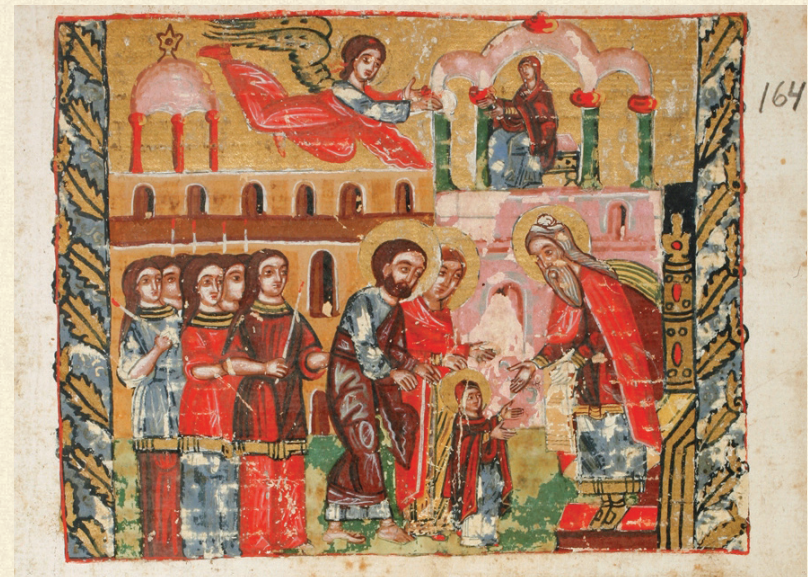
შემოქმედის გულანი. 1749 | Gulani of Shemokmedi. 1749 ღვთისმშობლის ტაძრად მიყვანა | The Entrance of the Theotokos into the Temple Q-103 o , 181r