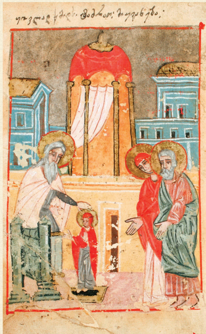
ღვთისმშობლის მიძინების სვინაქსარი. 1826 | Synaxarion of the Dormition of the Theotokos. 1826 ღვთისმშობლის ტაძრად მიყვანა | The Entrance of the Theotokos into the Temple A-1556, 2v