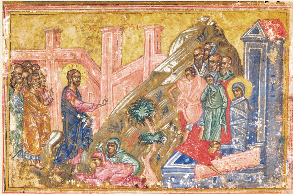
ლიტურგიკული კრებული. XV ს. | Liturgical Book. 15 th c. K-115, 156 r