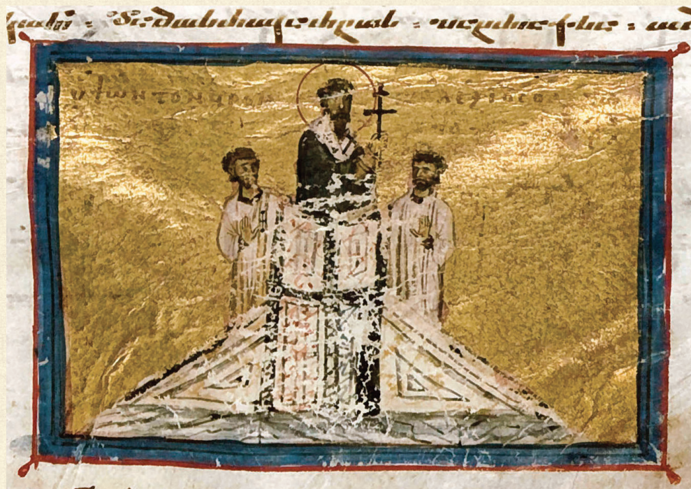
მცირე სვინაქსარი. 1030 | Minor Synaxarion. 1030

The Exaltation of the Precious and life-creating Cross is one of the twelve Great feasts. It is related to the cross discovery by Saint Helen in 326. This feast appears in the homiletic and hymnography collections (texts by Andrew of Crete, John Chrysostom, etc.). The first time the miniature appears in the Minor Synaxarion (A-648).