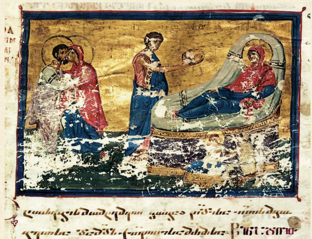
მცირე სვინაქსარი. 1030 | Minor Synaxarion. 1030 ღვთისმშობლის შობა | Nativity of the Theothokos A-648, 4r

The themes of the Birth, the Presentation and the Dormition of the Virgin Mary appear in apocrypha, hymnography and homiletic texts. It is considered that the first sources of these feasts are the apocryphal writings. The iconography of the Virgin Mary's Birth is formed on the basis of the Protoevangelion of Jacob and the apocrypha of the Virgin Mary's life. Along with the four Gospels, the miniatures paintings of single themes from the Virgin Mary's cycle are found mostly in the liturgical collections.