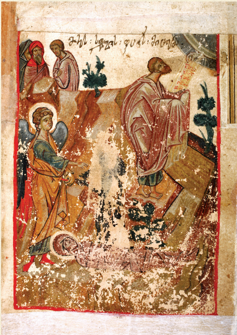
ლიტურგიკული კრებული. XV ს. | Liturgical Book. 15 th c. მოსესათვის კანონთა გადაცემა | Moses Receiving the Ten Commandments A-733, 104r