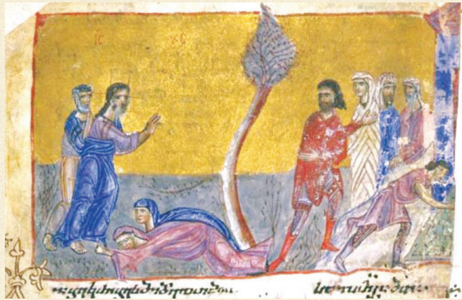
ჯრუჭის ოთხთავი. XII-XIII სს. | Jruchi Gospels. 12-13 th c. H-1667, 230v