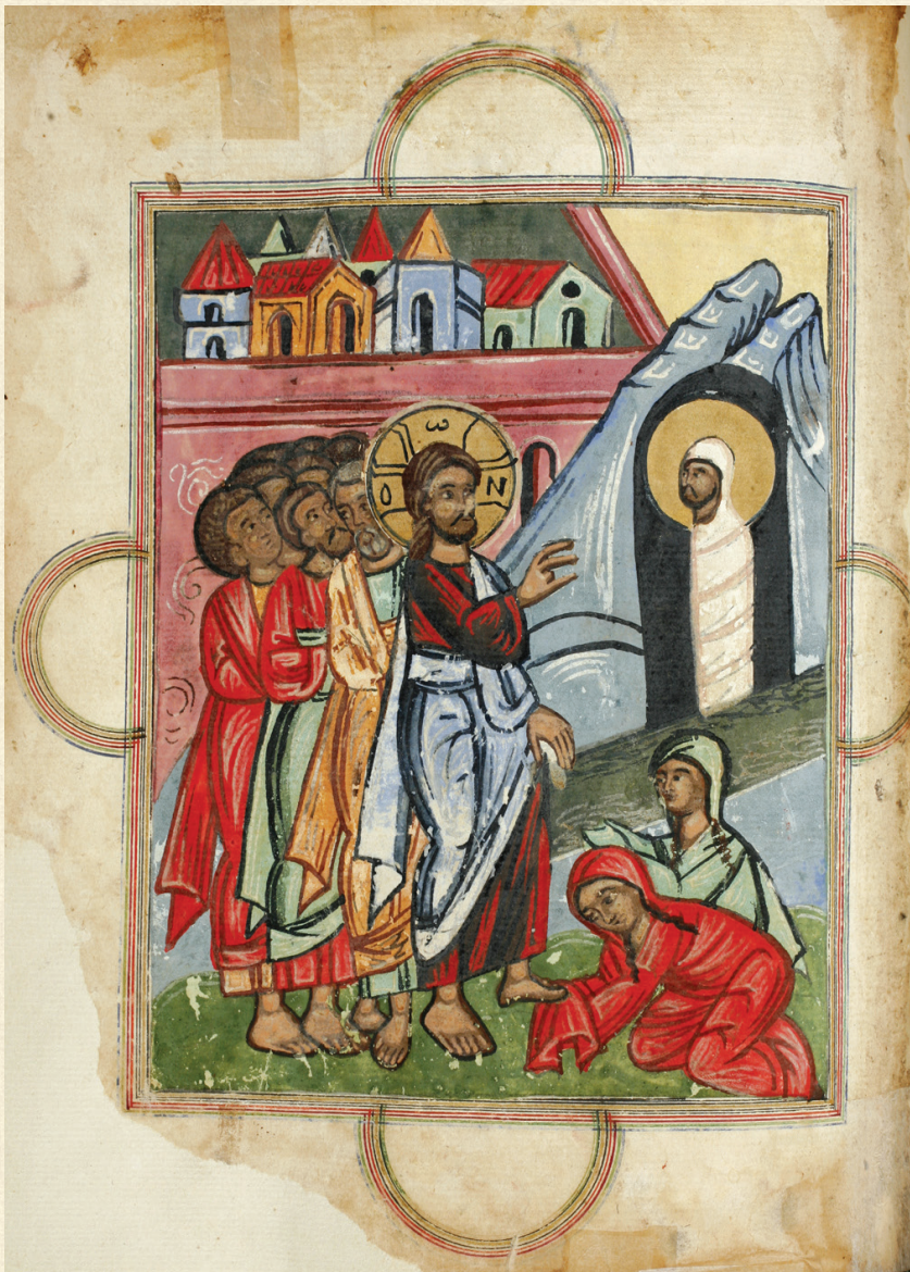
ყანხათის ჟამნ-გულანი. 1674 | Zhamn-Gulani of Kanchaeti. 1674 H-1452, 500v