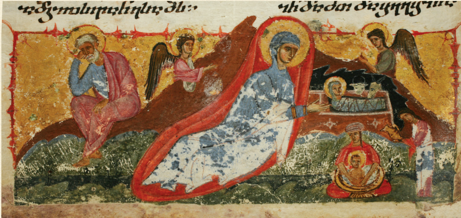
ჯრუჭის ოთხთბევი. XII-XIII სს. | Jruchi Gospels. 12-13 th c. H-1667, 129v