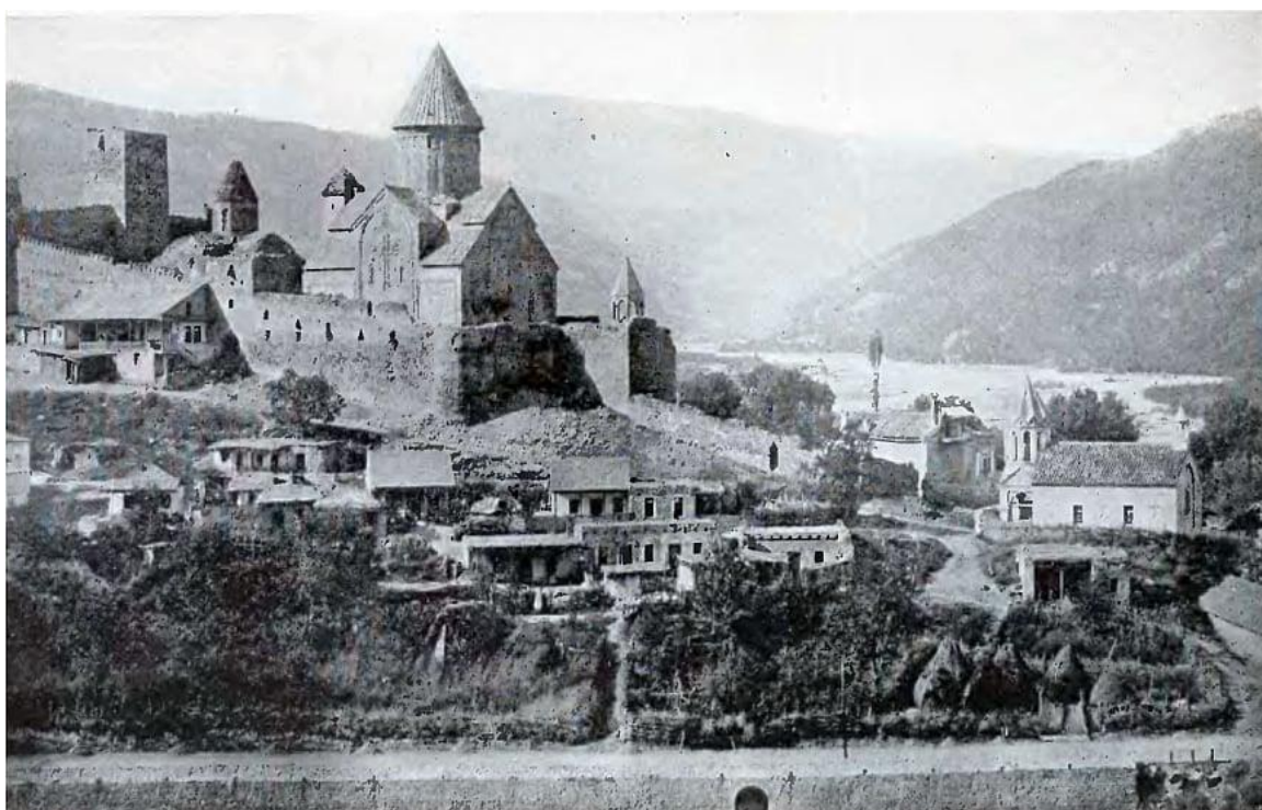
ანანურის ციხესიმაგრე XVIII ს.

ეს ციხესიმაგრე მდებარეობს დუშეთიდან 23 კმ-ში მდინარე არაგვის მარჯვენა ნაპირზე. ანანური არაგვის ერისთავების რეზიდენცია ყოფილა იგი ისტორიულ წყა-