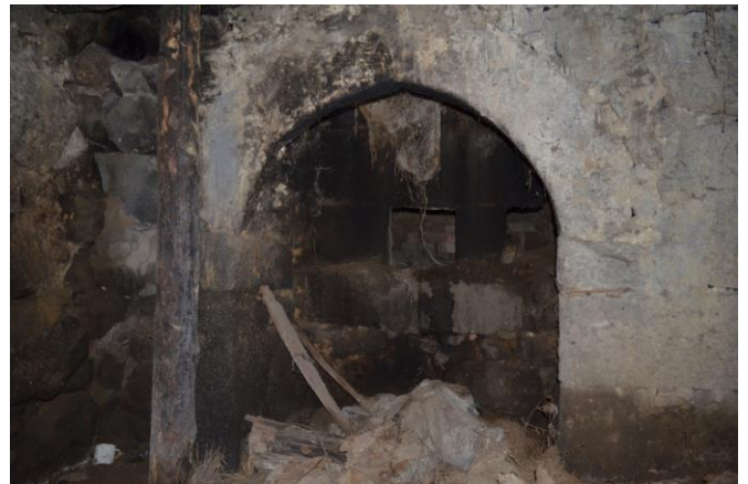
სურ. 2.51 პავლე კელოშვილის დარბაზოვანი ნაგებობა. ფურნე. 2019 წ.