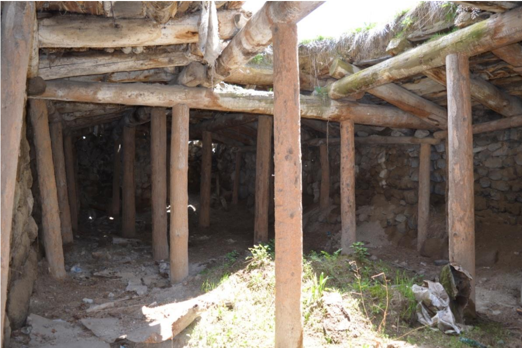
სურ. 2.14 ნოდარ ხაზალაშვილის საბძელი. 2019 წ.