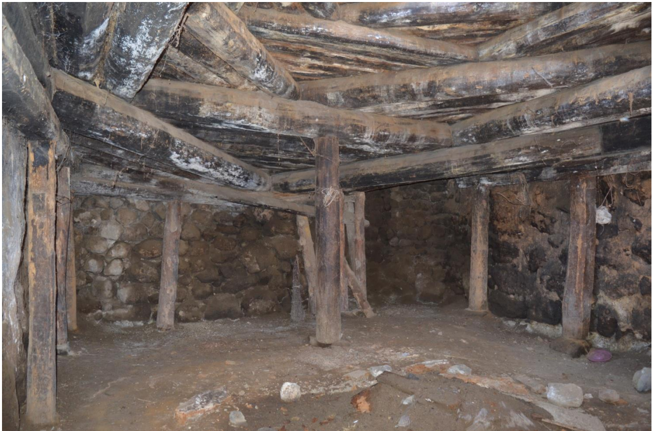
სურ. 2.53 პავლე კელოშვილის დარბაზოვანი ნაგებობა. ერდო-გვირგვინიანი დარბაზი. 2019 წ.

კელოშვილის დარბაზოვანი ნაგებობა. ძველ ნაგებობაში შესასვლელი დერეფანი. 2019 წ.