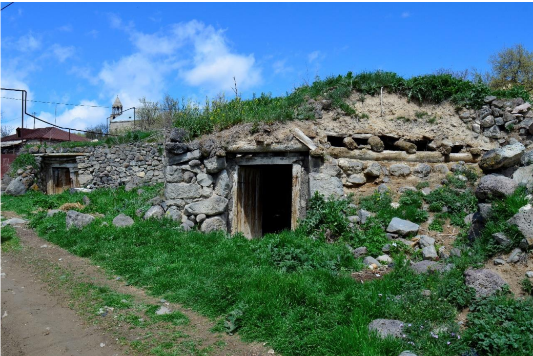
სურ. 2.7 ფანჩო ველიჯანაშვილის დარბაზოვანი ნაგებობა. 2019 წ.