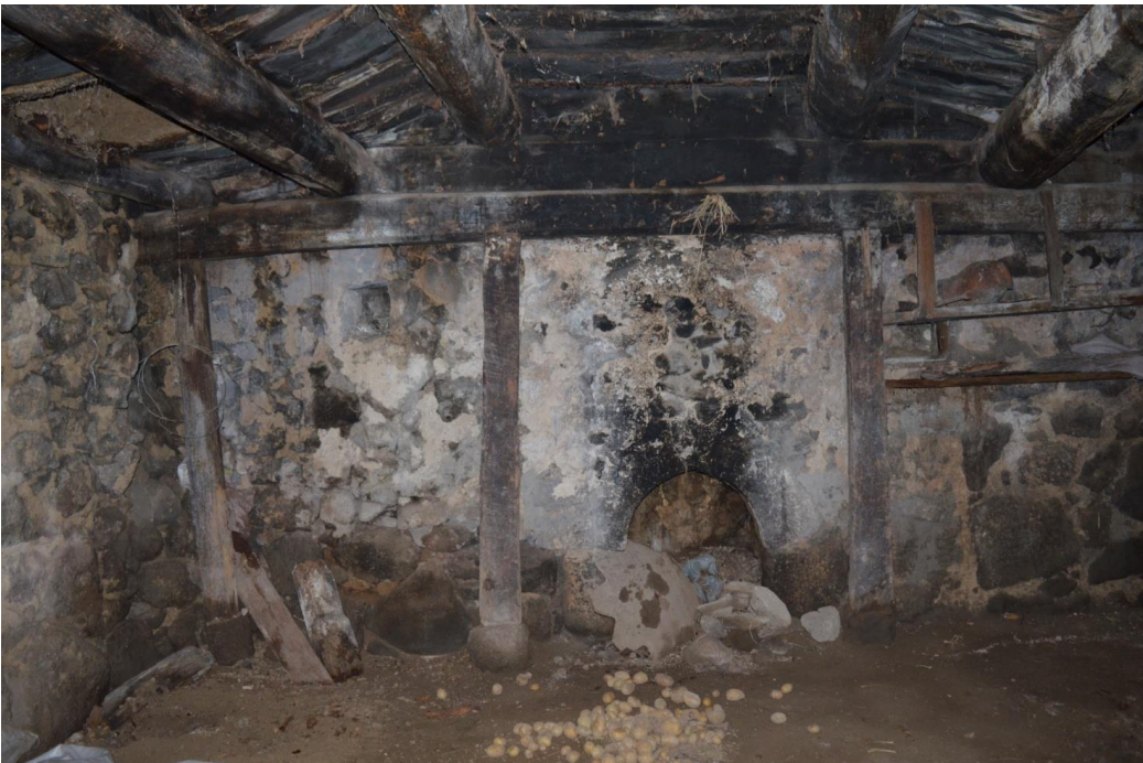
სურ. 2.63 გოდერძი მაზმიშვილის დარბაზოვანი ნაგებობა. თაკარებიანი ოდა. 2019 წ.