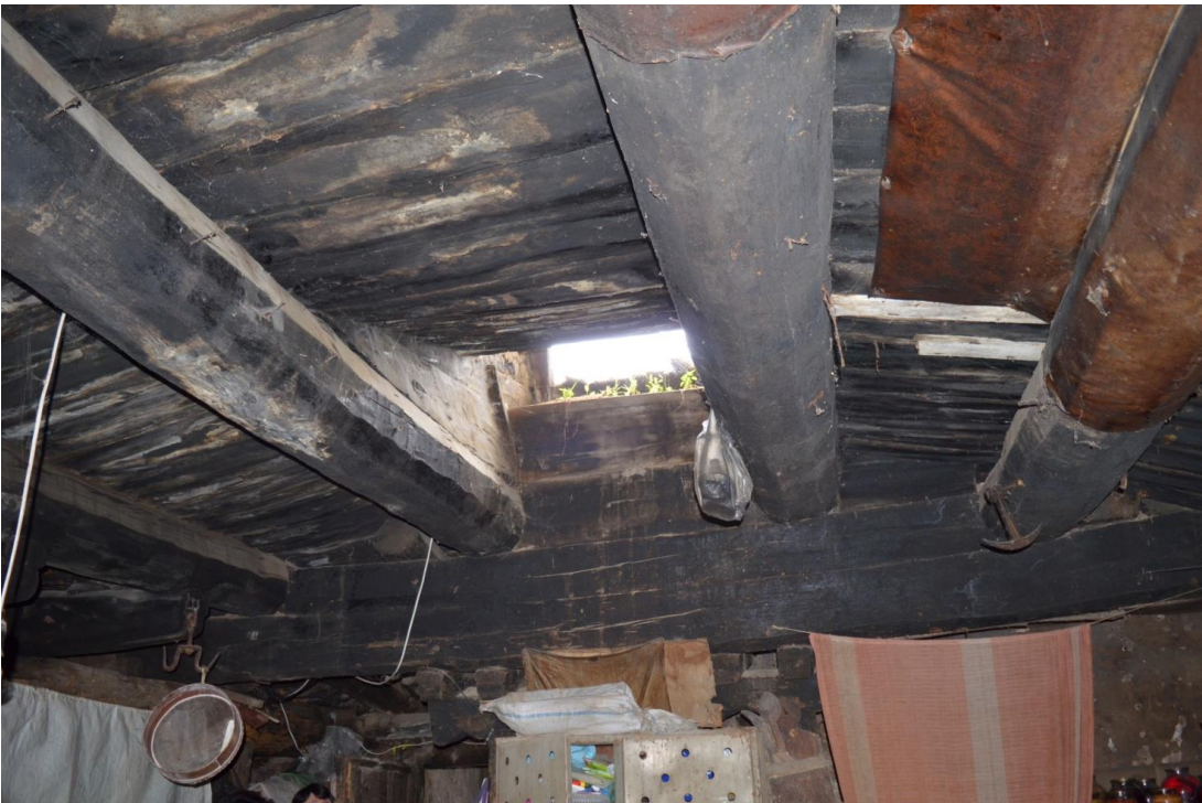
სურ. 2.34 ლუბა კელოშვილის დარბაზოვანი ნაგებობა. მარანი. 2019 წ.