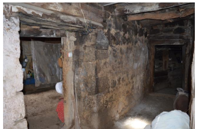
სურ. 2.31 ლუბა კელოშვილის დარბაზოვანი ნაგებობა. მცირე დერეფანი. 2019 წ.