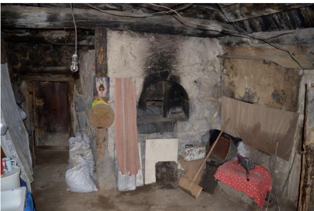
სურ. 2.30 ლუბა კელოშვილის დარბაზოვანი ნაგებობა. დერეფანი - ფურნის სათავსო. 2019 წ.