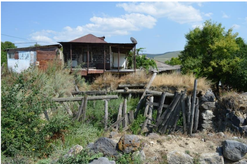
სურ. 2.1 გია ხუციშვილის საცხოვრებელი. ჩანგრეული საბძელი. 2016 წ.