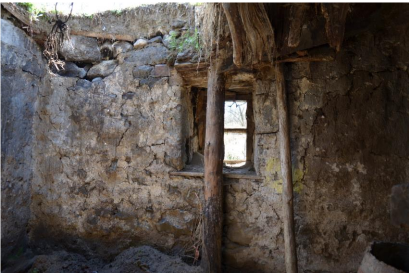
სურ. 2.42 ლუბა კელოშვილის დარბაზოვანი ნაგებობა. ე.წ. „იაზლული“. 2019 წ.