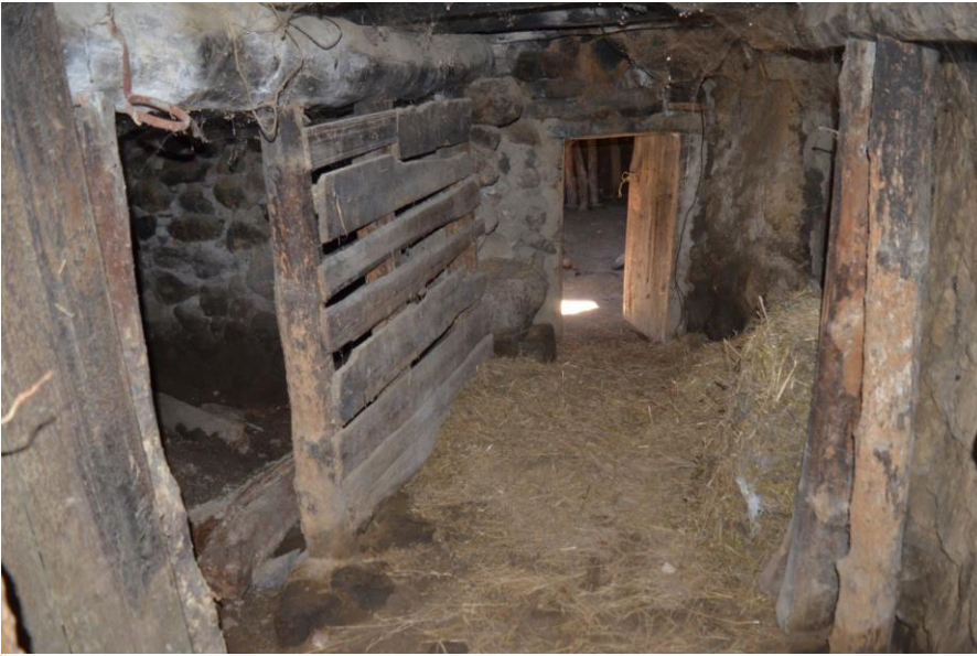
სურ. 2.52 პავლე

კელოშვილის დარბაზოვანი ნაგებობა. ძველ ნაგებობაში შესასვლელი დერეფანი. 2019 წ.