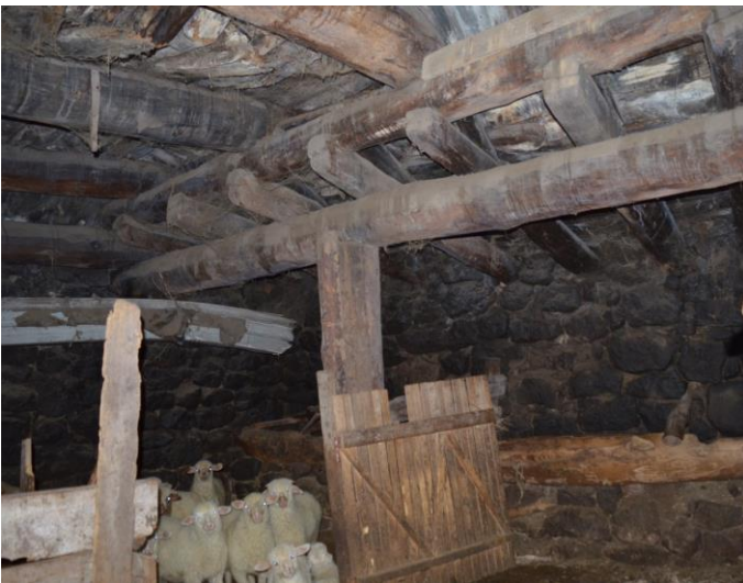
სურ. 2.40 ლუბა

კელოშვილის დარბაზოვანი ნაგებობა. ახორი. 2019 წ.