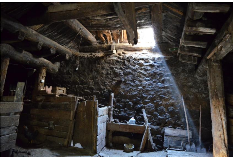
სურ. 2.37 ლუბა კელოშვილის დარბაზოვანი ნაგებობა. ახორი. 2019 წ.