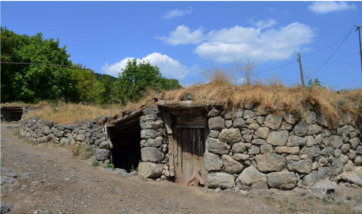
სურ. 2.22 ლუბა კელოშვილის დარბაზოვანი ნაგებობა. 2016 წ.