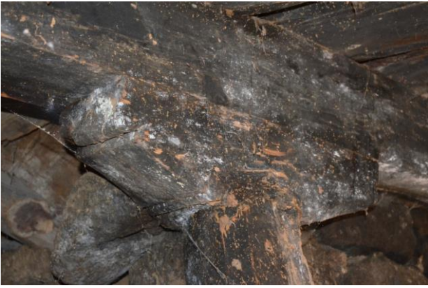
სურ. 2.28 ლუბა კელოშვილის დარბაზი. კედლისპირა საყრდენის ბალიში. 2019 წ.