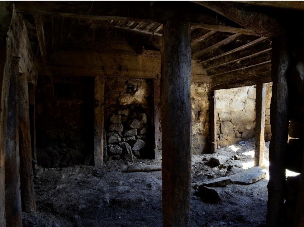
სურ. 2.8 ფანჩო ველიჯანაშვილის დარბაზოვანი ნაგებობა. თაკარებიანი ოდა. 2019 წ.