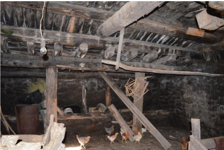
სურ. 2.36 ლუბა კელოშვილის დარბაზოვანი ნაგებობა. ახორი. 2019 წ.