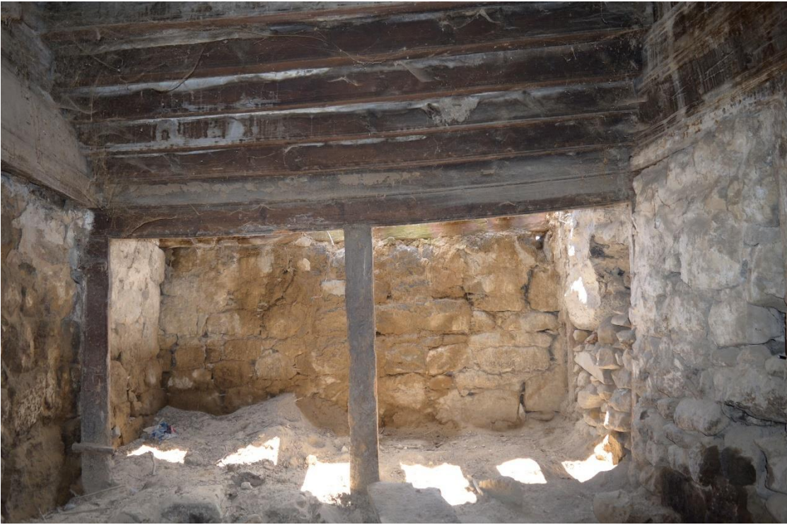
სურ. 2.10 ფანჩო ველიჯანაშვილის დარბაზოვანი ნაგებობა. თაკარებიანი ოდა. 2019 წ.