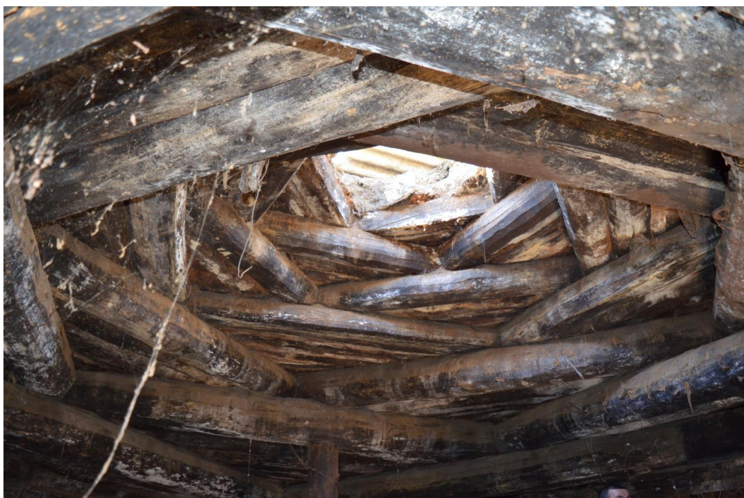
სურ. 2.55 პავლე კელოშვილის დარბაზოვანი ნაგებობა. გვიგვინი. 2019 წ.