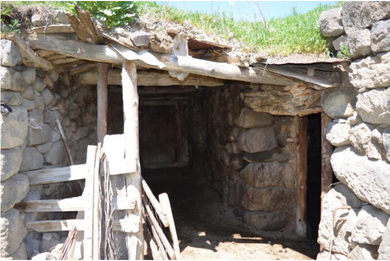
სურ. 2.66 გოდერძი მაზმიშვილის დარბაზოვანი ნაგებობა. მეორე თვალი კარაპანი. 2019 წ.