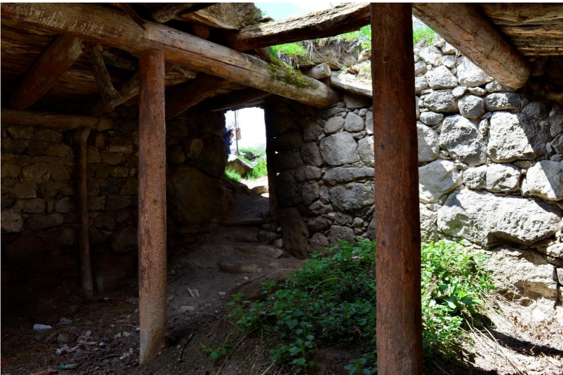
სურ. 2.13 ნოდარ ხაზალაშვილის საბძელი. 2019 წ.