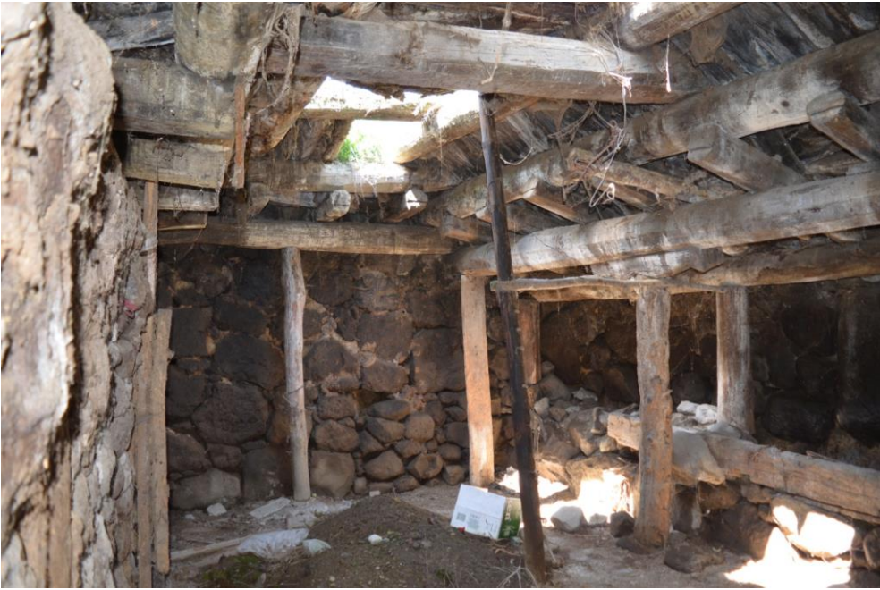
სურ. 2.58 პავლე

კელოშვილის დარბაზოვანი ნაგებობა. ახორი. 2019 წ.