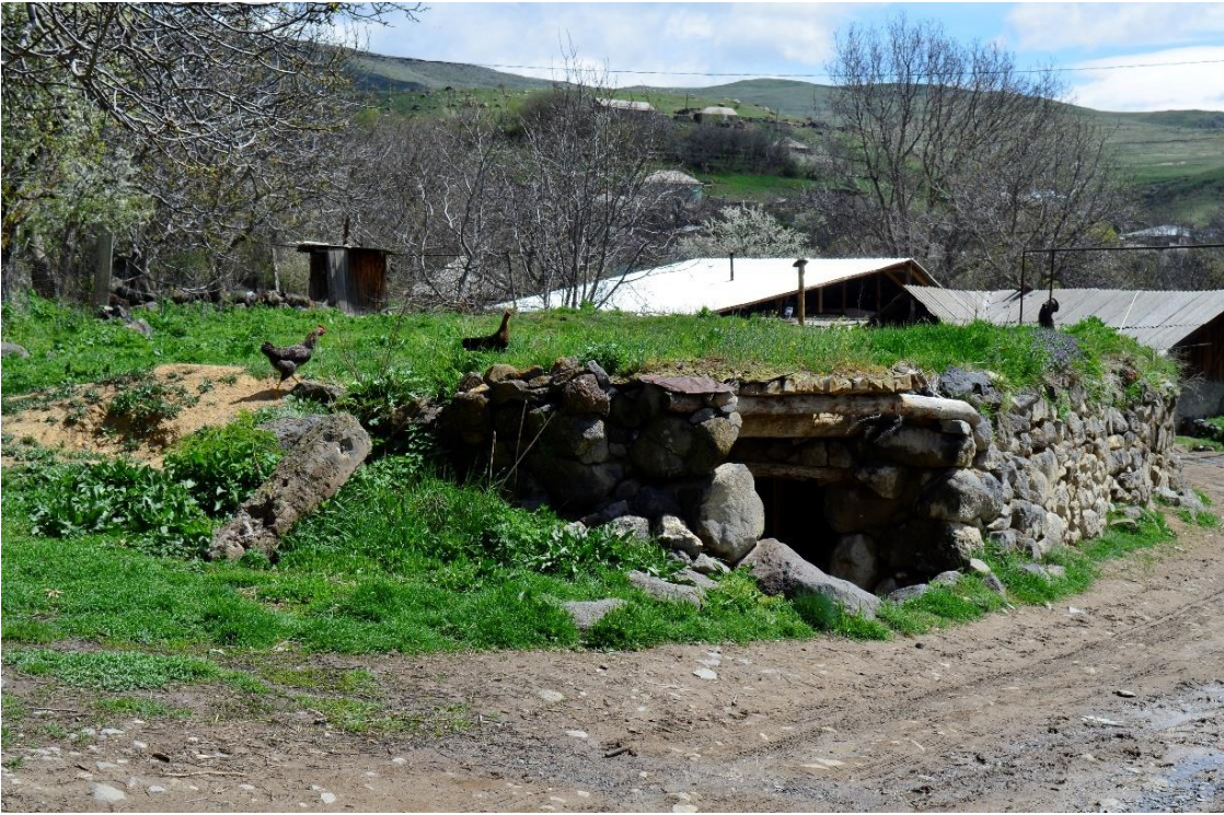
სურ. 2.12 ნოდარ ხაზალაშვილის საბძელი. 2019 წ.