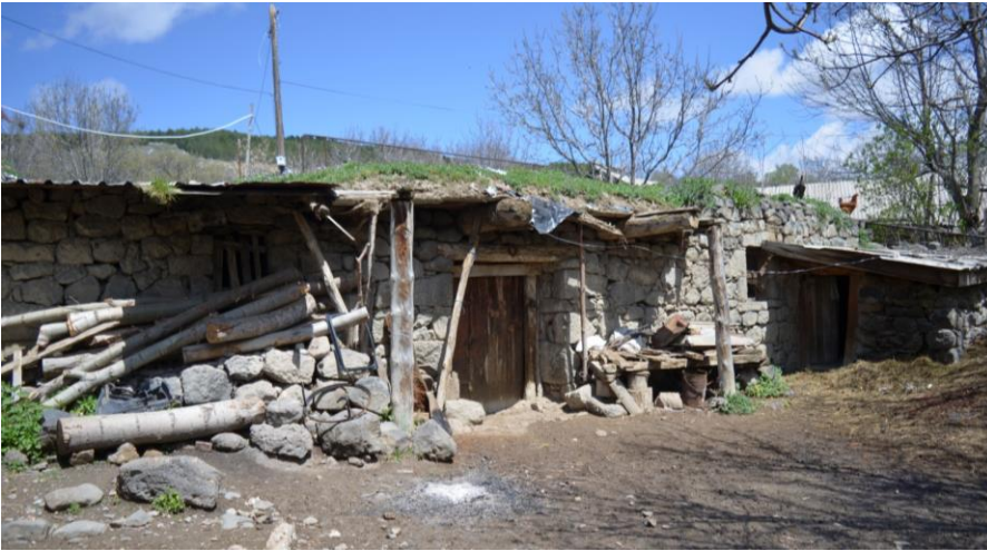
სურ. 2.38 ლუბა

კელოშვილის თანამედროვე საცხოვრებლის მარჯვენა მხარეს არსებული დარბაზოვანი ნაგებობა. 2019 წ.