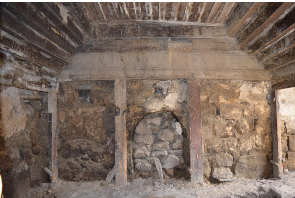
სურ. 2.9 ფანჩო ველიჯანაშვილის დარბაზოვანი ნაგებობა. თაკარებიანი ოდა. 2019 წ.