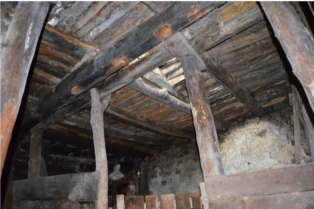
სურ. 2.20 ზურაბ კელოშვილის დარბაზოვანი ნაგებობა. თაკარებიანი ოდა. 2016 წ.