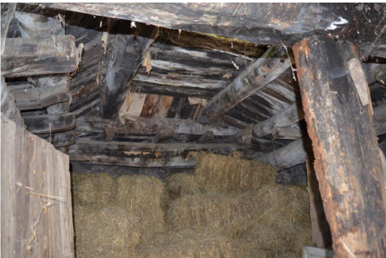
სურ. 2.67 გოდერძი მაზმიშვილის დარბაზოვანი ნაგებობა. ახორი. 2019 წ.