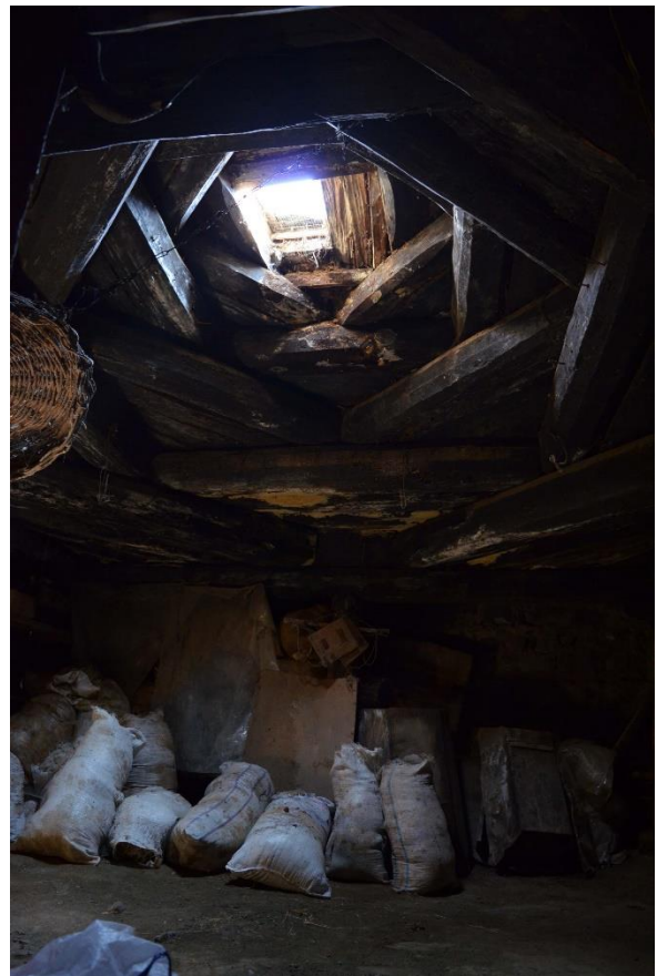
სურ. 2.17 ზურაბ კელოშვილის დარბაზოვანი ნაგებობა. დერეფანი. 2016 წ.