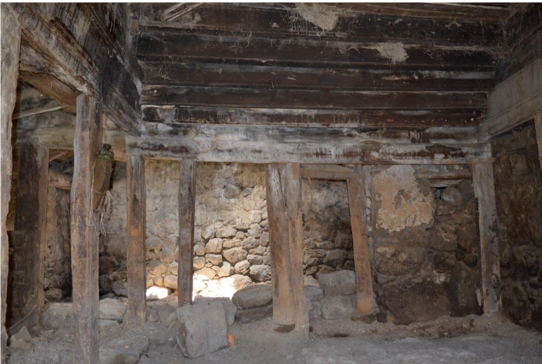
სურ. 2.11 ფანჩო ველიჯანაშვილის დარბაზოვანი ნაგებობა. თაკარებიანი ოდა. 2019 წ.