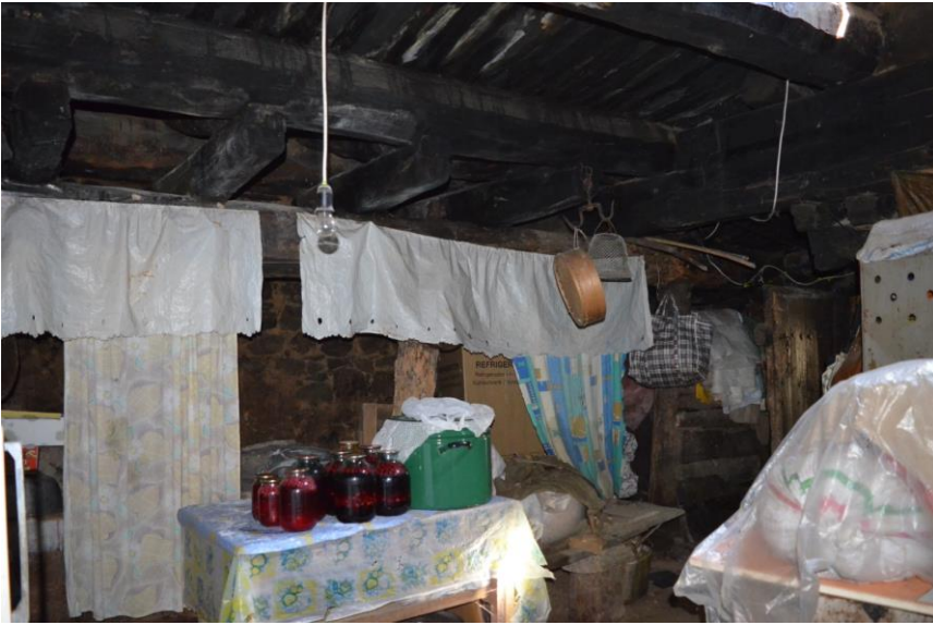
სურ. 2.35 ლუბა კელოშვილის დარბაზოვანი ნაგებობა. მარანი. 2019 წ.