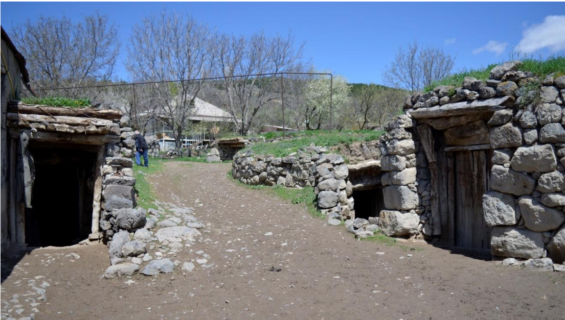
სურ. 2.15 ზურაბ კელოშვილისა და ლუბა კელოშვილის დარბაზოვანი კომპლექსები. 2019 წ.