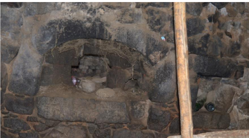
სურ. 2.68 გოდერძი მაზმიშვილის დარბაზოვანი ნაგებობა. ფურნე. 2019 წ.