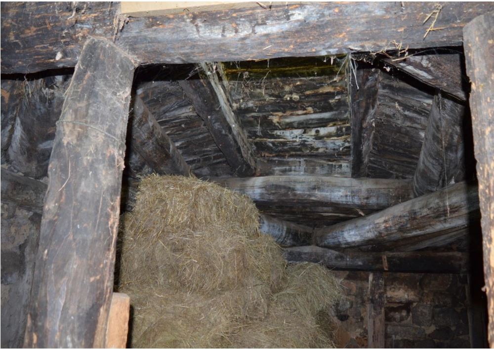
სურ. 2.61 გოდერძი მაზმიშვილის დარბაზოვანი ნაგებობა. სეგმენტის ცენტრულ-გვირგვინული და გრძივ-გვირგვინული გადახურვა. 2019 წ.