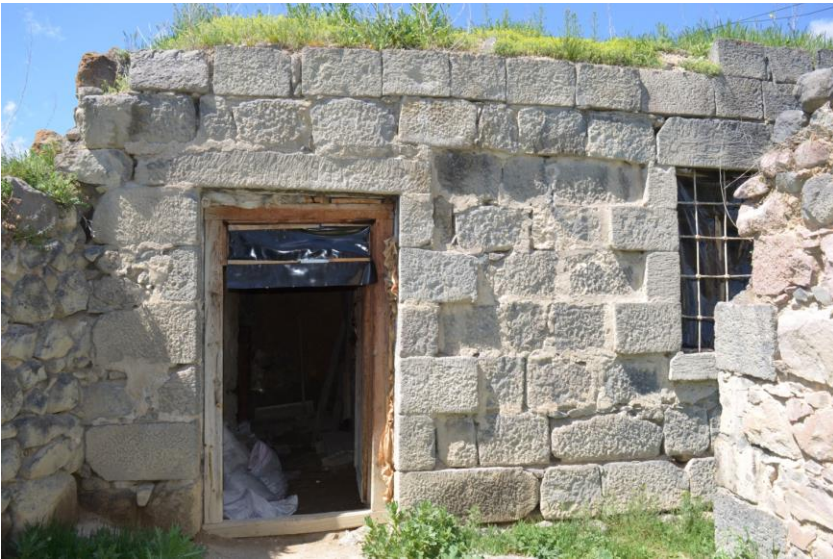
სურ. 2.49 პავლე კელოშვილის დარბაზოვანი ნაგებობა. 2019 წ.

კელოშვილის დარბაზოვანი ნაგებობა. 2019 წ.