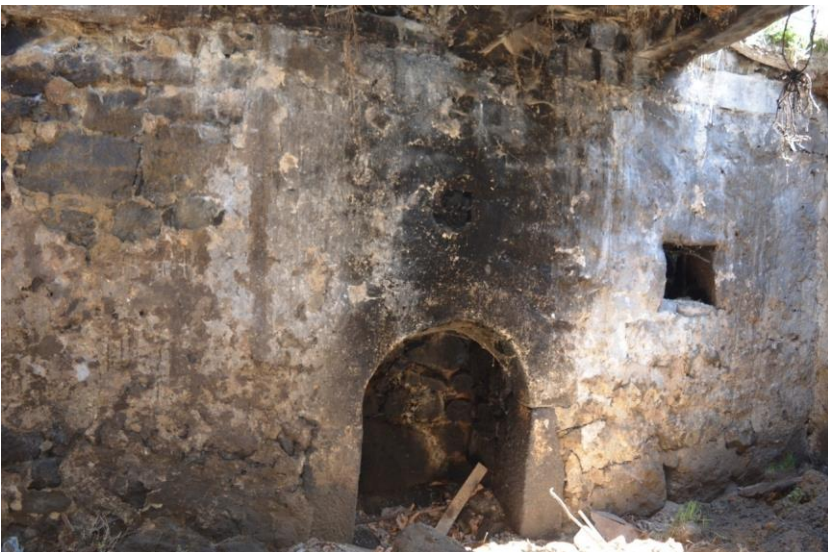
სურ. 2.43 ლუბა კელოშვილის დარბაზოვანი ნაგებობა. ე.წ. „იაზლული“. 2019 წ.