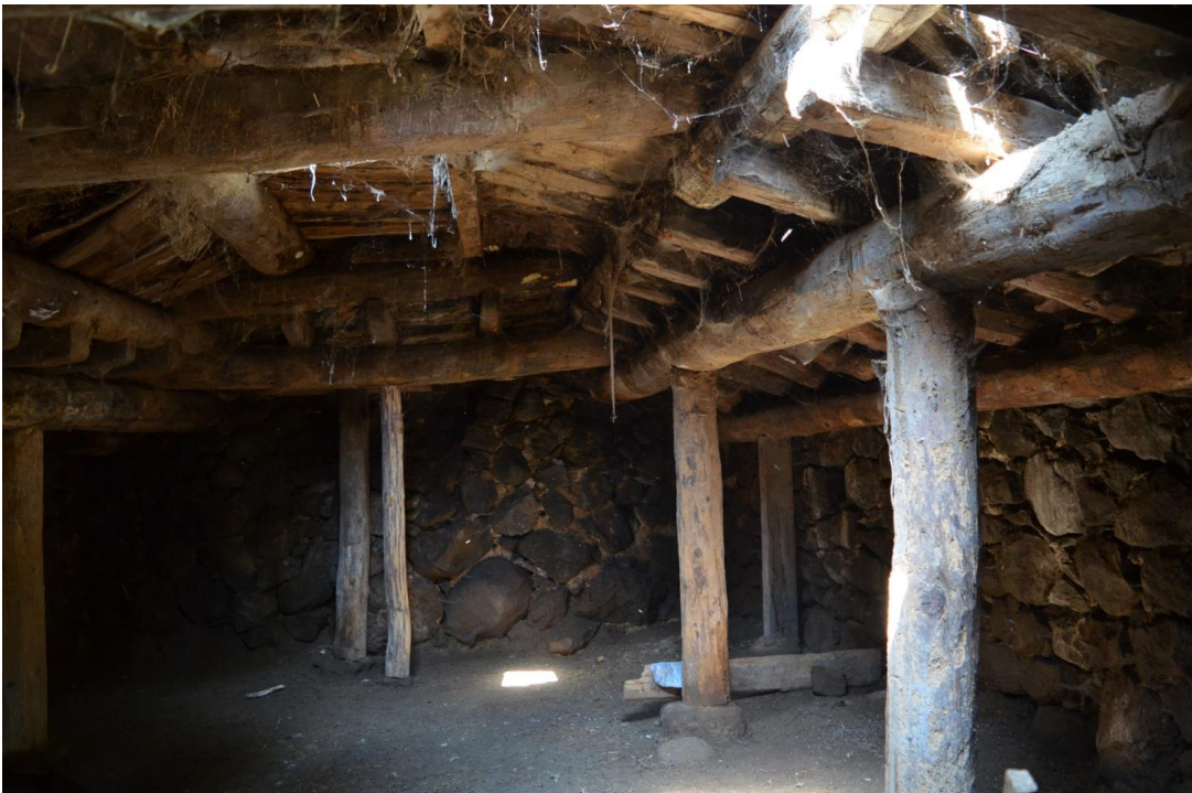
სურ. 2.47 ელდარ მურადაშვილის დარბაზოვანი კომპლექსი. ახორი. 2016 წ.