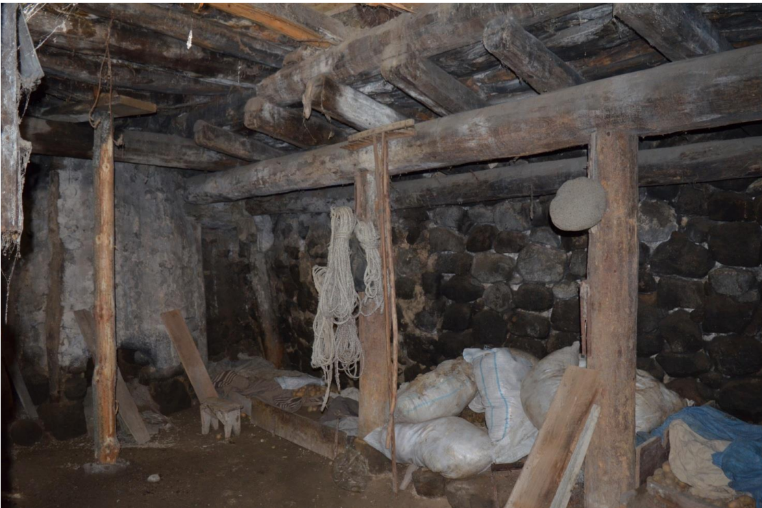
2.65 გოდერძი მაზმიშვილის დარბაზოვანი ნაგებობა. მარანი. 2019 წ.