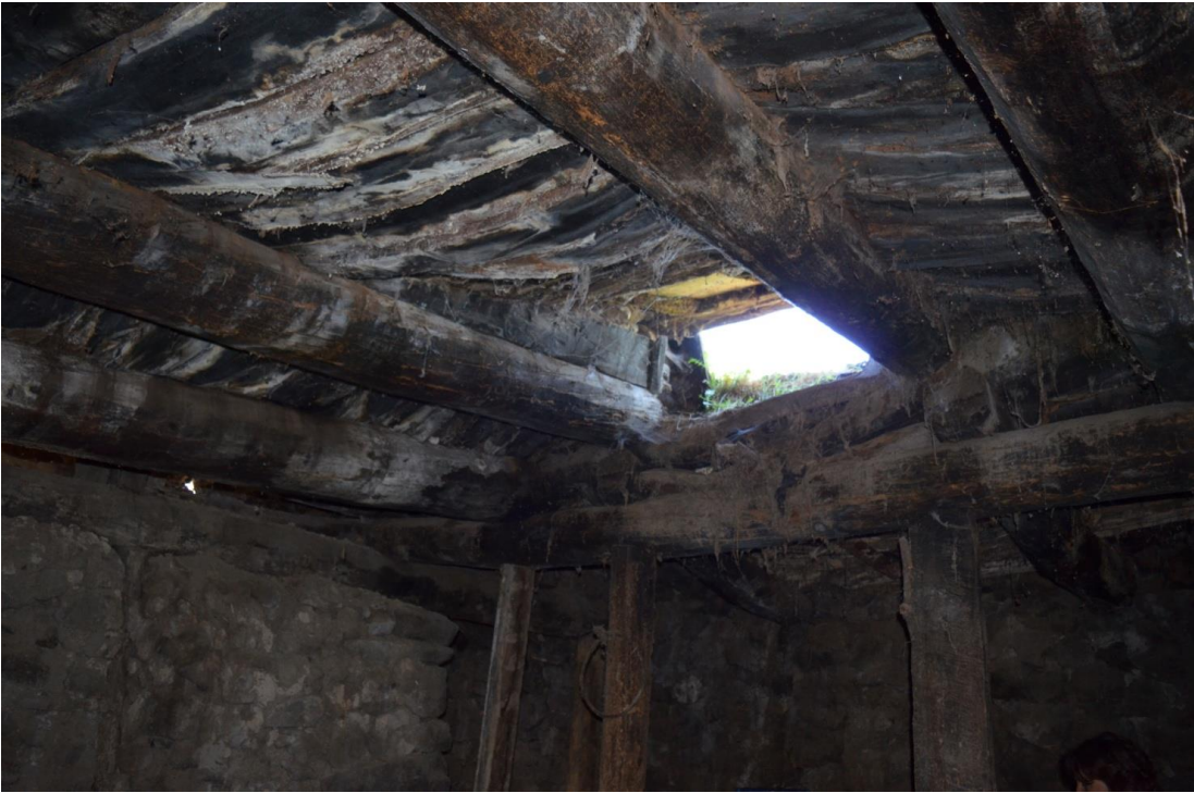
სურ. 2.64 გოდერძი მაზმიშვილის დარბაზოვანი ნაგებობა. თაკარებიანი ოდა. 2019 წ.