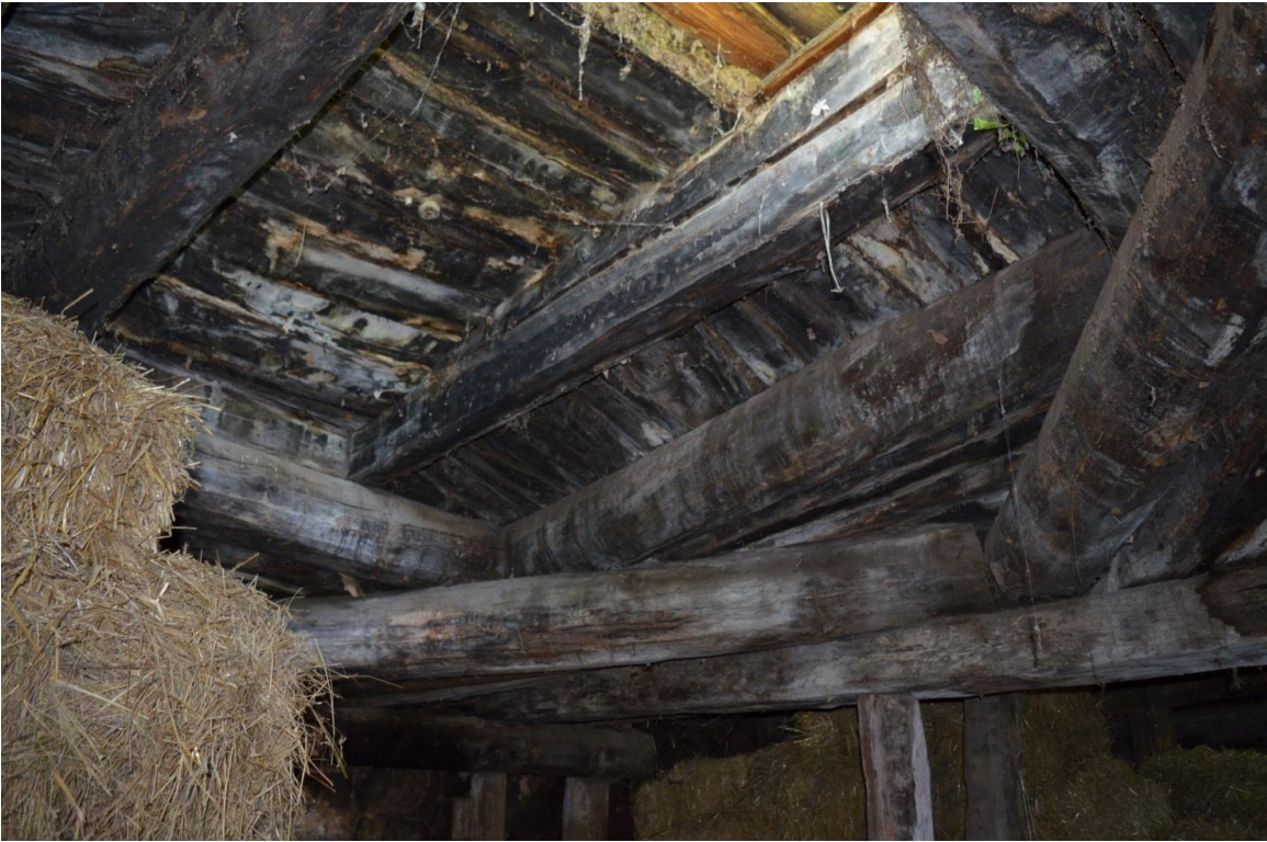
სურ. 2.62 გოდერძი მაზმიშვილის დარბაზოვანი ნაგებობა. სეგმენტის ცენტრულ-გვირგვინული და გრძივ-გვირგვინული გადახურვა. 2019 წ.