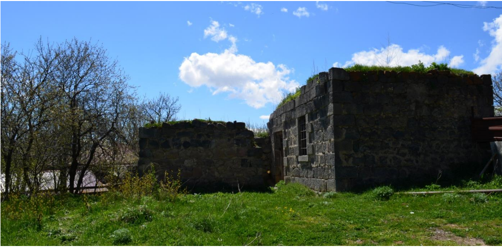
სურ. 2.48 პავლე

კელოშვილის დარბაზოვანი ნაგებობა. 2019 წ.