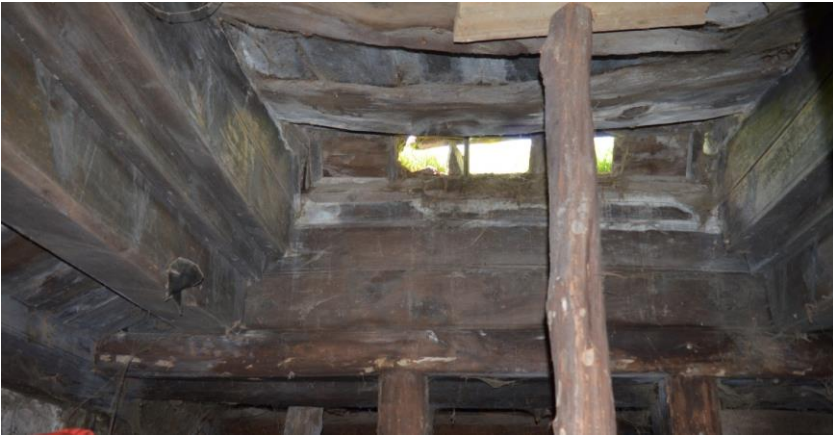
სურ. 2.41 ლუბა კელოშვილის დარბაზოვანი ნაგებობა. ოდის თაკარებიანი გადახურვა. 2019 წ.