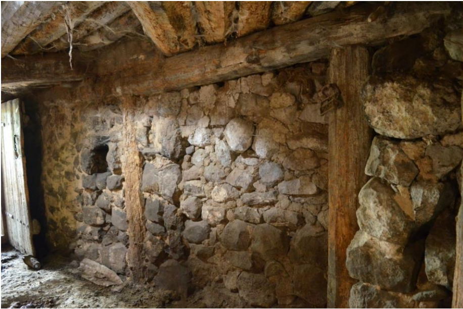
სურ. 2.46 ელდარ მურადაშვილის ერდო-გვირგვინიანი დარბაზი. ინტერიერი. 2016 წ.