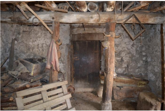
სურ. 2.39 ლუბა კელოშვილის

კელოშვილის თანამედროვე საცხოვრებლის მარჯვენა მხარეს არსებული დარბაზოვანი ნაგებობა. 2019 წ.