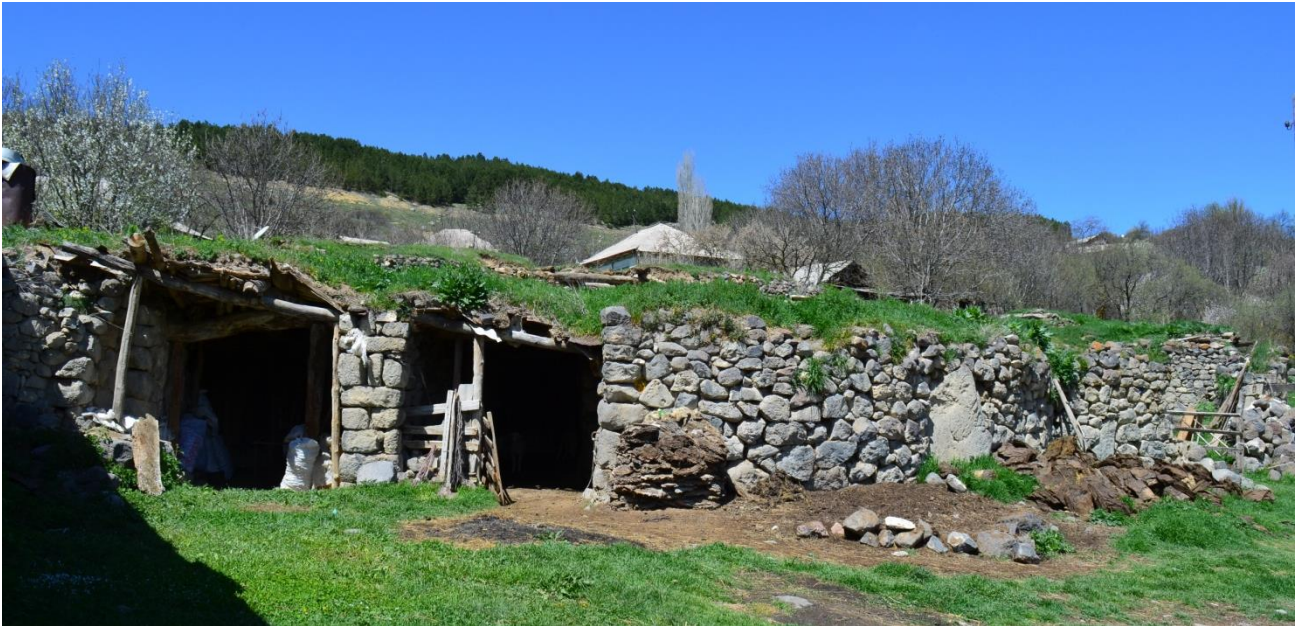
სურ. 2.60 გოდერძი მაზმიშვილის დარბაზოვანი ნაგებობა. 2019 წ.