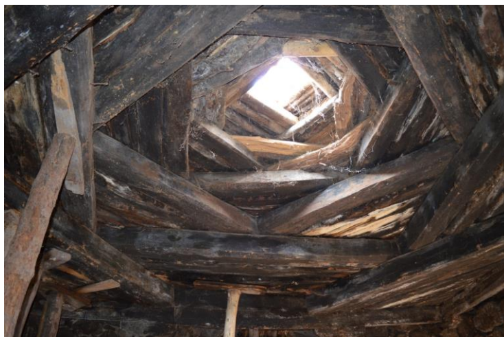
სურ. 2.24 ლუბა კელოშვილის დარბაზოვანი ნაგებობა. დარბაზში შესასვლელი. 2019 წ.