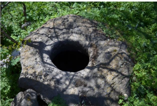
სურ. 2.50 ხარო. 2019 წ.