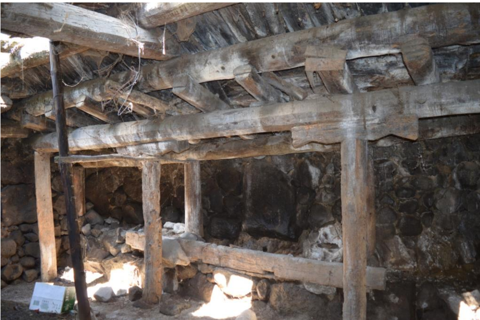
სურ. 2.59 პავლე

კელოშვილის დარბაზოვანი ნაგებობა. ახორი. 2019 წ.