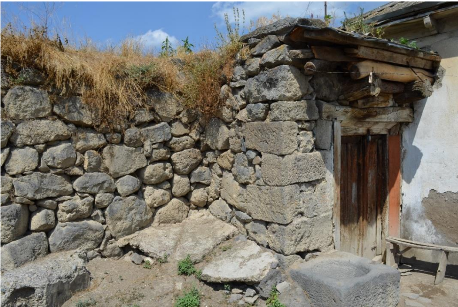
სურ. 2. 29 ლუბა კელოშვილის დარბაზოვანი ნაგებობა. ფასადის მხრიდან მესამე შესასვლელი. 2016 წ.