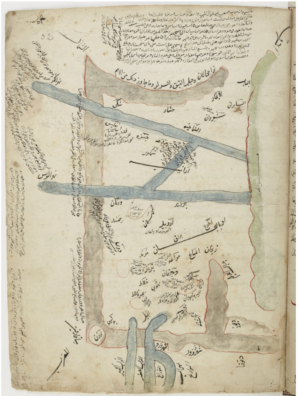
ფიგურა 2 იბნ ჰაუკალის რუკა (MS) Arabe 2214