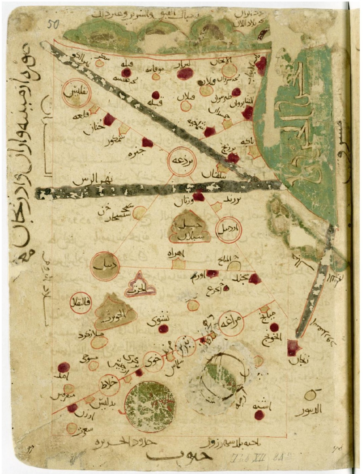
ფიგურა 1 აღ-იხტახრის რუკა (MS) Orient. A. 1521