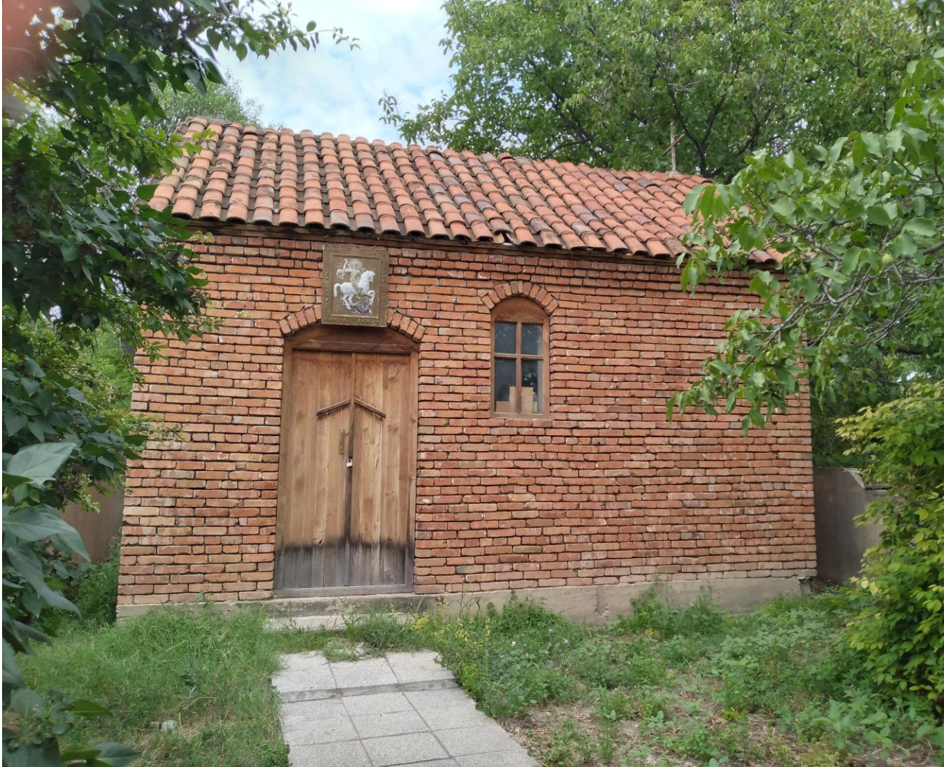
სურ : 5 წმ. გიორგის ეკლესია