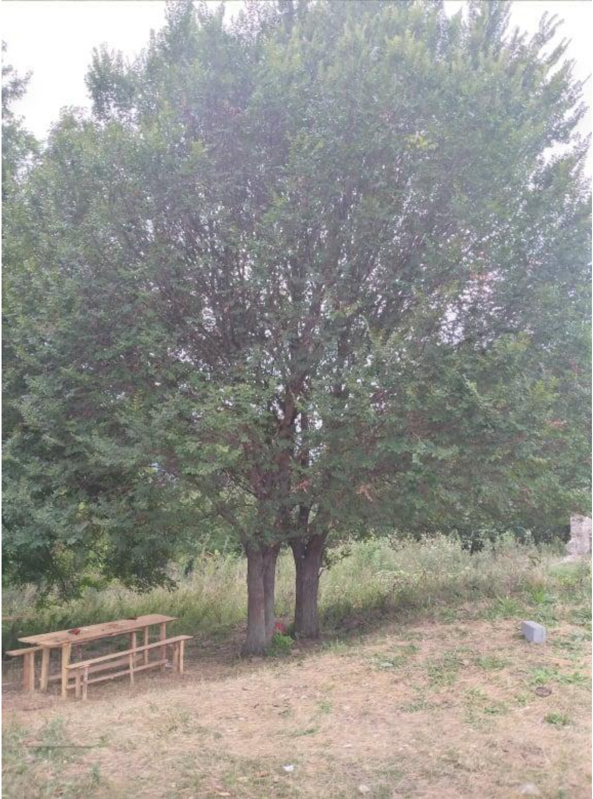
სურ: 9 თელას ხე