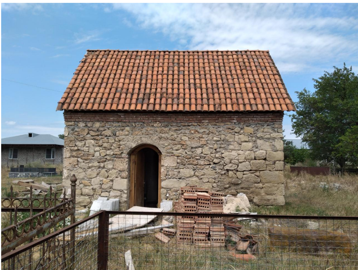
სურ : 4 მოხისის სვეტიცხოვლის ეკლესია