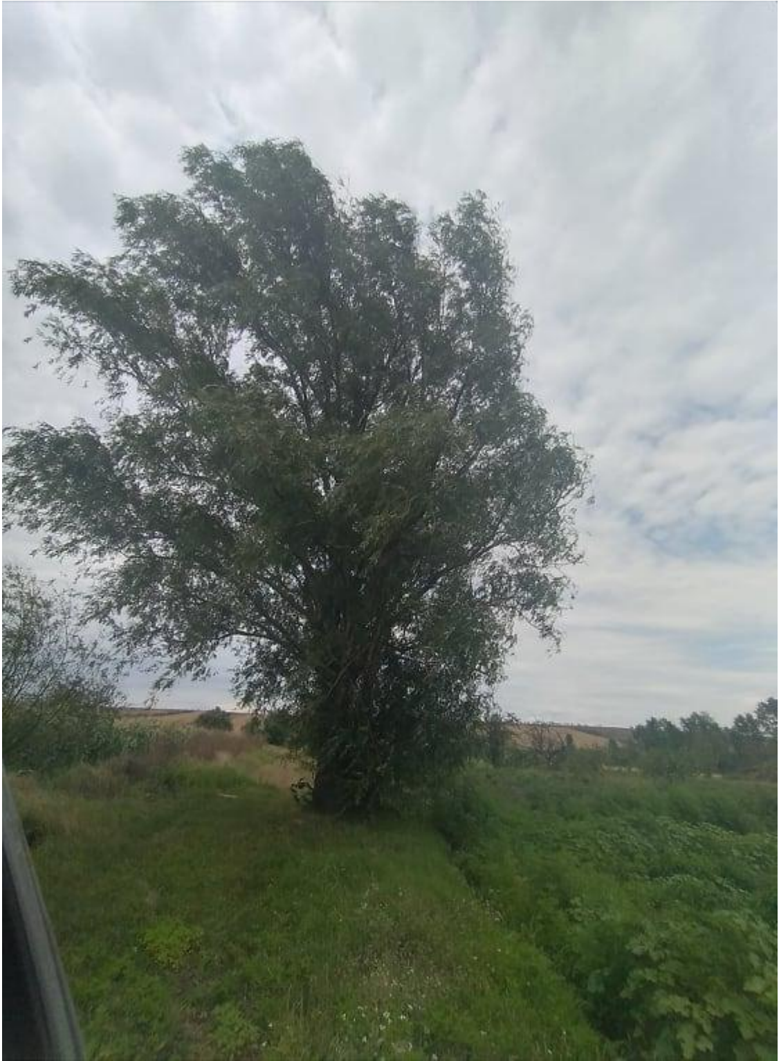
სურ : 10 ოლეს ხე