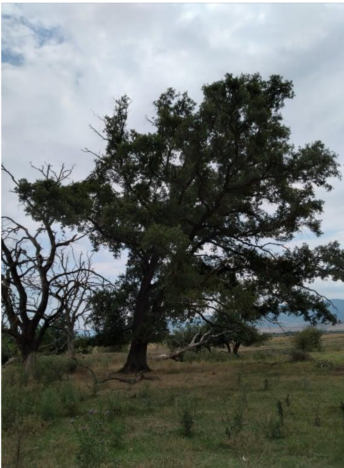
სურ : 8 მუხის ხე

სურ: 7 წარწერა, რომლიდანაც ვიგებთ, თუ როდისაა აგებული კვირაცხოვლის ეკლესია