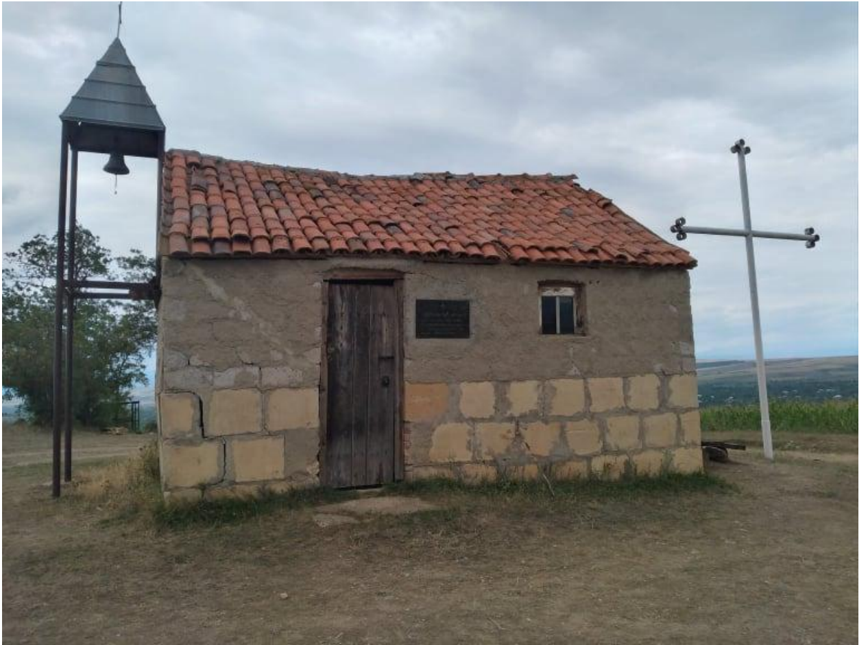
სურ : 6 კვირაცხოვლის ეკლესია