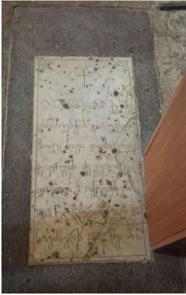
სურ: 2 საფლავის ქვა, რომელიც არის წმინდა გიორგის ეკლესიაში