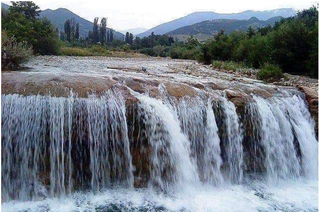
სურ. 10: ლოლანთ ჩანჩქერი