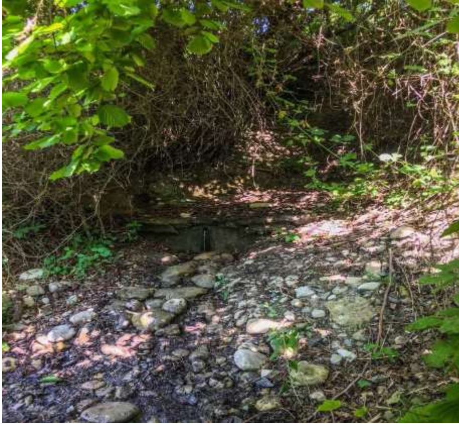
სურ. 9: ლოლანთ წყარო