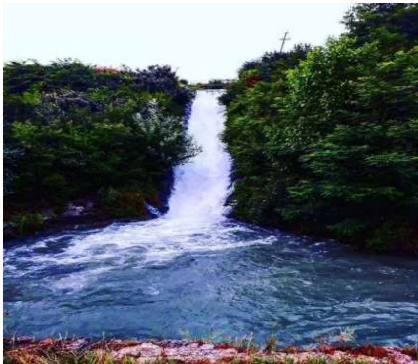
სურ. 8: ქეცხურის ჩანჩქერი