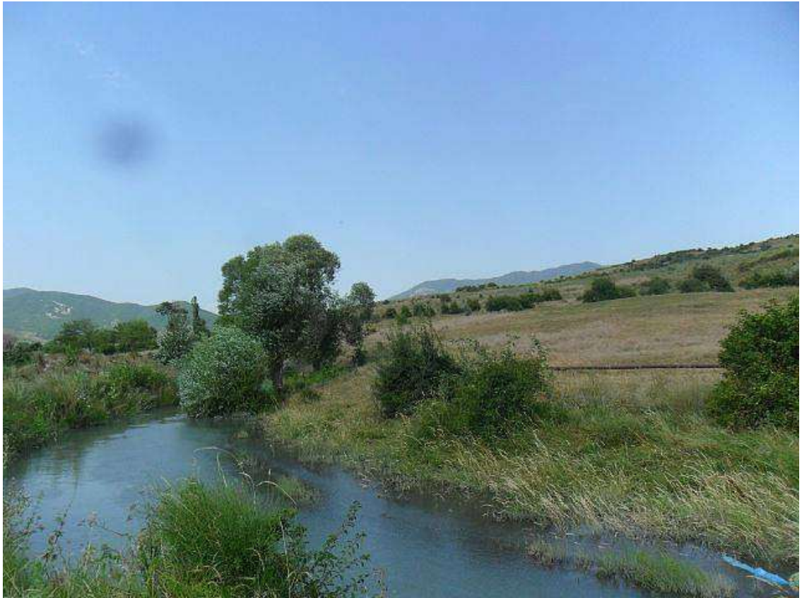
სურ. 7: მდინარე მეჯუდა