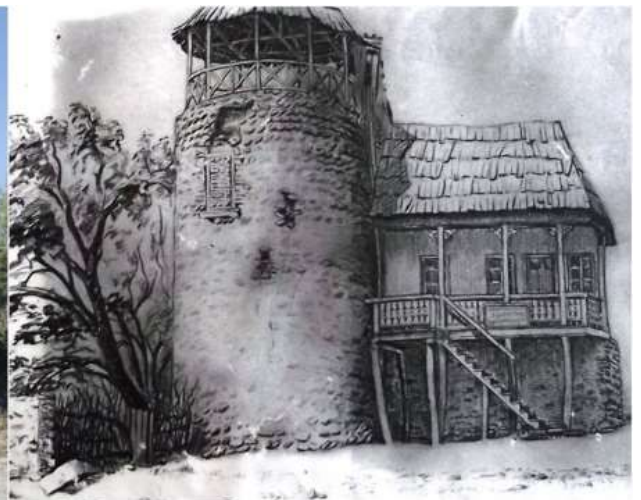
სურ. 6: მირმანოზ ერისთავის ციხე-სასახლე