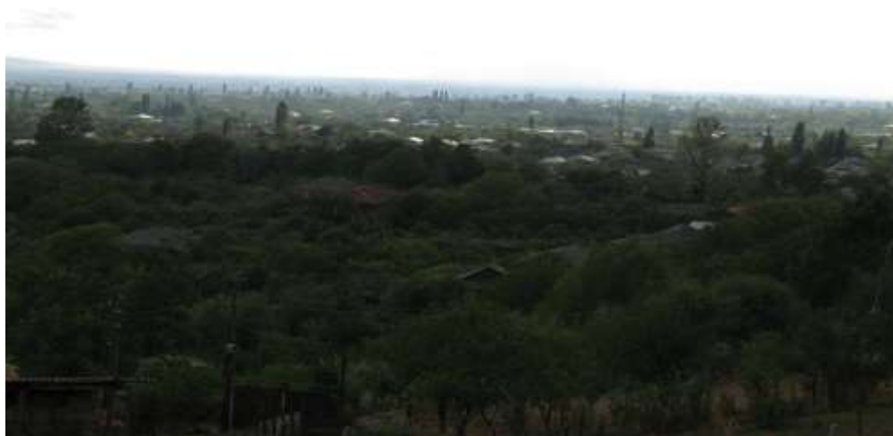
სურ. 1: სოფელი მეჯვრისხევი