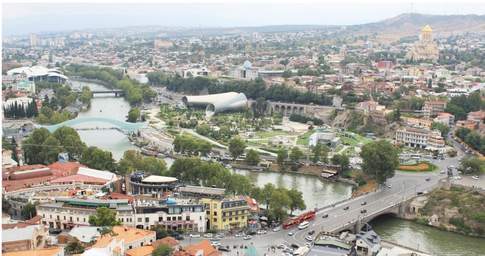
სურ. 2. მტკვრის მარცხენა სანაპიროს მცირე ზოლის „დაბრუნება“ ფეხით მოსიარულეთათვის თბილისში, რიყის პარკის მიმდებარედ. წყარო: Traveler photo, ე.სოროკინის ფოტო: „ხელი რიყის პარკზე ნარიყალას ციხე-სიმაგრედან“, 2019 წ. ნოემბერი.

მხოლოდ მცირე მონაკვეთზე – რიყის პარკის მოწყობისას გახდა შესაძლებელი სანაპირო ზოლის „დაბრუნება“ ფეხით მოსიარულეთათვის. ეს მოვლენები, რომლებიც დაფიქსირებულ იქნა ქალაქის ისტორიულ გარემოში ტრანსპორტის მოწესრიგებისადმი მიძღვნილ სტატიაში [Giorgi Giorgadze. The Development of Transport Infrastructure Among Cities with a Cultural Heritage (on the example of Tbilisi, Georgia). The History of Land Transport, 2017, 3 (1)], ნათელს ხდის, თუ რაოდენ მნიშვნელოვანია ფეხით მოსიარულისთვის პრიორიტეტის მინიჭება ქალაქის ისტორიულ გარემოში და რარიგ ძლიერია ამ გარემოების გავლენა ტურისტული ნაკადების გადაადგილებაზე (სურ.2).