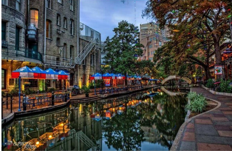
სურ. 4. ტურისტულ ბიზნესს მორგებული, ატრაქტული სივრცე მცირე მდინარის კალაპოტში. სან-ანტონიო, აშშ.

თემის საერთო სამეცნირო აქტუალობა, მოსალოდნელი შედეგების მნიშვნელობა თბილისის სივრცითი განვითარების პროცესის გაუმჯობესების და ქალაქისათვის სასიცოცხლოდ მნიშვნელოვანი ინვესტიციების მოზიდვის შესაზღებლობით, განსაზღვრავენ კვლევის დასახული მიმართულების გაღრმავების მიზანშეწონილობას.