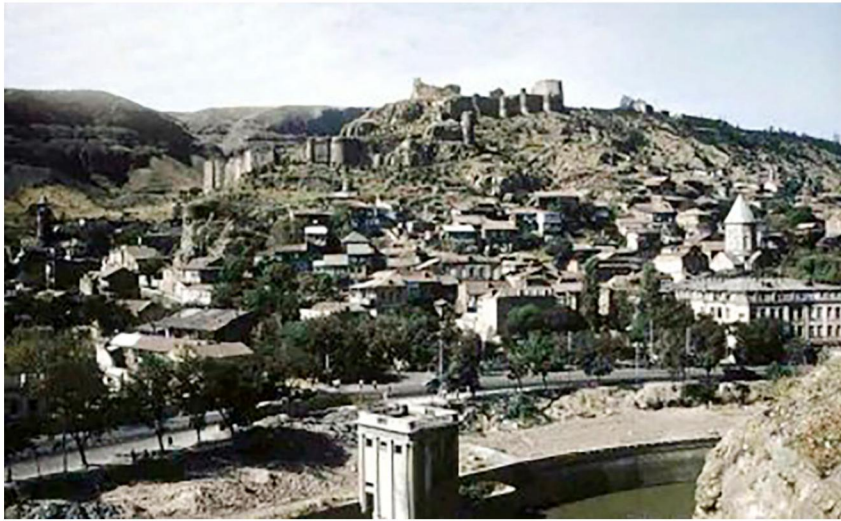
სურ. 1. მტკვრის მაჯვენა სანაპირო თბილისში, აბანოთუბნის მიდამოებში. ავტომაგისტრალის მშენებლობამ მდინარესთან ფეხმავლებს მისასვლელი გადაუკეტა.

მდინარე მტკვარი, როგორც ცნობილია, ქვეყნის მთელს ტერიტორიას კვეთს – თურქეთიდან აზერბაიჯანამდე. აღმოსავლეთ საქართველოს ქალაქების და დასახლებული პუნქტების უდიდესი ნაწილი მტკვრის მიმდებარე ტერიტორიებზეა განვითარებული. თბილისის ურბანულ სივრცეში მტკვარი ნათლად აღიქმება მისი კალაპოტის და ნაპირების „მოჭრილი“ კონტურებით, რომლებიც ხისტად გამოყოფენ მდინარეს მიმდებარე გარემოდან, ერთგვარ სივრცით იზოლაციაში აქცევენ მას. მტკვრის ამგვარ იზოლაციას სათავე დაუდო 40-იანი წლების დასასრულს და 50-იანი წლების დასაწყისში გამლილმა სანაპიროების მშენებლობამ თბილისში, რის შედეგადაც მდინარე ფიქსირებული ჯებირებით და მიმდებარე ჩქაროსნული სატრანსპორტო მაგისტრალეებით მთლიანად მოწყდა ქალაქის ისტორიულ განაშენიანებას და ჩაიკეტა ფეხმავალთა ნაკადებისთვის (სურ. 1).