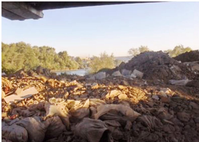
სურ. 3. სამშენებლო ნაგვით დაბინძურებული მტკვრის მარჯვენა სანაპირო დიდძალ ჭალების რაიონში, თბილისში. წყარო: გ.გიორგაძის საავტორო ფოტო, 2012 წ. აგვისტო.

თბილისის მიწათმოწყობის ახალ გენერალურ გეგმაში (2019) დეტალურად არის გაანალიზებული მდინარის დომინირებული პოზიცია თბილისის წრფივი განვითარების საკითხში და შეფასებულია ურბანული განვითარების პერსპექტივები სანაპიროების ჩართულობის გამოყენებით საერთო საქალაქო რეკრეაციული სივრცეების შექმნის კუთხით.