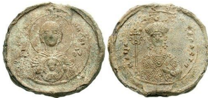
მონეტის ავერსზე გამოსახულია მართა-მარიამი, ხოლო რევერსზე ღვთისმშობელი მარიამი ჩვილ იესოსთან ერთად