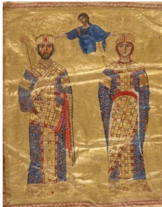
იმპერატორი ნიკიფორე III და დედოფალი მარიაში