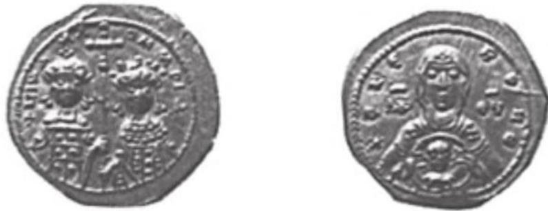
მონეტის ავერსზე გამოსახულია მართა-მარიამი და მიხეილ დუკა, ხოლო რევერსზე ღვთისმშობელი მარიამი ჩვილ იესოსთან ერთად