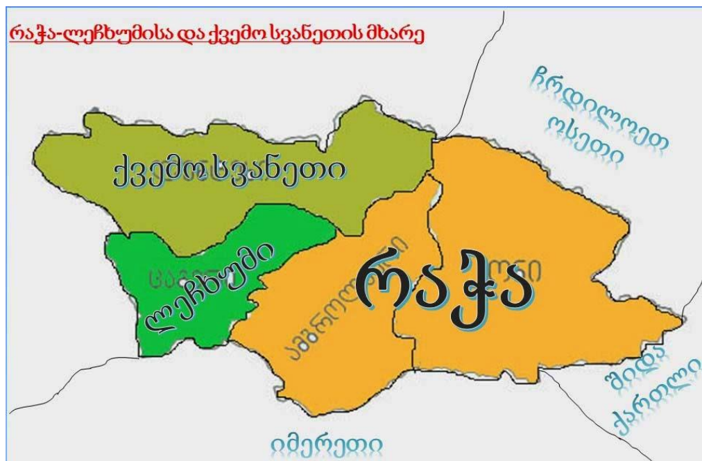
რუკა 2.1.1 რაჭა-ლეჩხუმის და ქვემო სვანეთის მხარე

თანამედროვე რაჭა მოიცავს ამბროლაურისა და ონის მუნიციპალიტეტებს.