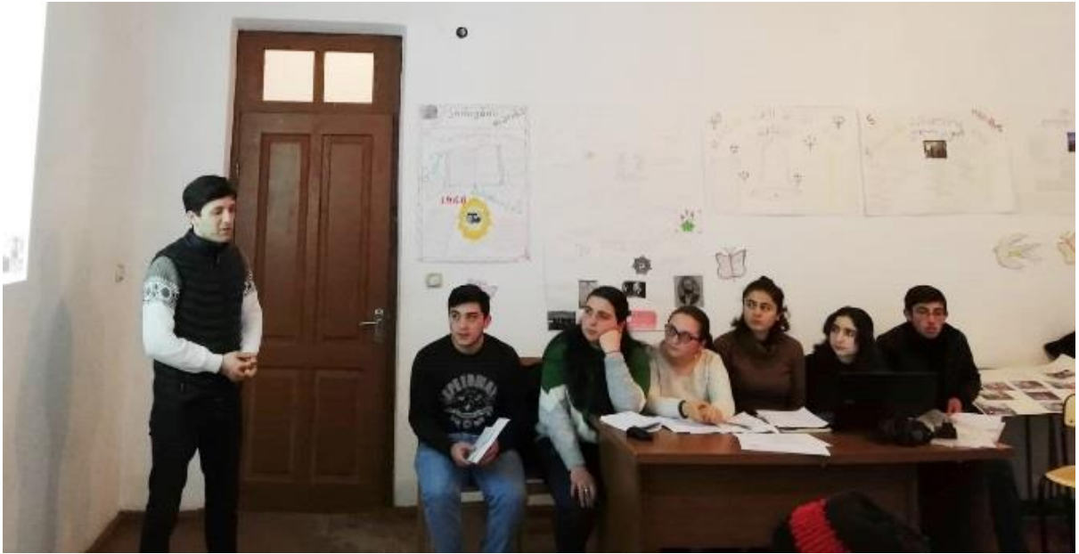
სურათი 1: მინი ლექცია მოსწავლეების საჭიროებების გათვალისწინებით