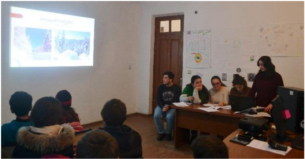
სურათი 3: მოსწავლის მიერ წარდგენილი პროექტები