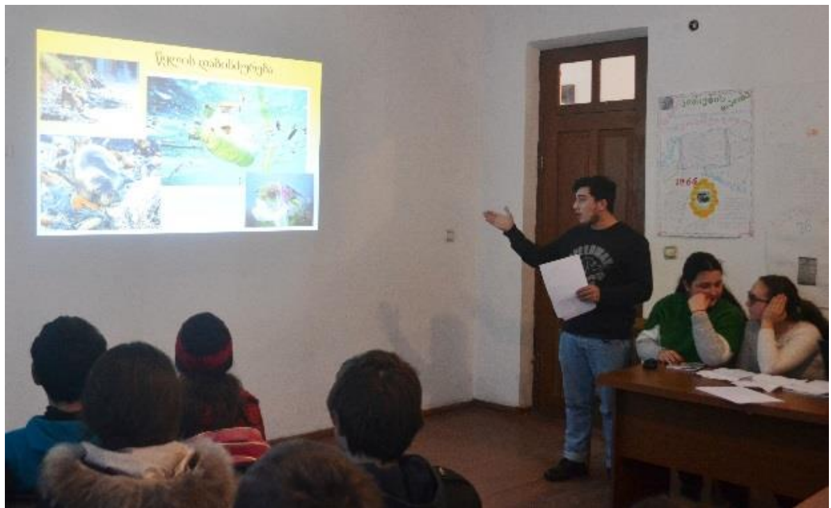
სურათი 2: მოსწავლის მიერ წარდგენილი პრეზენტაცია