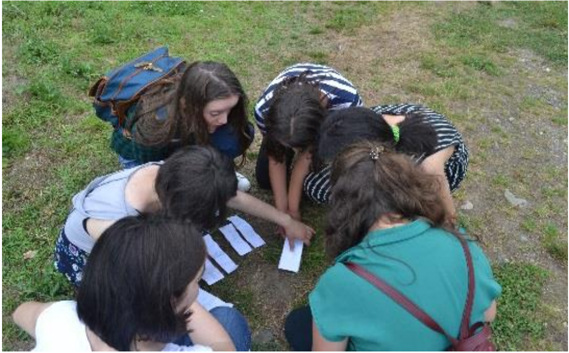
სურათი 3: აქტივობა 'ორიენტირება სივრცეში'