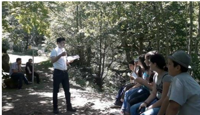
სურათი 1: ინსტრუქციის მიცემის პროცესი

შეჯამება მოიცავდა ერთმანეთში საუბარს, აზრთა გაზიარებას, კითხვა-პასუხს და შეფასებას.