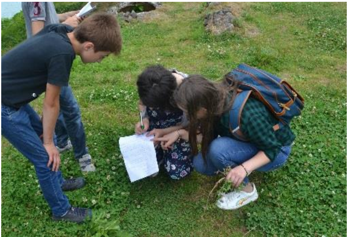
სურათი 2: აქტივობა 'კოლექციონერები'