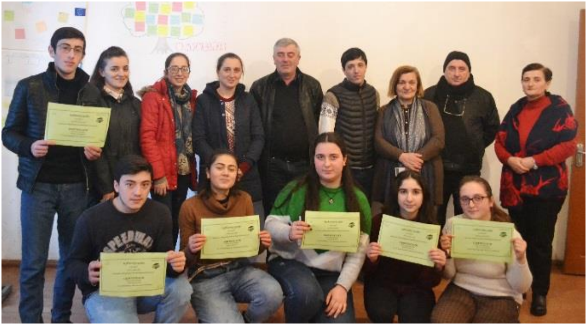
სურათი 4: შეჯამება და წამახალისებელი სერთიფიკატების გადაცემა