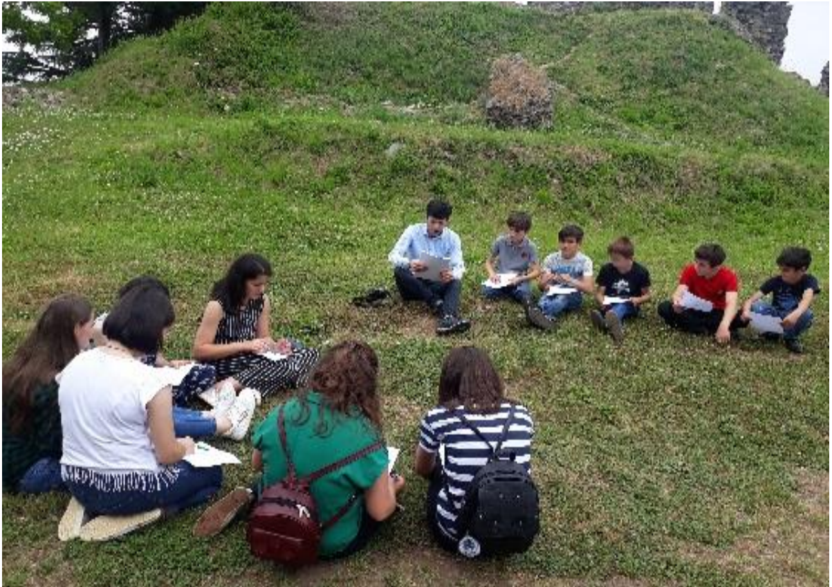
სურათი 4: აქტივობა 'ტექსტზე მუშაობა'