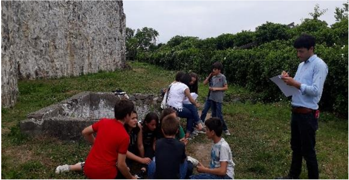
სურათი 1: აქტივობა 'სურათის აღწერა'