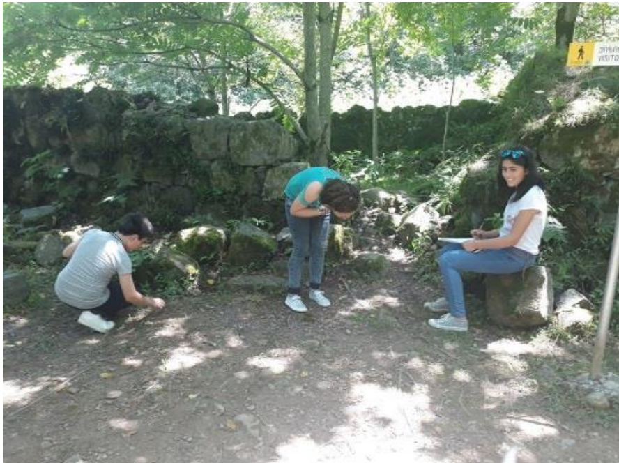
სურათი 4: მოსწავლეები მუშაობის პროცესში