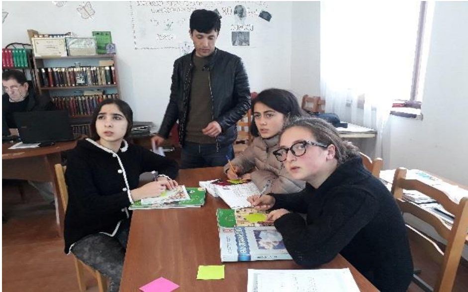
სურათი 1: მუშაობა ინგლისურ აქტივობაზე