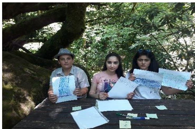
სურათი 2: გაკვეთილის შეჯამება ორიგინალური გზით