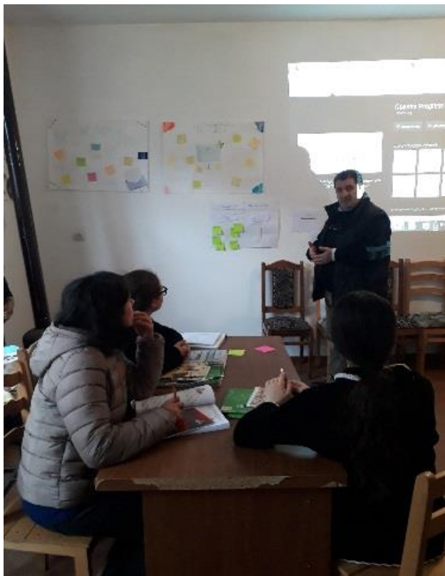
სურათი 2: მუშაობა მათემატიკურ აქტივობაზე