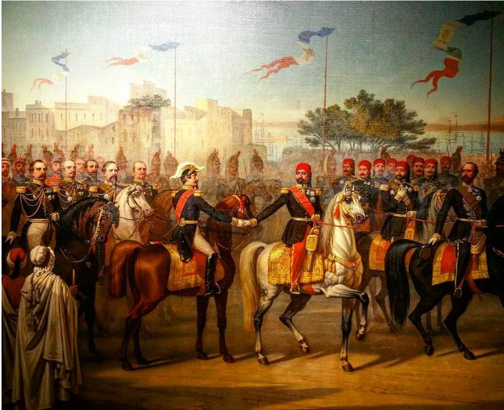
ილუსტრაცია 7. ავტორი: Alexandre Debelle (1805-1897). Napoléon III et Sadok Bey à Alger. წყარო: გამოიფინა თუნსში კასრ ელ-საიდის დარბაზში. ნახატი შექმნილია 1862 წელს, მარჯვენა მხარეს სადუკ ბეის უკან ვხედავთ მამლუკებს.