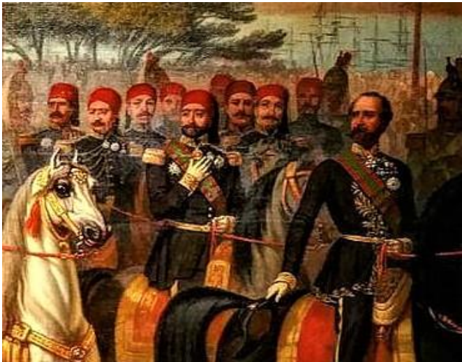
დეტალი ამავე ნახტიდან