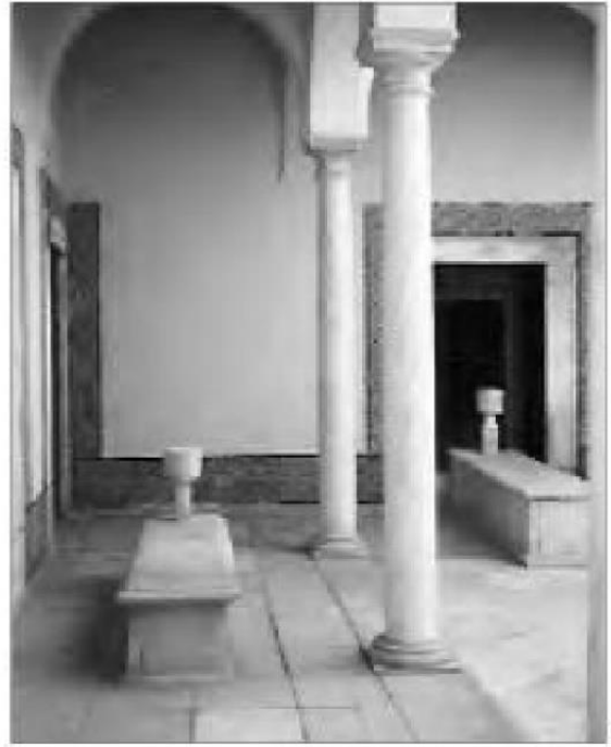
ილუსტრაცია 2. Moustapha Saheb Ettabâa, Grand vizir de la Régence de Tunis. მისივე საფლავი თურბათ ალ-ბეიში, თუნისი.