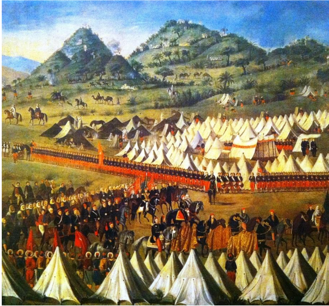
ილუსტრაცია 5. Giuseppe Ancona Trapanese; Le camp de la m'halla ნახატი შექმნილია 1868 წელს, ცენტრში, მმართველის უკან ვხედავთ მამლუქებს