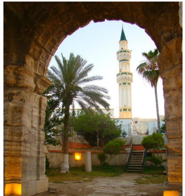
ილუსტრაცია 15. გურჯის მეჩეთი ქალაქ ტრიპოლიში