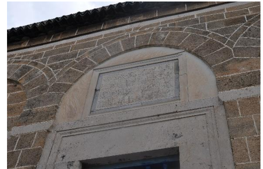
ილუსტრაცია 1. Sami Mlouhi, ლაზის მავზოლეუმი და ლაზის მეჩეთი.