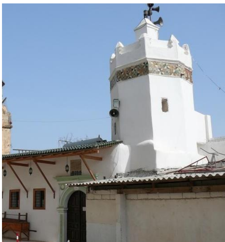
ილუსტრაცია 14. ალ-ბარანის მეჩეთი, ძველი საფოსტო ბარათი, მეჩეთის თანამედროვე ფოტო, წყარო: en.wikipedia.org/wiki/El_Barani_Mosque