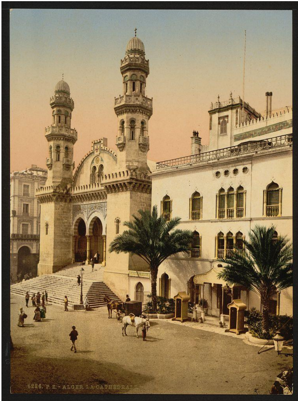
ილუსტრაცია 12. ალჟირის კათედრალი 1899 წ. ფოტოზე გამოსახულია ქეჩაუას მეჩეთი და ჰასან დეის სასახლე.