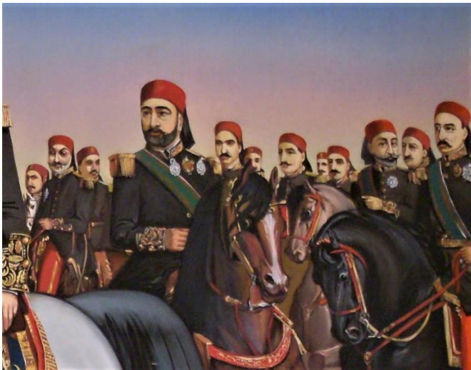
დეტალი ამავე ნახატიდან