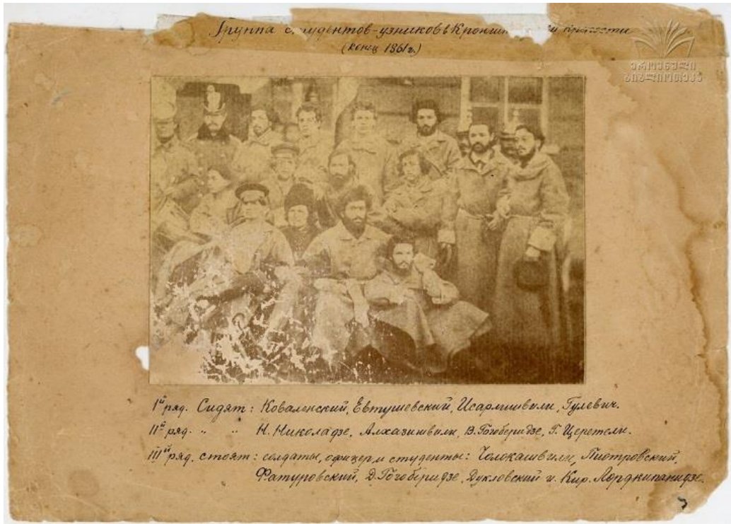
ეს გახლავთ სწორედ ციხეში გადაღებული სურათი ქართველ და რუს სტუდენტებთან ერთად. (1861წ)

ამის შემდეგ ნიკომ სწავლას თავი დაანება და საცხოვრებად ქალაქის გარეუბანში აკაკი წერეთელთან ერთად გადავიდა, ამ დროისთვის იგი უკვე ფლობდა ფრანგულ და რუსულ ენებს, მოგვიანებით შეისწავლა ინგლისური იტალიური და გერმანული. 1863 წელს ნიკო უკვე დაბრუნდა საქართველოში, თუმცა, დიდხანს არც აქ გაჩერებულა. სწავლა პარიზში, სორბონას უნივერსიტეტში განაგრძო. იქ ძალიან ბევრს შრომობდა, სწავლობდა, კითხულობდა, ეცნობოდა ფრანგულ სოციალიზმს. თუმცა, დიდად მოხიბლული არ დარჩენილა. მოგვიანებით წერდა, დიდი არაფერი ყოფილა ეს „ფრანციცული სოციალიზმი“, ვზივარ, 18 საათს ვმუშაობ ბიბლიოთეკაში, ძალიან ბევრი შრომა მიწევსო.